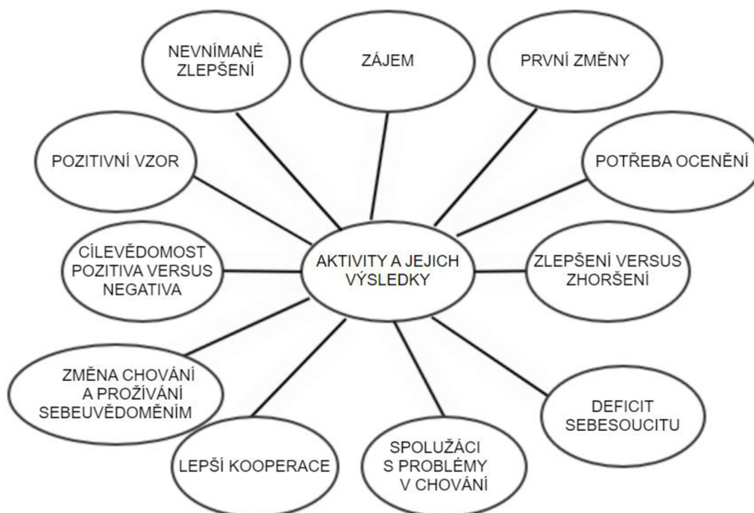
Obrázek 3 Aktivity a jejich výsledky

Výsledky dotazníku byly, stejně jako rozhovor (ukázka viz Příloha C) a pozorování, zpracovány za pomoci metody kódování a jednotlivé kódy byly nejprve zaneseny do přehledové tabulky a později byla vytvořena myšlenková mapa.