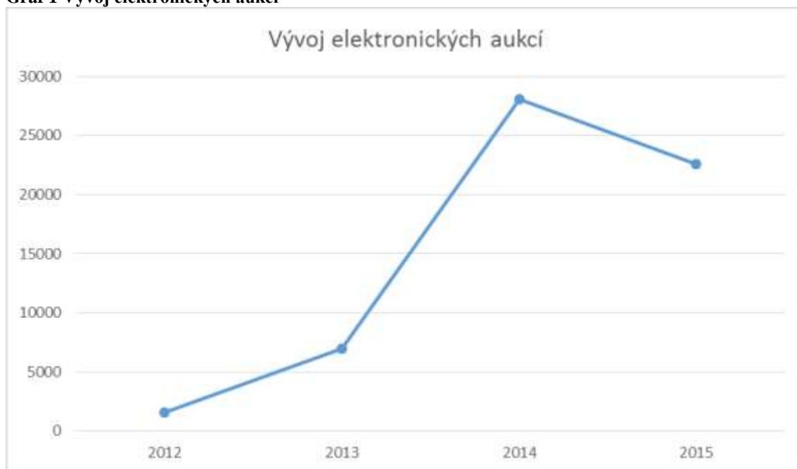
Graf 1 Vývoj elektronických aukcí

s kladným výsledkem, tj. byla uzavřena smlouva), v roce 2013 bylo provedeno 6 994 aukcí, v roce 2014 celkem 28 095 aukcí a v roce 2015 celkem 22 562 aukcí (MMR, 2015).