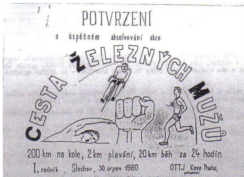
Obrázek č.4: Potvrzení o účasti na závodě ve Stochově(Podzimek,1990,s.4)

Tragickou smrtí ředitele závodu Jana Závory skončil Stochovský triatlon třetím ročníkem.