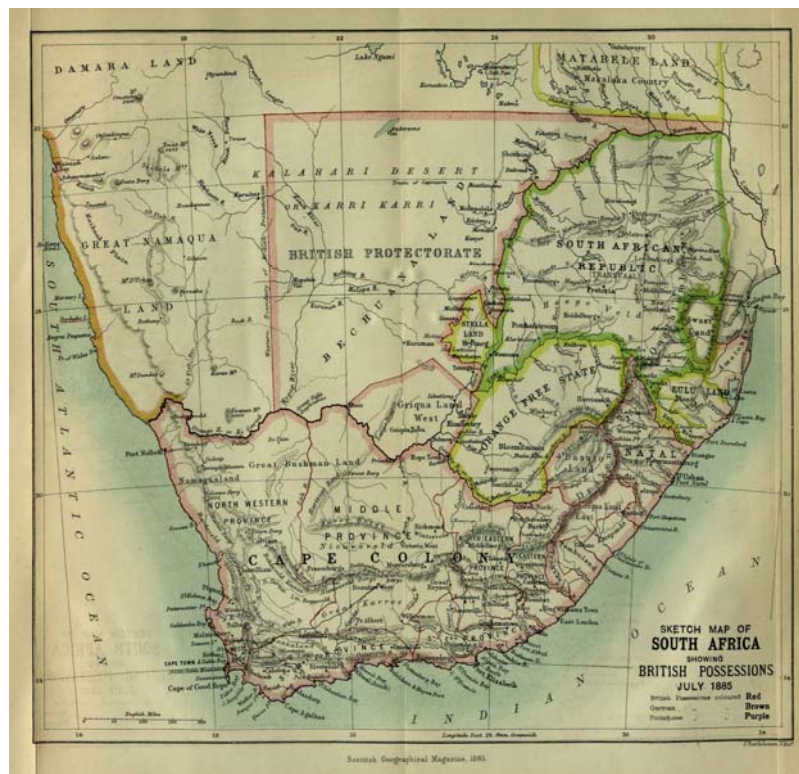
Obrázek 7: Jižní Afrika v roce 1885