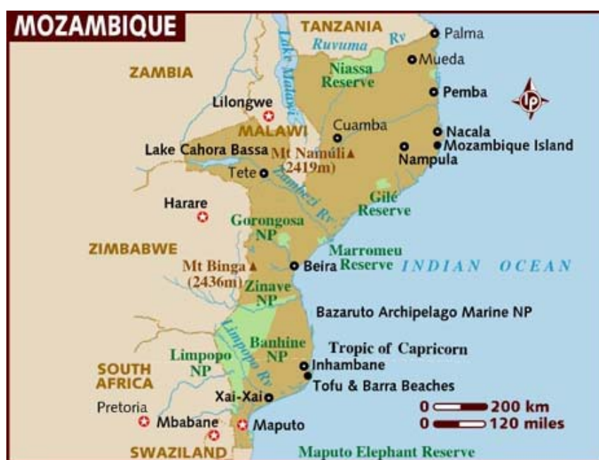
Obrázek 3: Mapa chráněných území Mozambiku

Kombinace války, neprůhlednosti řízení parků a neadekvátní odborné kapacity na utváření politik ochrany přírody vedly k tomu, že zvířata i prostředí jsou vyčerpaná a chybí důrazná iniciativa, která by vedla k zavedení účinného ochranného opatření. Jedinou větší aktivitou na ochranu přírody je přeshraniční park Velké Limpopo na hranicích s JAR a Zimbabwe. Ochrana přírody je silně podporována zahraničními organizacemi (WWF, donorské agentury). Přehled chráněných území v Mozambiku je uveden v obrázku 3.