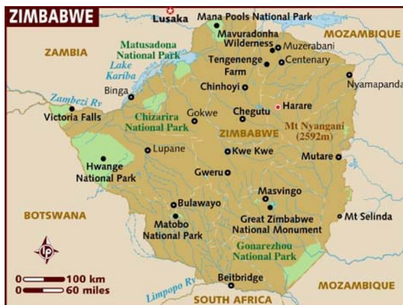
Obrázek 6: Mapa chráněných území Zimbabwe

Politika ochrany přírody nastavená zákonem z roku 1975 se do dnešní doby změnila jen málo. Kvůli vysoké inflaci a socialistickému režimu má země nízkou kvalitu služeb a nemůže proto konkurovat okolním státům v nabídce turistických aktivit. Chráněno je asi 12,5 % rozlohy země 22 . Země se potýká s řadou environmentálních problémů: znečištění vodních toků, deforestace, půdní eroze a další. Chráněná území v Zimbabwe jsou vyznačena na obrázku 6.