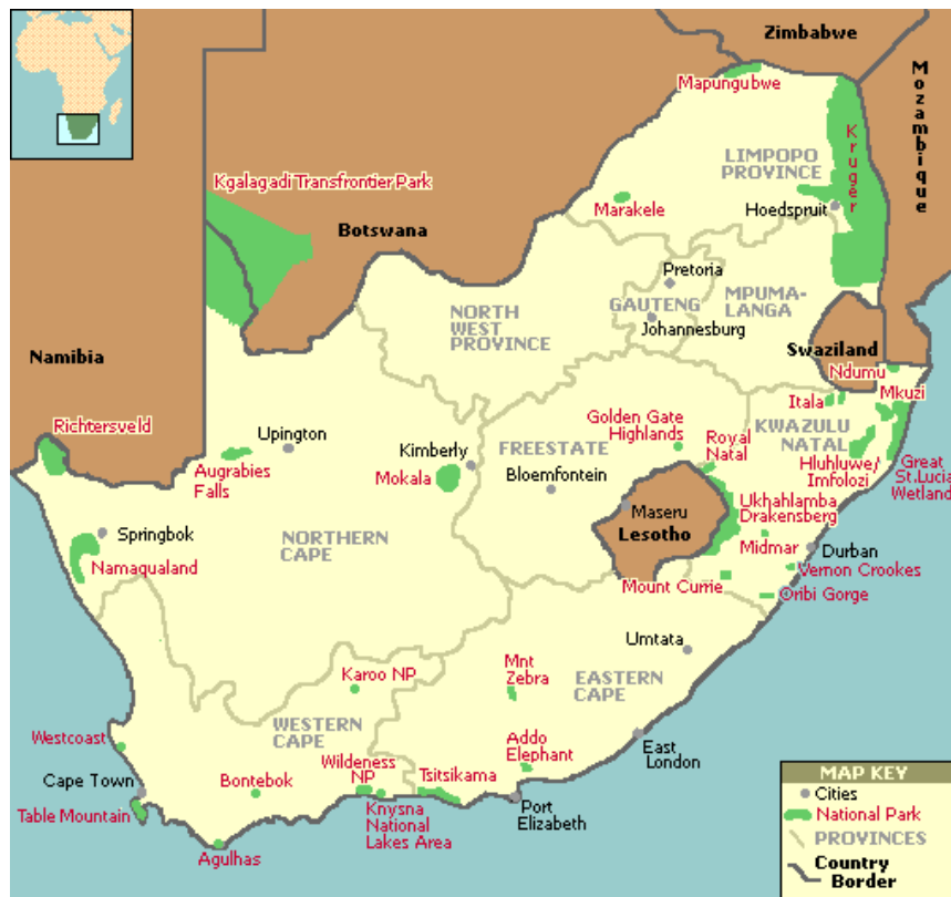
Obrázek 2: Mapa chráněných území v Jihoafrické republice