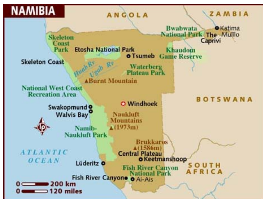
Obrázek 4: Mapa chráněných území Namibie