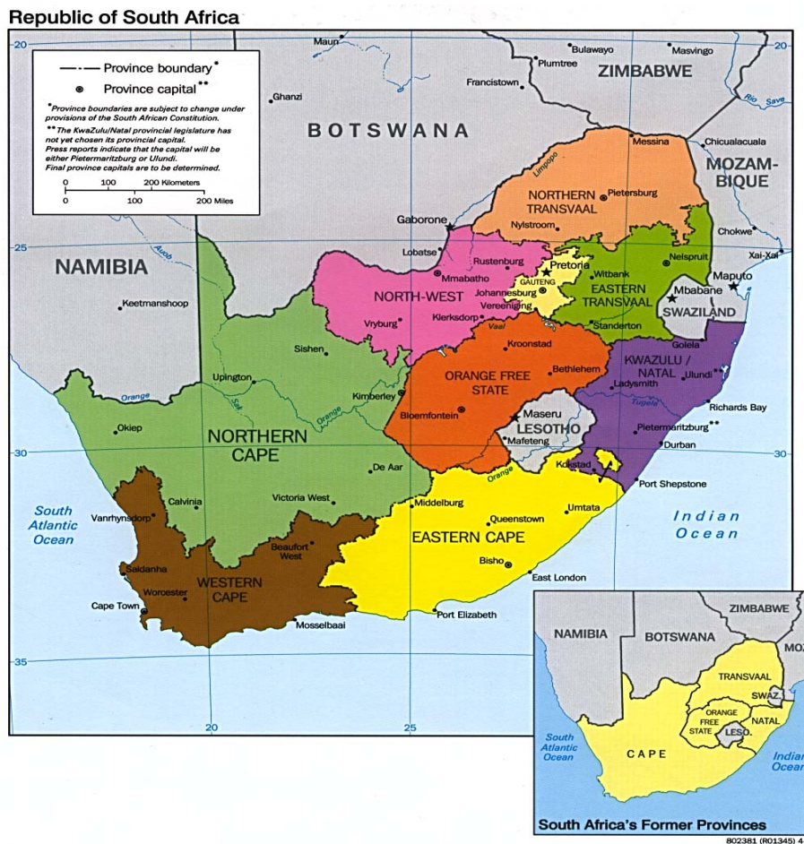
Obrázek 8: Mapa Jihoafrické republiky v roce 1995 a její bývalé provincie