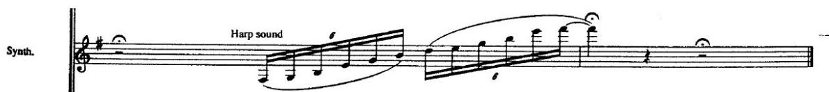
(Obr. č. 1)

Následující sonda je příkladem jazzové harmonie v R'n'B skladbě If You Love Somebody Set Them Free z alba Dream of the Blue Turtles : v refrénu se střídají dva akordy Dm 7 a G 9 . V bridgi se objevují kvartové akordy Fsus4. 131 Na konci skladby Children's Crusade z téhož alba je použit tónický vícezvuk E- 11 s přidanou sextou. 132 Podobně na konci skladby Straight To My Heart z alba ...Nothing Like The Sun klávesista K. Kirkland použil na konci tento nónový akord: