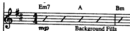
(Obr. č. 11)

Improvizace a vlastní nápady jazzového hudebníka se projeví nejmarkantněji v jazzových sólech. Zároveň je možno na jazzových sólech indikovat všechny doposud zmiňované principy jazzové hudby. Každý akord v harmonické progresi má svou stupnici a kombinace těchto tónů hudebníci při improvizaci podle vlastního uvážení používají (případně obohacují nedoškálnými tóny). Všimněme si, že v saxofonovém sóle z intra skladby Englishman In New York z alba ...Nothing Like The Sun (Obrázek č. 12) jsou použity kombinace tónu cis, dis, e, fis, gis, a h – tedy pouze doškálné tóny stupnice cis moll diatonické. Ze zápisu je dále patrné, že saxofonista Branford Marsalis užívá z hlediska metroritmického synkopy.