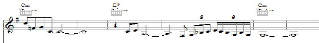
(Obr. č. 5)

Ve skladbě When The Angels Fall 150 z alba The Soul Cages se setkáváme s tím, že použitím modální harmonie dosahuje skladatel meditativního tajemného ražení skladby. Z poslechu nabudeme dojmu, že je „něco jinak“ – jinými slovy nejsme schopni určit základní tón a tónorod. V intru a ve slokách se nachází tato stupnicová řada (mód): c, d, es, f, g, a, hes, c. Půltóny se nachází mezi 2. a 3. a 6. a 7. stupněm, jedná se tedy o stupnici dórskou. Charakteristický interval je velká sexta. Z notového zápisu na Obrázku č. 5 (úryvek z kytarového sóla) vyčteme, že nota fis a nota h jsou snižovány posuvkami před notou tak, aby spadaly do dórského módu. Skladba vznikla za skladatelské spolupráce s Dominicem Millerem.