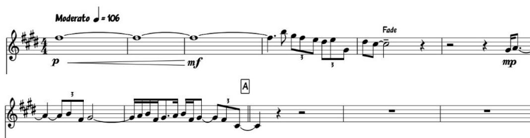
(Obr. č. 12)

Improvizace a vlastní nápady jazzového hudebníka se projeví nejmarkantněji v jazzových sólech. Zároveň je možno na jazzových sólech indikovat všechny doposud zmiňované principy jazzové hudby. Každý akord v harmonické progresi má svou stupnici a kombinace těchto tónů hudebníci při improvizaci podle vlastního uvážení používají (případně obohacují nedoškálnými tóny). Všimněme si, že v saxofonovém sóle z intra skladby Englishman In New York z alba ...Nothing Like The Sun (Obrázek č. 12) jsou použity kombinace tónu cis, dis, e, fis, gis, a h – tedy pouze doškálné tóny stupnice cis moll diatonické. Ze zápisu je dále patrné, že saxofonista Branford Marsalis užívá z hlediska metroritmického synkopy.