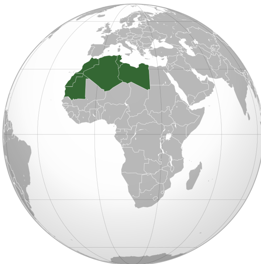
Obr. č. 2: Maghreb