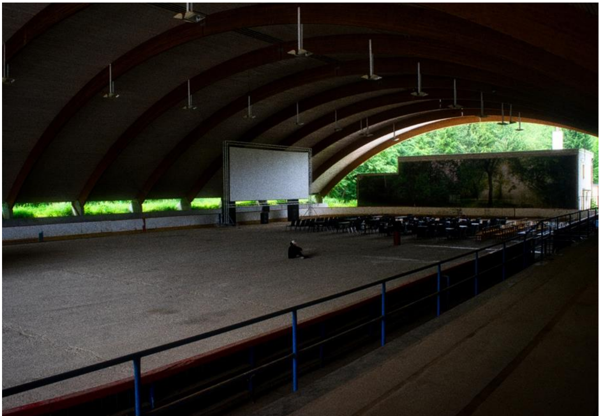
Fotografie č. 2 – etapa sportu

Volil jsem takovou kompozici a úhel focení, aby i divák který nerozumí hokeji a nepoznal by tak na první pohled ledovou plochu, pochopil, že se jedná o hokejový stadion. Jedná se o starý Vlašimský hokejový stadion, ve kterém jsem začínal hrát lední hokej. Je polokrytý a jedná se tedy o jeden z nejhezčích hokejových stadionů, kde jsem hrál. Bohužel se už nenachází v provozním stavu a slouží pro místní obyvatele pouze jako letní kino.