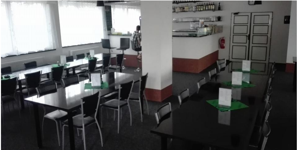
Obrázek č. 1: Interiér Pohostinství U sv. Floriána v Dubu nad Moravou

Pro lepší představu přikládám nejen fotografii hospody zevnitř, ale také fotografii zahrádky.