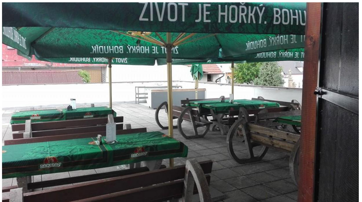
Obrázek č. 2: Exteriér Pohostinství U sv. Floriána v Dubu nad Moravou