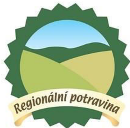
Obr. 1 Logo soutěže regionální potravina

výrobců. Regionální potraviny jsou dle něj jedinečné pro svoji kvalitu, tradiční recepturu, místní surovinu a znamenitou chuť.