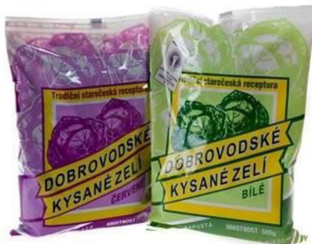
Obr. 11 Dobrovodské kysané zelí

zpracovává se v místních podmínkách dle tradiční receptury, kdy se do čerstvé krouhanky přidává jenom sůl a kmín.