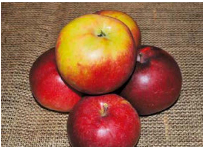
Obr. 9 Holovouský malináč

Podle MAS Podchlumí, z. s. (2020) se jedná o českou odrůdu, která byla vyšlechtěna v 18. stol. Doplnuje, že barva plodu je karmínově červená, s občasným prosvítáním zelené. Dodává, že výrazný znak představuje svalec ve stopeční jamce. Jak dále uvádí a název sám napovídá, chuť plodu je šťavnatá, sladce navinulá s malinovou příchutí.