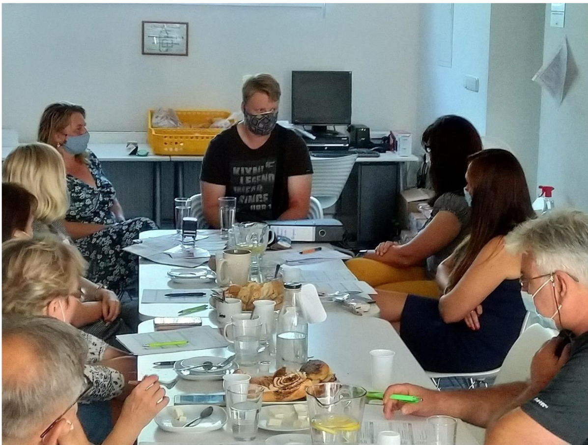
Obr. 14 Certifikační komise o udělení značky regionální produkt Podkrkonoší Zdroj: MAS Podchlumí, z. s. (2020)