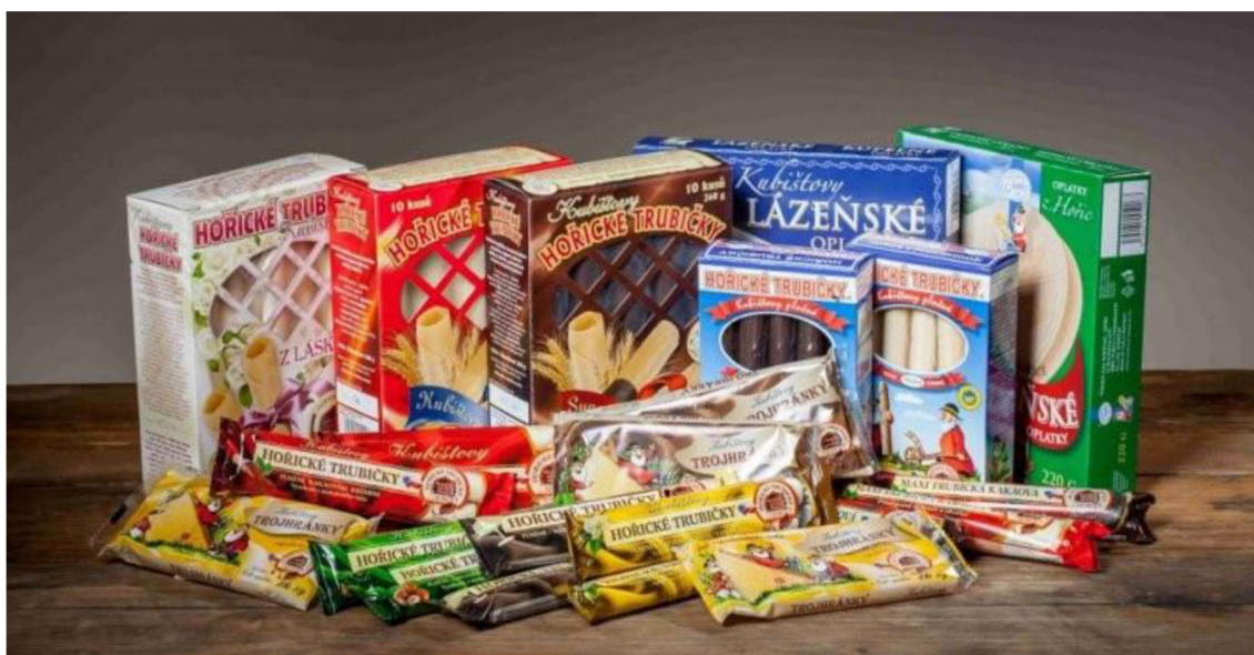
Obr. 10 Kubištovy hořické trubičky