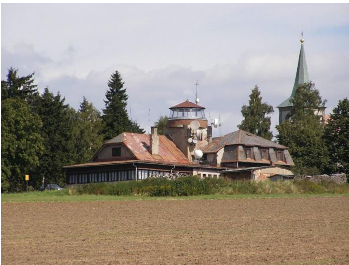
Obr. 7 Zvičina – Raisova chata

Jak dále zmiňuje, nachází se zde celá řada kulturních památek: (Masarykova věž samostatnosti v Hořicích, Kuks) a další turistické atrakce (ZOO ve Dvoře Králové nad Labem) apod., lázeňské městečko Lázně Bělohrad, které nabízí odpočinek v lázních v podobě procedur, ale také příjemné procházky v místní bažantnici. Nejvyšší horou tohoto regionu je Zvičina (672 m. n. m.); obrázek č. 7.