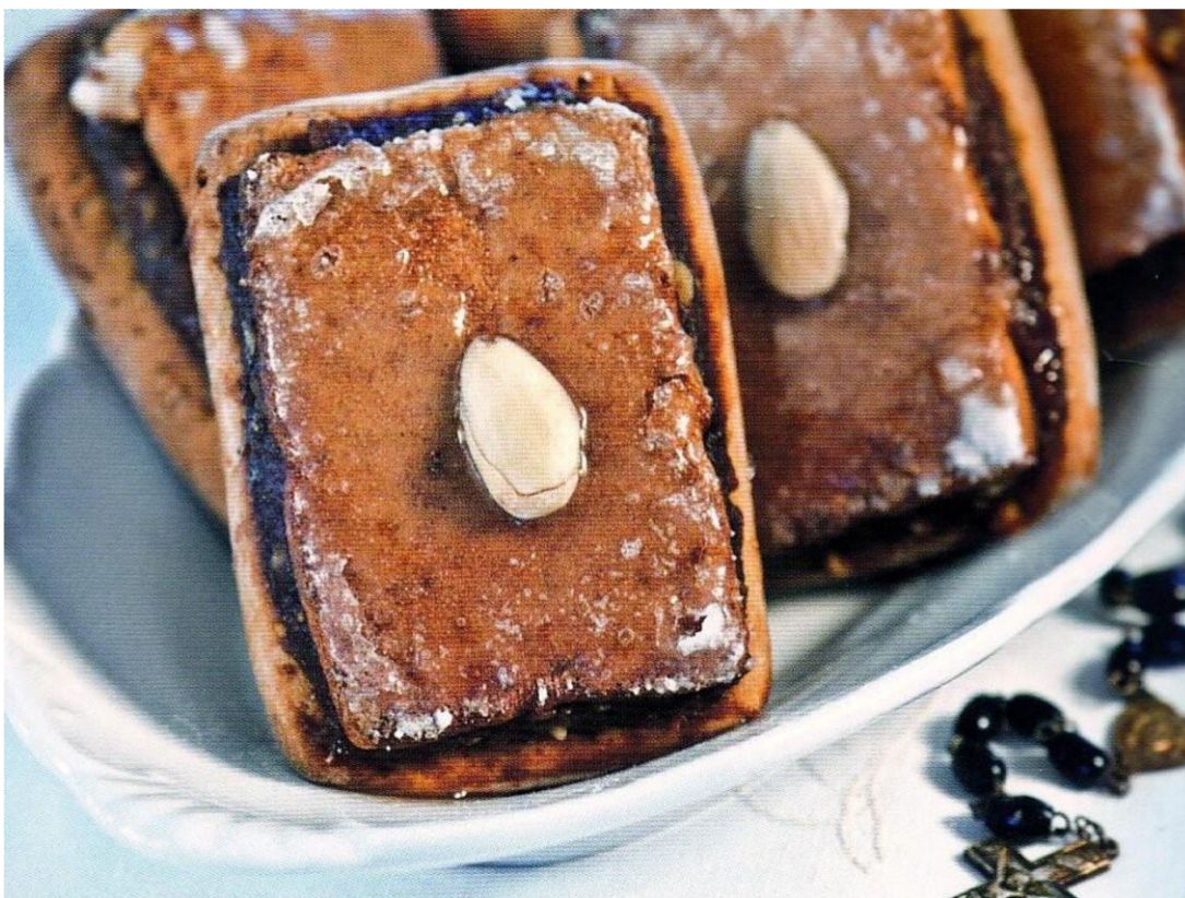
Obr. 13 Miletínské modlitbičky