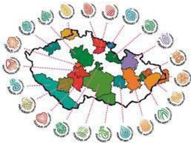
Obr. 3 Mapa regionů sdružených v ARZ