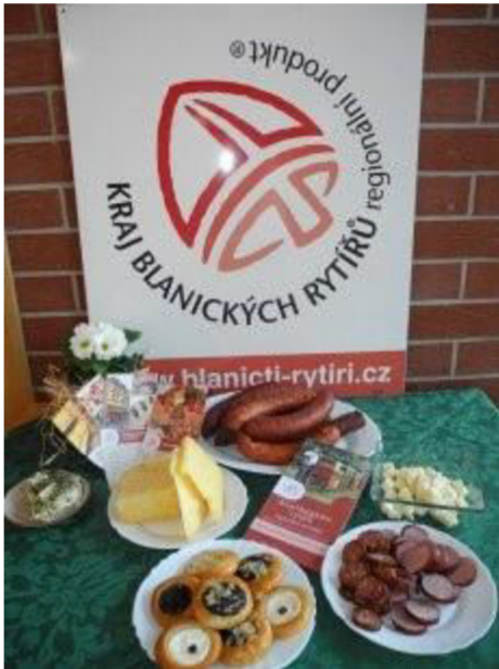
Obr. 4 Regionální produkt-Kraj blanických rytířů