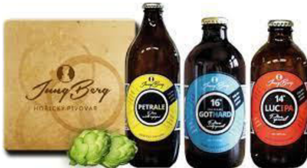
Obr. 12 Pivo z hořického pivovaru Jungberg