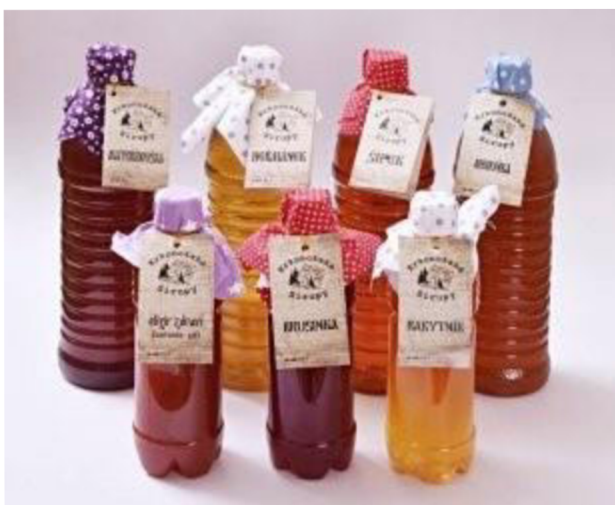
Obr. 5 Originální produkty z Krkonoš