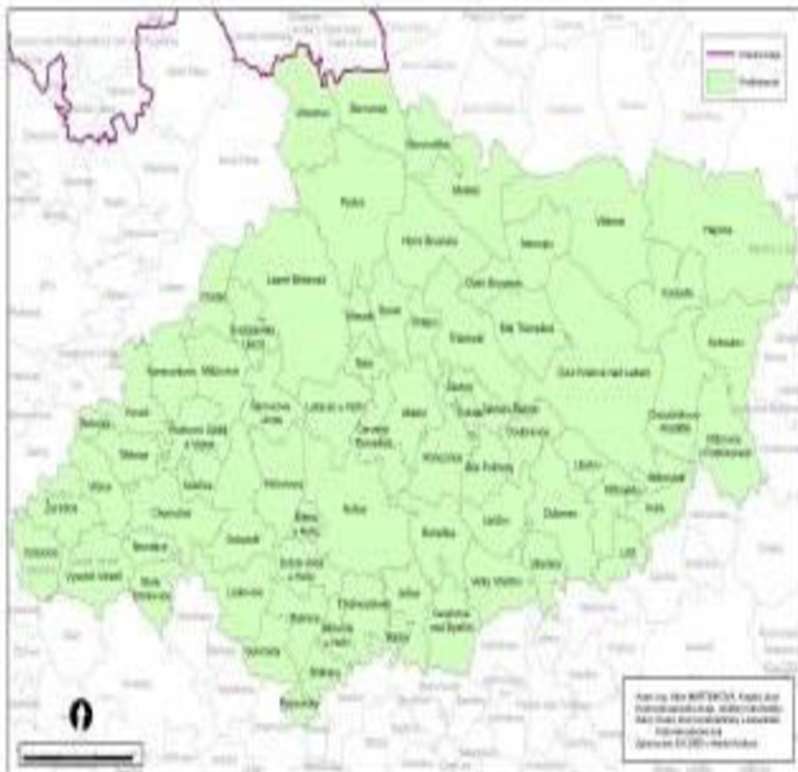
Obr. 8 Mapa regionu Podkrkonoší