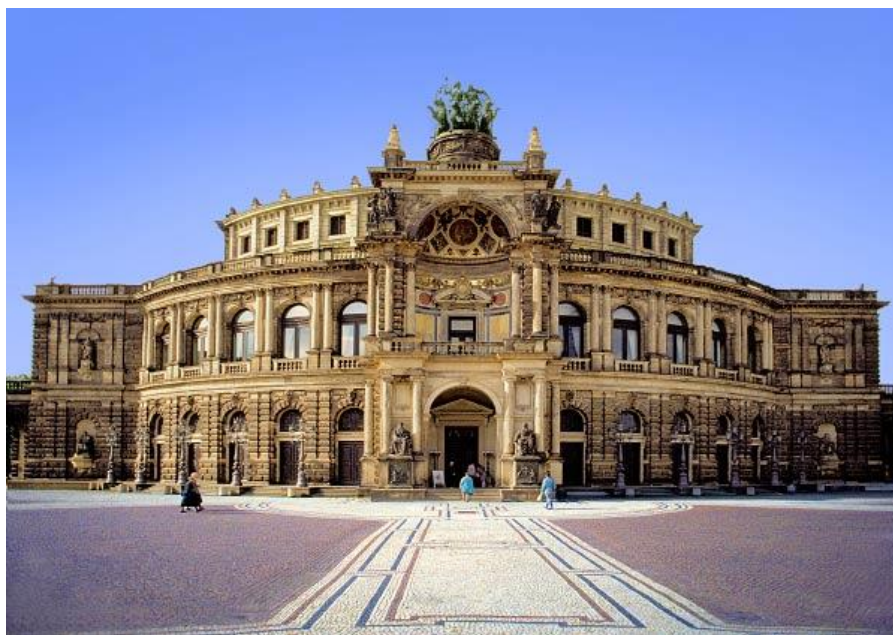
Obrázek 6 Semperova Opera, Theaterplatz, Drážďany 49

Operní scéna je nezbytnou součástí každého většího města. Drážďanská operní scéna nazvaná po architektu Semperovi, je jednou z dominant města. Opera se nachází přímo v srdci města a její budova je velkolepá. Nachází se na náměstí Theaterplatz, což v překladu z německého jazyka znamená „divadelní náměstí“.