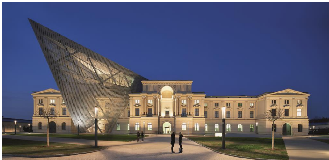
Obrázek 7 Vojenské historické muzeum armády SRN 61

Muzejní plocha o 13 000 m 2 obsahuje výstavu uniforem, zbraní a uměleckých předmětů, také rozměrné exponáty, jako kanony, vojenskou helikoptéru nebo vozidla z 800 let vojenských dějin. Návštěvníci zde můžou vidět 10 500 exponátů včetně první německé ponorky „Brandtaucher“ navržené Wilhelmem Bauerem, americké rakety s krátkým doletem „Honest John“ nebo návratový modul Sojuzu, v němž se v roce 1978 vrátil z vesmíru první německý kosmonaut Sigmund Jähr.