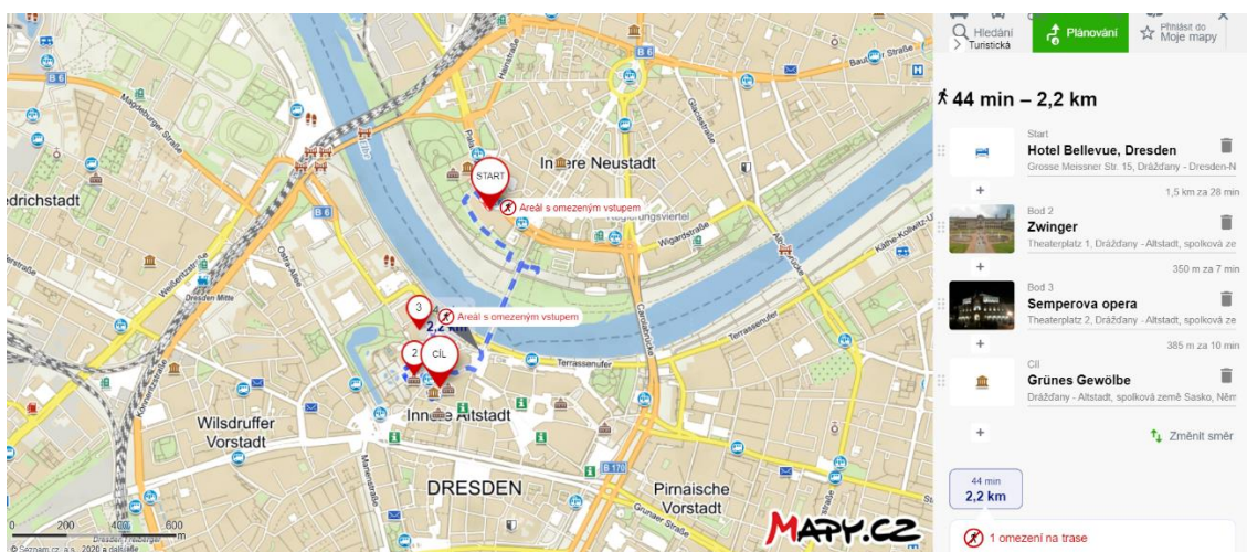
Obrázek 9 Druhý den potencionálního zájezdu, znázornění trasy 72