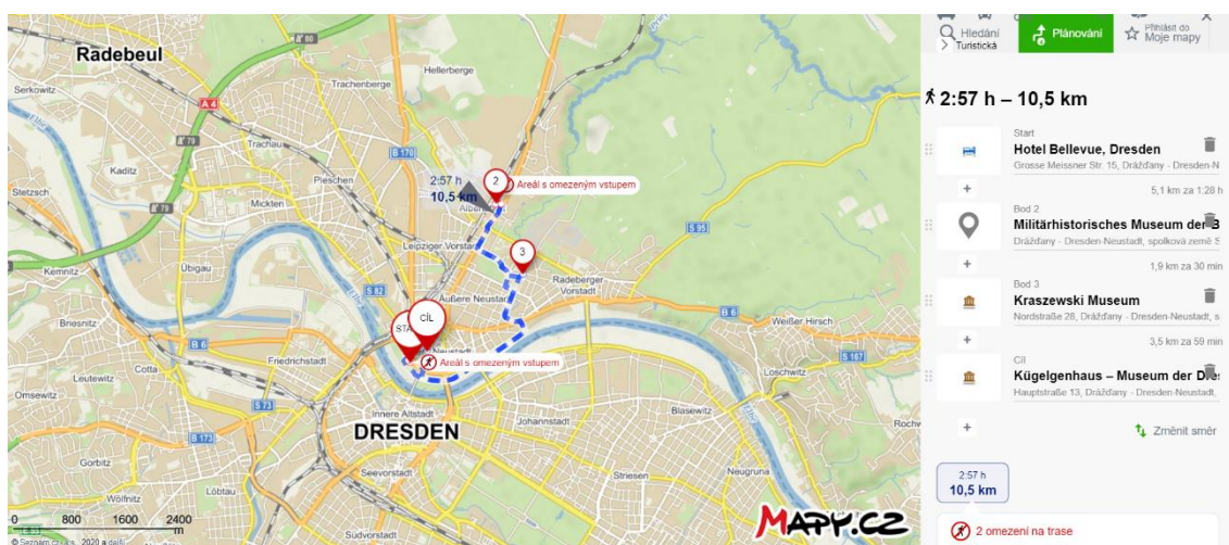
Obrázek 10 Třetí den potencionálního zájezdu, znázornění trasy 74