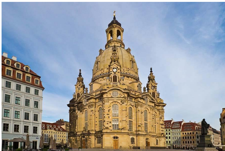
Obrázek 5 Frauenkirche v Drážďanech 34

V 11. století se na místě dnešního chrámu nacházel dřevěný kostel zasvěcený Panně Marii, nejspíš nejstarší křesťanská svatyně v regionu. Kostel sloužil jako misijní centrum pro christianizaci okolních Lužických Srbů. Ve 12. století byl nahrazen kamennou stavbou v románském slohu. Ve 14. století byl kostel znovu přestavěn a románský sloh se převtělil do gotického. Po reformaci sloužil kostel více než 20 let pouze k vypravování pohřbů. V první polovině 18. století městská rada se rozhodla k stržení starého kostela a vybudování nové větší stavby. Tímto úkolem byl pověřen jeden z největších německých mistrů baroka - George Bähr . Většina prostředků k výstavbě nového kostela byla uhrazena z darů drážďanských měšťanů. Významně přispěly také dary ze Salzburku. Pozoruhodnou zajímavostí je, že chrám byl od počátku vybudován jako luteránský kostel i přesto, že tehdejším saským kurfiřtem byl katolík již zmiňovaný Friedrich August I. Celá jeho rodina včetně něj byla protestantská, později však konvertoval ke katolicismu,