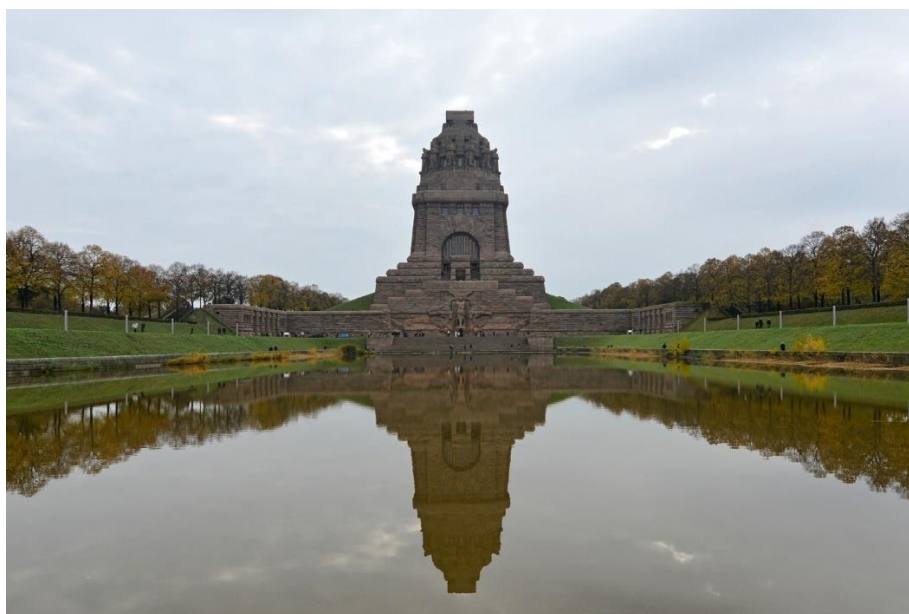
Obrázek 2 Památník Bitvy národů v Lipsku 16

symbolizují sílu, odhodlání, odvahu a víru lidí. Design památníku navrhl německý architekt Bruno Schmitz a základní kámen byl položen na konci roku 1898. Stavba památníku trvala téměř 15 let a jeho otevření bylo načasované na sté výročí bitvy národů. Součástí tohoto útvaru je také uměle vytvořené jezero, které symbolizuje krev a slzy prolité během války. 15