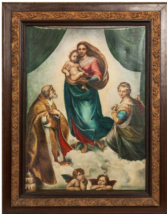
Obrázek 5 „Sixtinská madona“, Raffaello Santini, Galerie starých mistrů v Zwingeru 43