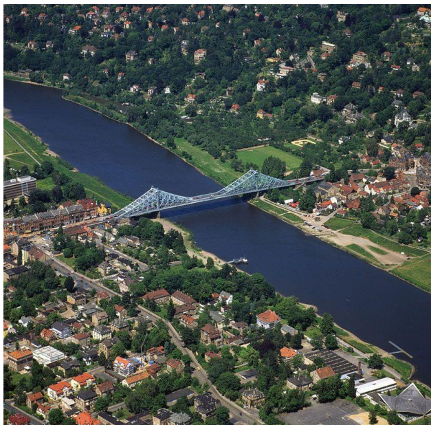
Obrázek 4 Most Loschwitz v Drážďanech 31

Most Blaues Wunder (Modrý zázrak) je nejznámější drážďanský most, který spojuje dva břehy Labe a zároveň dvě městské části – Blasewitz a Loschwitz. Původ tohoto jména spočívá v názvu pravého břehu Labe Loschwitz. 32