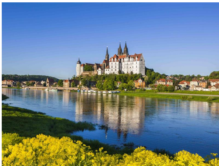
Obrázek 3 Albrechtsburg v Míšni 20

Stejně jako Drážďany a další významná saská města, tak i Míšeň sídlí na řece Labi. Město leží v rovině u řeky, historická část se soustřeďuje pod hradním vrchem, který určuje siluetu města. Albrechtsburg je považován za první hrad v Německu a „kolébku Saska“, kde vládli Wettinové. Spolu s míšeňským dómem je tento hrad symbolem města.