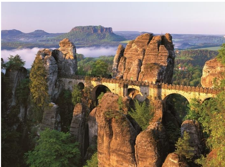
Obrázek 1 Skalní most Bastei 11

vyhlídkám a do hlubokých roklí. Pro vynikající přehled jsou cesty vždy barevně a dobře značeny. Jedním ze symbolů Saského Švýcarska je právě vyhlídka Bastei, která se nachází 194 m nad hladinou Labe. Společně s kamenným mostem, torzem (neúplné dílo) hradu Neurathen tvoří unikátní trojici. Bastei nabízí krásný pohled na údolí, na skalní město, na Basteiský most klenoucí se nad propastí Mardertelle i hrad Neurathen. Cestu k samotné vyhlídce provází řada vyhlídek na kaňon řeky Labe. 10