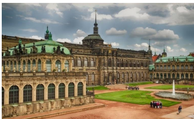
Obrázek 4 Nádvoří Zwingeru 40

Díky své veselosti a lehkosti je velmi populárním mezi návštěvníky Hradební pavilon (Wallpavillon) ozdobený sochou Herkula. Je považován za jednu z vrcholných děl evropské barokní architektury. Pavilon zvonkohry (Glockenspielpavillon) na jižní straně komplexu je jeho zrcadlovým odrazem. Dlouho se této budově říkalo jednoduše Městský pavilon. Až roku 1930 zde byla vytvořena zvonkohra, naprogramovaná na 24 různých melodií. Korunní brána (Kronentron) je symbolem hodností polského krále, jímž se později stal kurfiřt Friedrich August I. 39