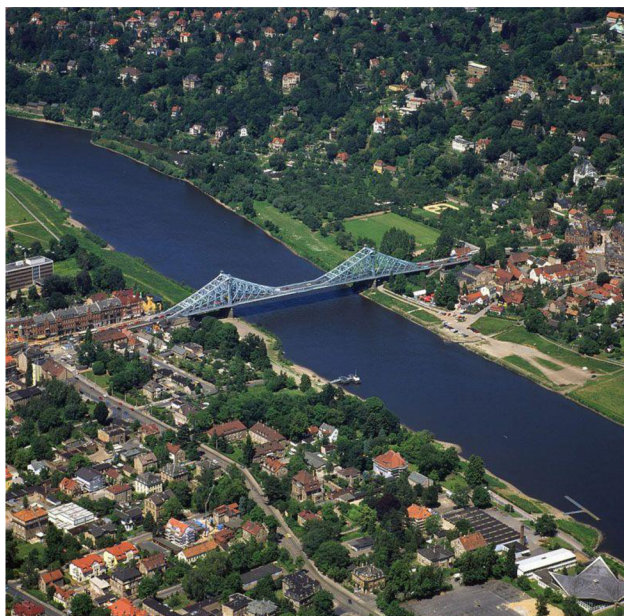
Obrázek 4 Most Loschwitz v Drážďanech 31

Most Blaues Wunder (Modrý zázrak) je nejznámější drážďanský most, který spojuje dva břehy Labe a zároveň dvě městské části – Blasewitz a Loschwitz. Původ tohoto jména spočívá v názvu pravého břehu Labe Loschwitz. 32