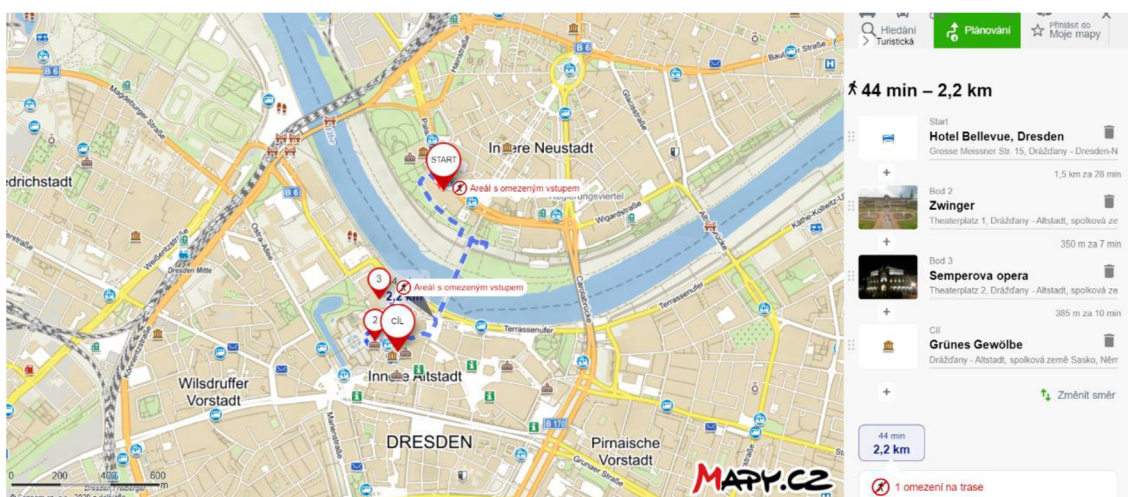
Obrázek 9 Druhý den potencionálního zájezdu, znázornění trasy 72