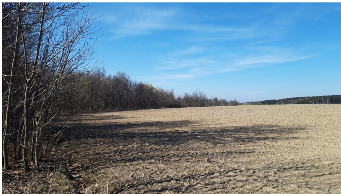
Půdní blok 8501/3