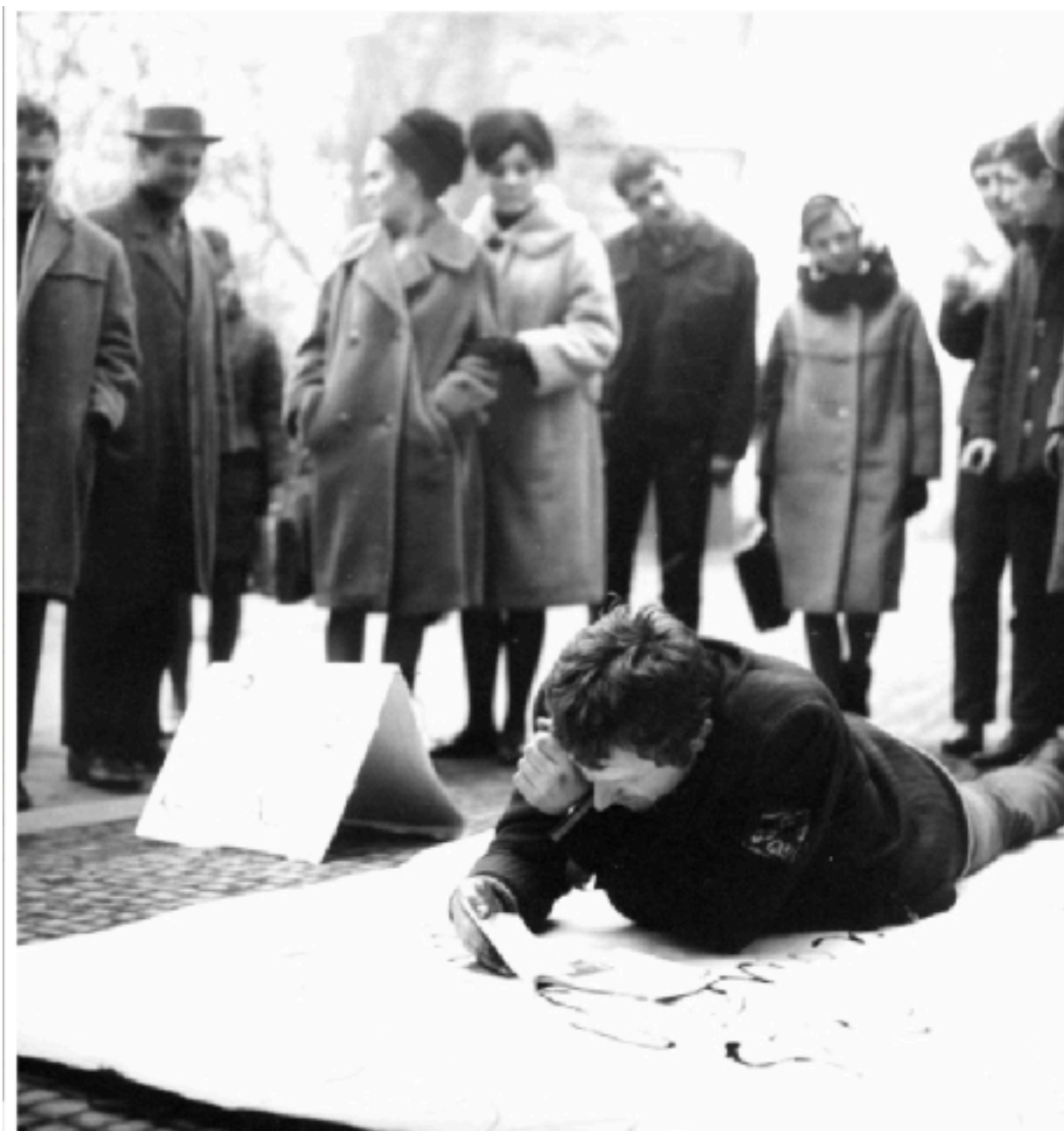
[1] Milan Knížák, Demonstrace jednoho , ulice 17. listopadu, Praha 16. prosince 1964