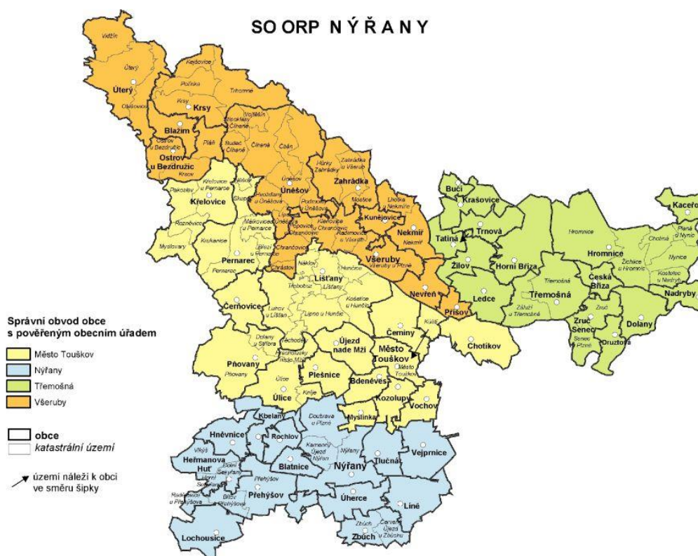
Obrázek č. 1 Obce správního obvodu ORP Nýřany