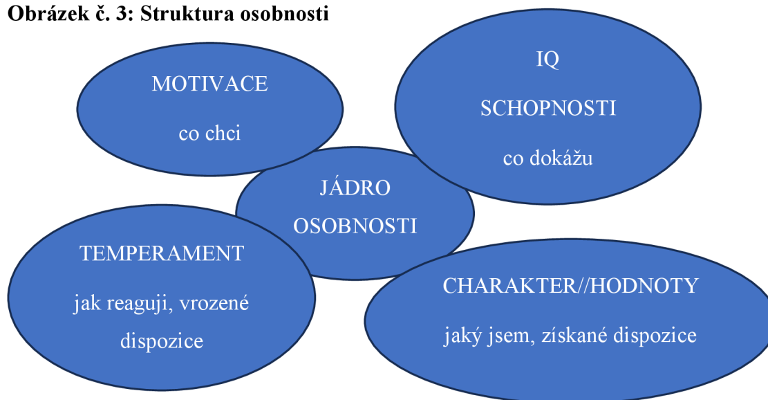
Obrázek č. 3: Struktura osobnosti

Zdroj: Autorka podle Rymešové, Chamoutové (2020, s. 57); Říčana (2006, s. 208)