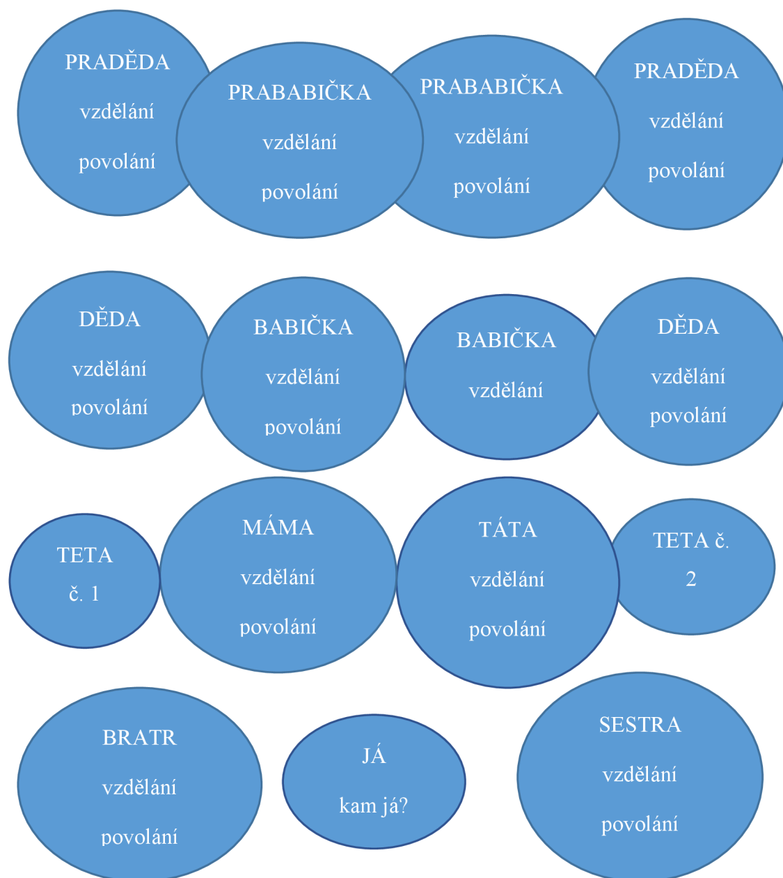
Obrázek č. 3: Anamnéza povolání v rodině