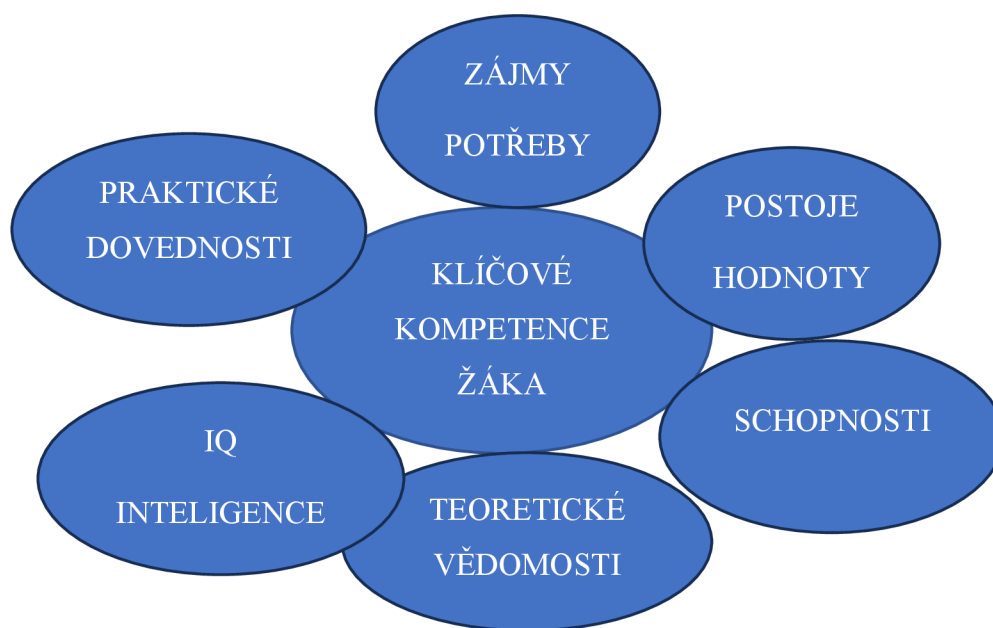
Obrázek č. 2: Klíčové kompetence žáka

Zdroj: Autorka podle Csirke, Šnepfenbergové (2020, s. 21)