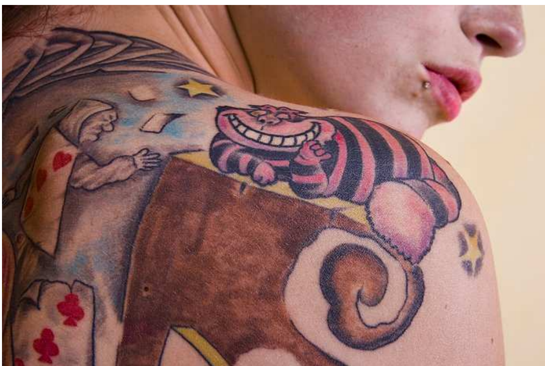
Ukázka tetování respondenta 3 – příloha č. 3