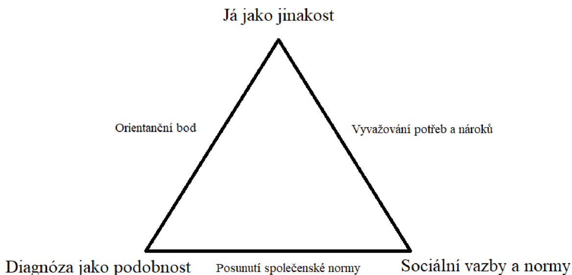
Schéma 3: Vizualizace výsledné teorie a jejích kategorií

Vědomí jinakosti však nezpůsobuje pouze neporozumění sobě samému. Současně se jedná o prostředek sebeidentifikace a ukotvení ve světě skrze vymezení se vůči němu. Jinakost pak není primárně vnímána jako něco negativního, ale něco sobě vlastního a v některých ohledech jako něco přínosného. Jinakost znamená kreativitu, bohatost myšlení a fantazii, speciálnost a osobitost. Z analýzy rozhovorů vyplynulo, že bez této specifčnosti by respondenti vlastně nebyli , že bez jinakosti, která se rovná identitě , se ztratí či razantně přehodnotí samotná existence člověka: „[Kdybych tuhle poruchu neměla] znamenalo by to to, že bych si dodělala školu, měla bych i vysokou školu. Určitě několik. Třeba se věnovala nějakému umění nebo nějaký kouč. A teď vlastně nevím, jestli bych chtěla žít ten život. “ (Resp. č. 1)