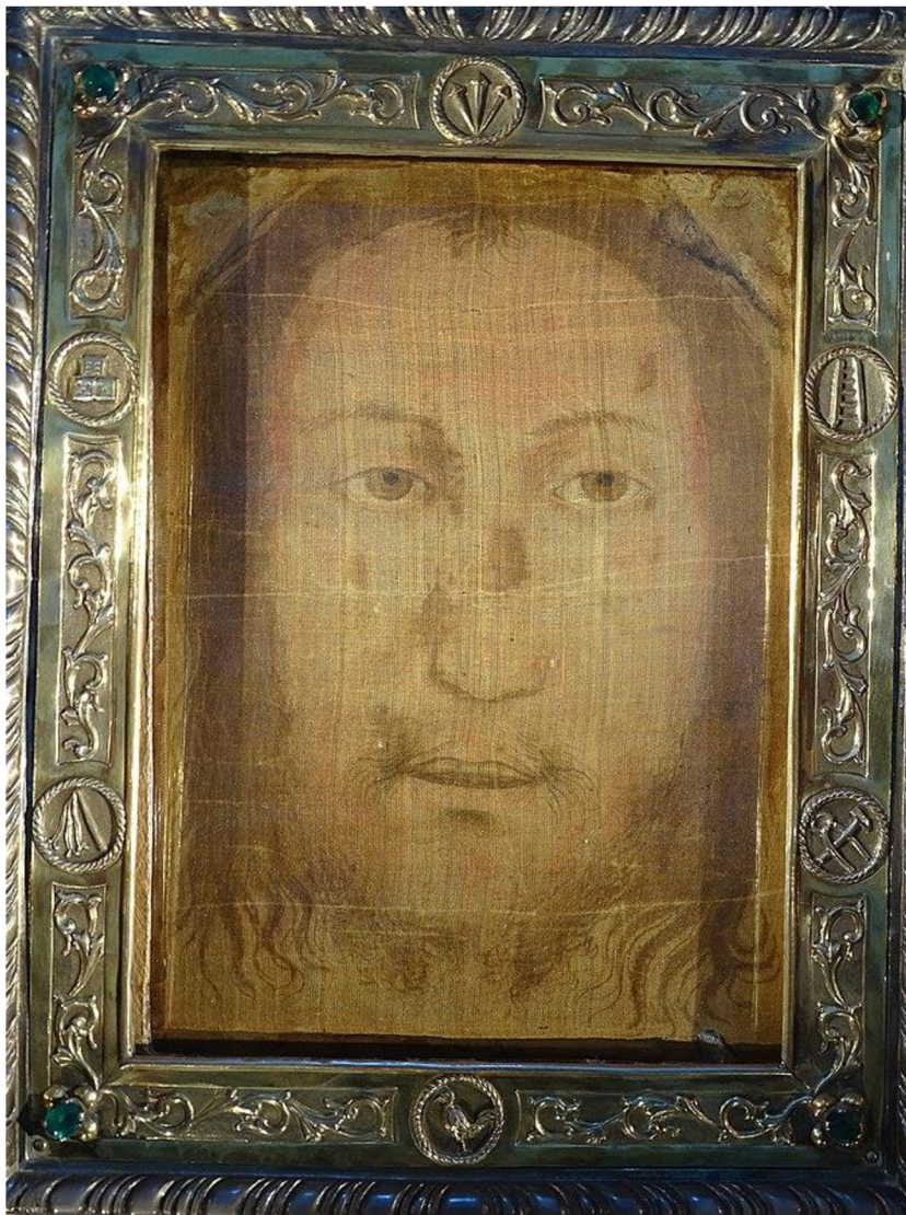
Příloha A – Rouška z Manoppella