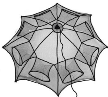
Obr. 2 - Vizualizace rybářské vrše tvaru deštník

Jak zdůrazňuje Gamble (2003), použití této pasti v terestrických podmínkách bylo úspěšnější než padací pasti. Zvláště užitečným byl tento typ pasti pro zaznamenání celkové herpetofauny na lokalitě. Na trhu rybářských vrší existuje několik variací, kde vrš může mít tvar kvádrů nebo deštníků (viz Obr. 2) a také může mít jenom jeden obrácený trychtýř nebo více. Je velký výběr materiálů, které se využívají pro výrobu pastí. Je zapotřebí upozornit, že ne všechny tvary vrší budou vhodné pro použití v suchozemském prostředí (tvar deštníku je určen pro vodní stanoviště).