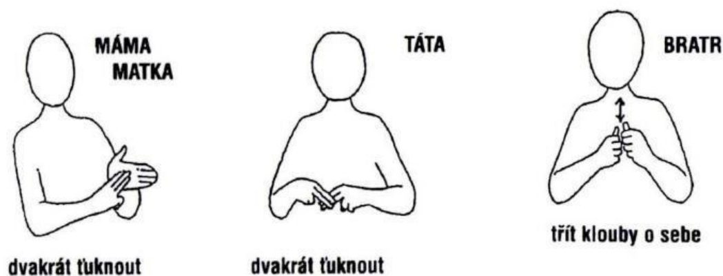
Obr. 4 Makaton (zdroj: Valenta, 2009)

do osmi stupňů, konkrétně od základních a běžně využívaných pojmů k pojmům obecným. Stupně jsou čím dál náročnější. Existuje také devátý stupeň slovníků, který slouží jako návrh seznamu slov podle individuálních potřeb jedince. Slovník je mezinárodní a při využívání metody Makaton je nezbytné tento systém respektovat (Maštalíř a Pastieriková, 2018; Valenta, 2009). Ukázka je znázorněna na Obrázku 4.