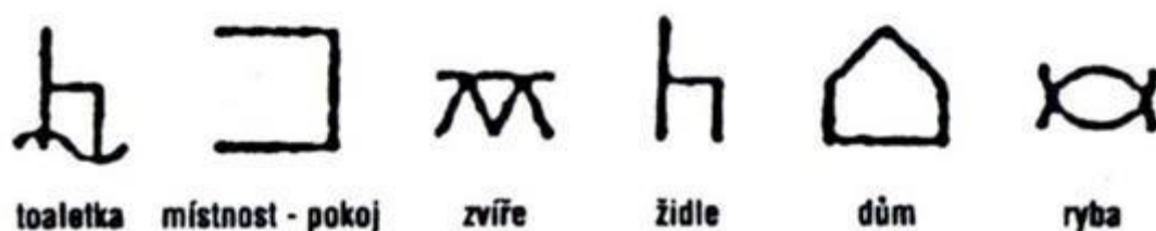
Obr. 3 Bliss systém

Běžná komunikace probíhá ukazováním, například prstem, na jednotlivé grafické symboly. Systém Bliss (viz. Obrázek 3) je jedním ze systému alternativní a augmentativní komunikace, který umožňuje zachovat gramatická pravidla a snadné zapamatování umožňuje rovněž také logiku symbolu (Šarounová, 2014).