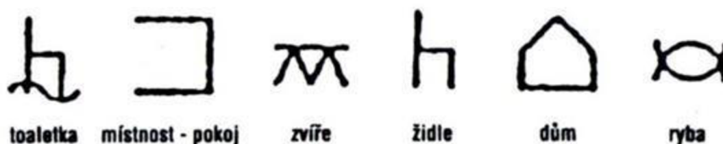
Obr. 3 Bliss systém

Běžná komunikace probíhá ukazováním, například prstem, na jednotlivé grafické symboly. Systém Bliss (viz. Obrázek 3) je jedním ze systému alternativní a augmentativní komunikace, který umožňuje zachovat gramatická pravidla a snadné zapamatování umožňuje rovněž také logiku symbolu (Šarounová, 2014).