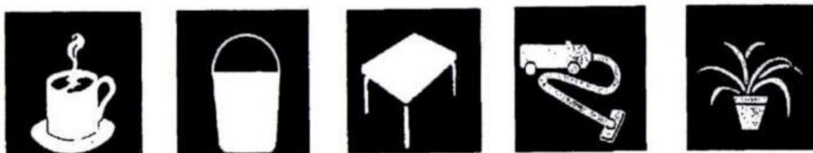
Obr. 2 Piktogramy (zdroj: Valenta, 2009)

Herzánová et al. (2021) definuje piktogramy jako obrázkové komunikační symboly, s kterými se v běžném životě často setkáváme, a to ve formě informačních tabulí či značek. Klenková (2006) uvádí, že se jedná o zjednodušená zobrazení skutečnosti, jako jsou například předměty, činnosti nebo vlastnosti. Piktogramy bývají srozumitelné všem a jednoduchým řazením se z nich dají skládat věty, denní nebo i týdenní plány, jak je ukázáno na Obrázku 2. Neverbální komunikace pomocí piktogramů je určitou formou předávání instrukcí, příkazů, varování, usnadnění orientace v nejrůznějších prostředích bez vazby na řeč (Šarounová, 2014).