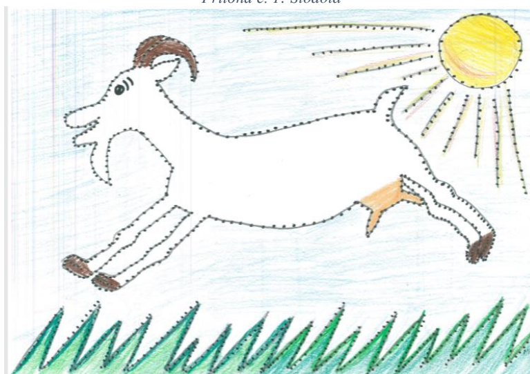
Příloha č. 2: Vyplněný pracovní list koza