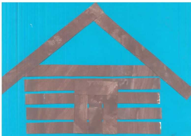
Příloha č. 1: Stodola