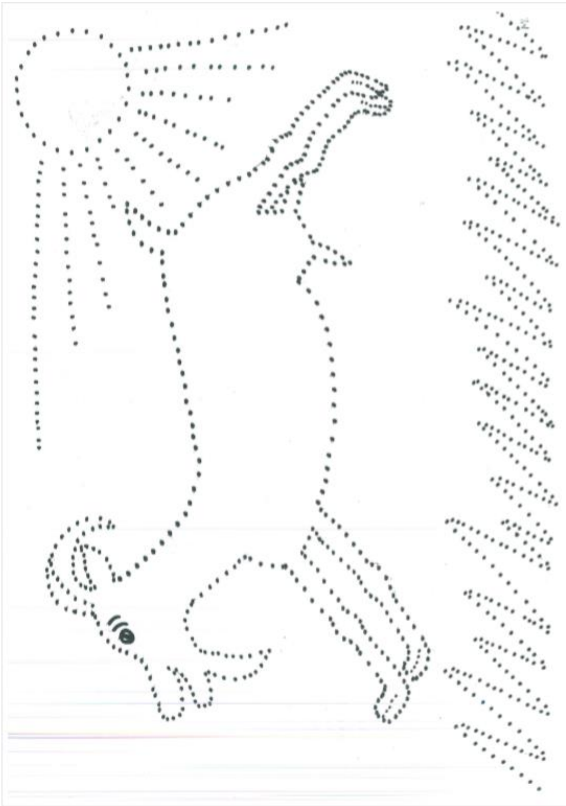
Příloha č. 4: Pracovní list koza