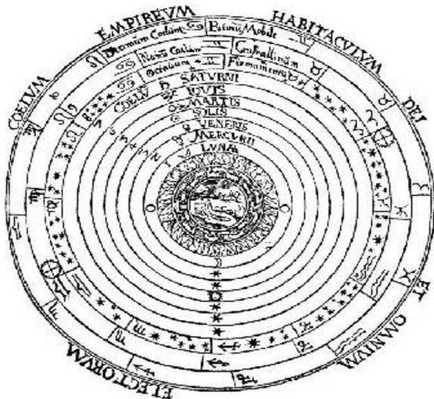
*Obr. č. 2 - Aristotelský sférický model

Zdroj: P. Apianus, Cosmographicus liber , 1524.