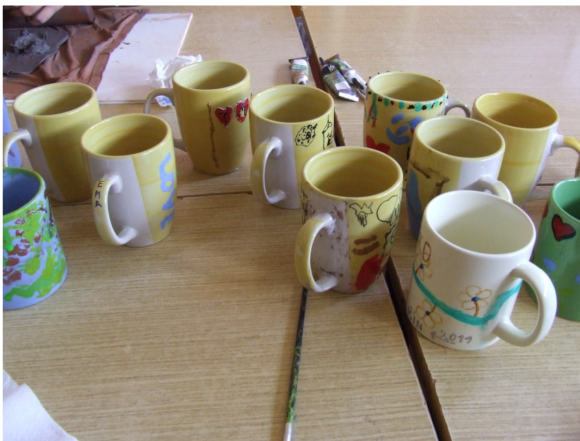
Obrázok 15.: Maľovanie hrnčekov

Pomôcky: Šálky, štetce, farby na porcelán, linky na porcelán, rúra.