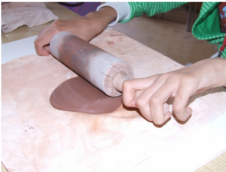
Obrázok 16.: Práca s hlinou

Pomôcky: Podložka, valček ,Ihla alebo špendlík, šablóna okna, ceruzka, šliker, zvyšky látok, nožnice.