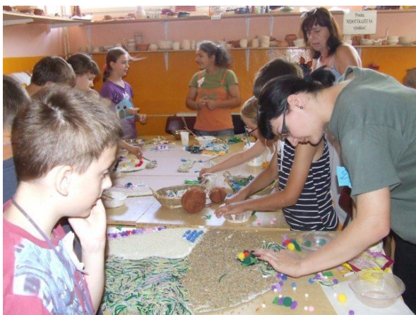
Obrázok 22.: Letný prázdninový tvorivý workshop v KCA

Deti, ktoré v priebehu školského roka boli zapojené v KCA do stimulačného programu „Aj my máme šikovné prstečky“ sa v priebehu letných prázdnin z vlastnej vôle zúčastnili minimálne jedného tvorivého workshopu spolu so zdravými deťmi, ktoré nepoznali.