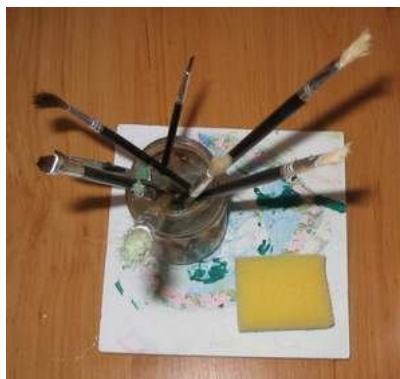
štetce, paleta, hubka na riad