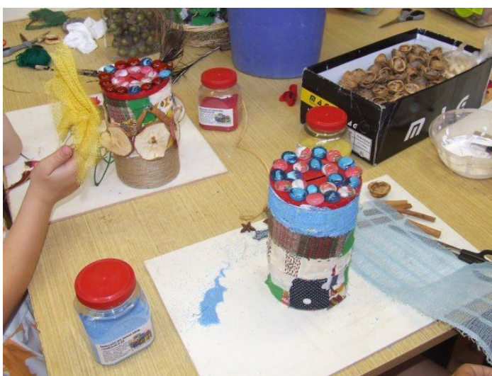
Obrázok 19.: Výroba pokladničky

Pomôcky: Plechovky od CARA, orezávač, nožnice, lepiaca pištoľ, vlna, dekoračné predmety a sušené ovocie.