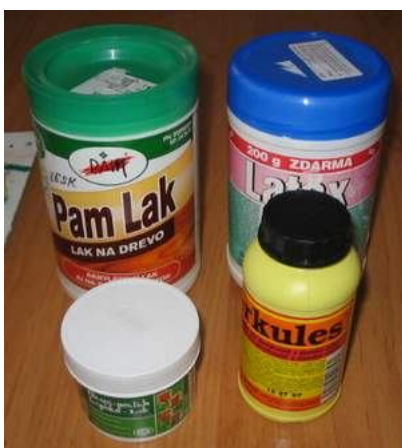
bielu akrylovú farbu (môžeme použiť aj biely latex), PamLak,