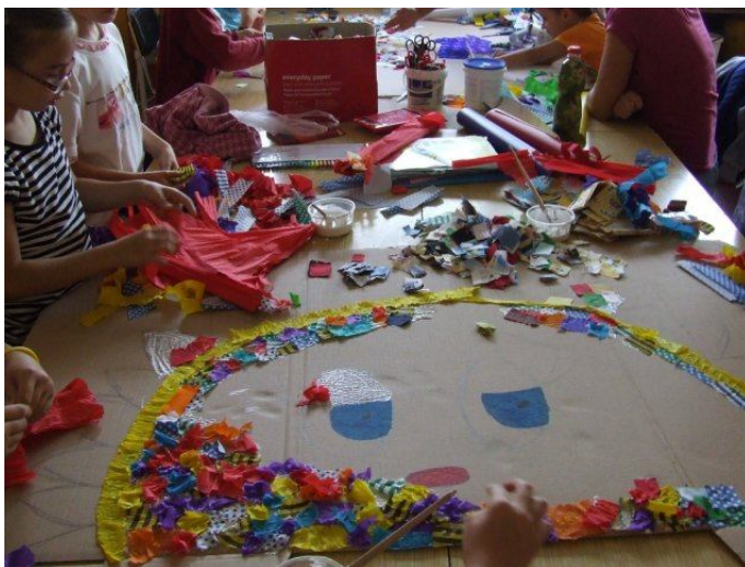
Obrázok 11.: Výroba koláže - Slnko

Pomôcky: Kartón, orezávač, ceruzka, fixy, lepidlo, látky, farebný papier, krepový papier.