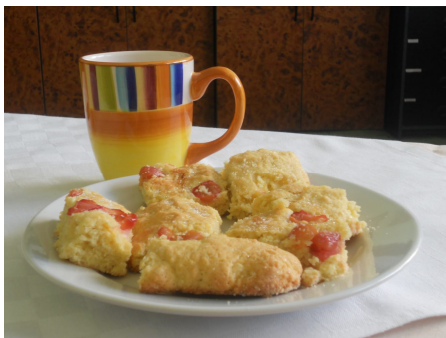
Obrázok 21.: Rozlúčka - občerstvenie

Každé z detí, vrátane sprievodcu, bol vedúcou krúžku pohostený ňou vlastnoručne upečeným koláčom. Atmosféra bola uvoľnená, plná radostného očakávania, čo prinesú veľké letné prázdniny a zároveň sprevádzaná i trochou smútku u tých, ktorí sa nemôžu zúčastniť letných tvorivých workshopov, ktoré povedie ich vedúca krúžku. Väčšina detí, ale bola na niektorý prázdninový deň nahlásená (vid'. rozpis PRÍLOHA C ). Vôbec nemali strach, že tam budú spoločne s cudzími deťmi, ktorých nepoznajú a ktoré nemajú žiadny zdravotný problém.