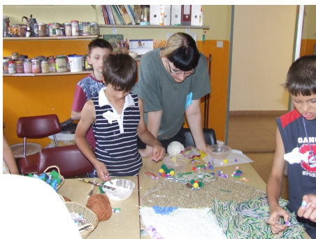
Obrázok 17,18.: Výroba koláže – ryba, motýľ

Pomôcky: Kartón, orezávač, ceruzka, lepidlo, šošovica, ryža, lak, látky, bavlnky a vlna.