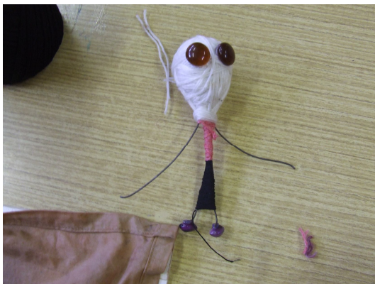
Obrázok 10.: Výroba panáčika Kofoláčika - Lukáš

Pomôcky: Noviny, špagát alebo rôznofarebná vlna, drôty, kombinačky, koráliky, tavná pištoľ, nožnice.