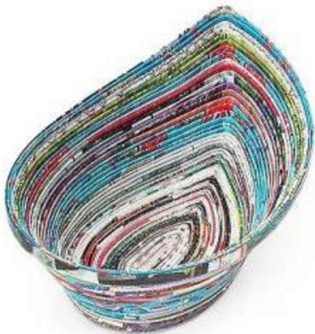
Obr. č. 33. Koš ze starých novin