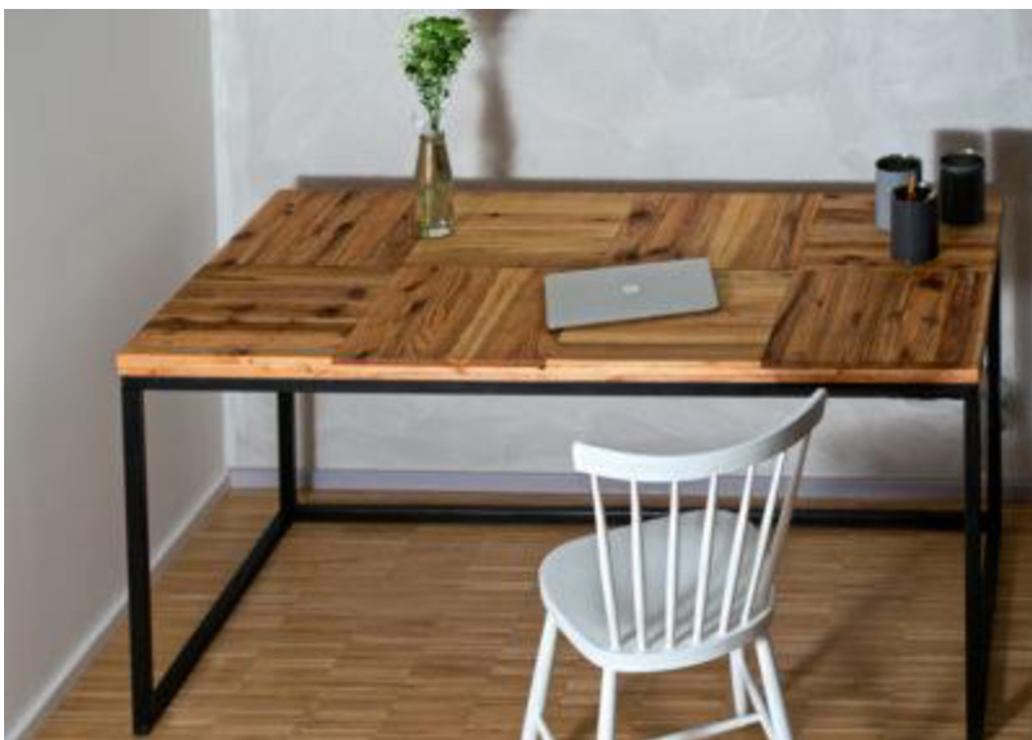
Obr. č. 7. Paletky: stůl KYOKU