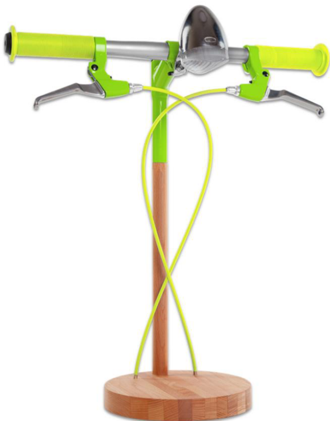
Obr. č. 16. INDUSTRIAL KID: lampička z jízdního kola