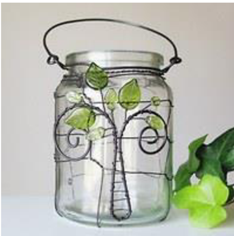
Obr. č. 38. Odrátovaná sklenice