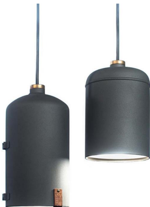
Obr. č. 11. NAHAKU: Lustr