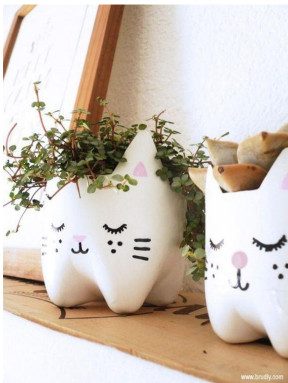
Obr. 39. Květináč z PET lahví