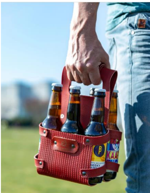
Obr. č. 14. EVERSOM: Obal na pivo z požárních hadic

Zdroj: https://shop.eversom.nl/products/om-packer