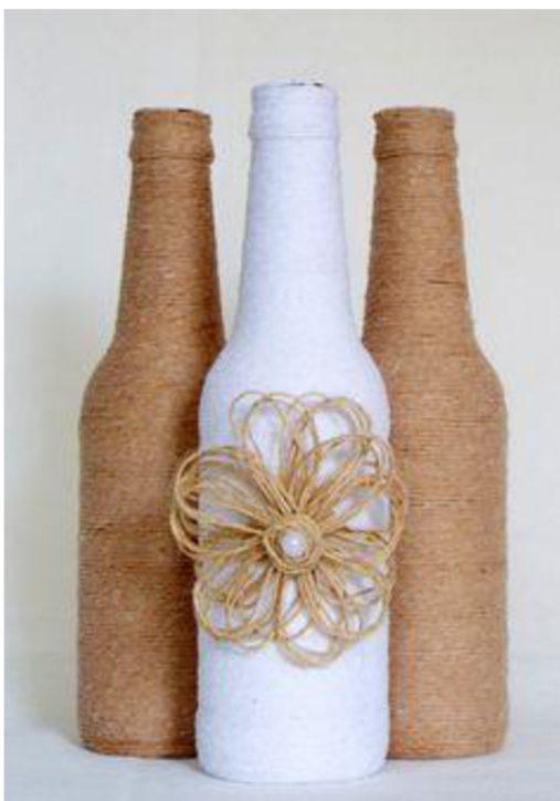
Obr. č. 26. Vázy z flašky od alkoholu