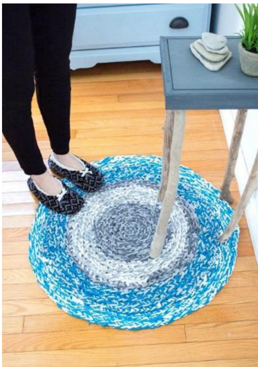
Obr. č. 24. Koberček z triček