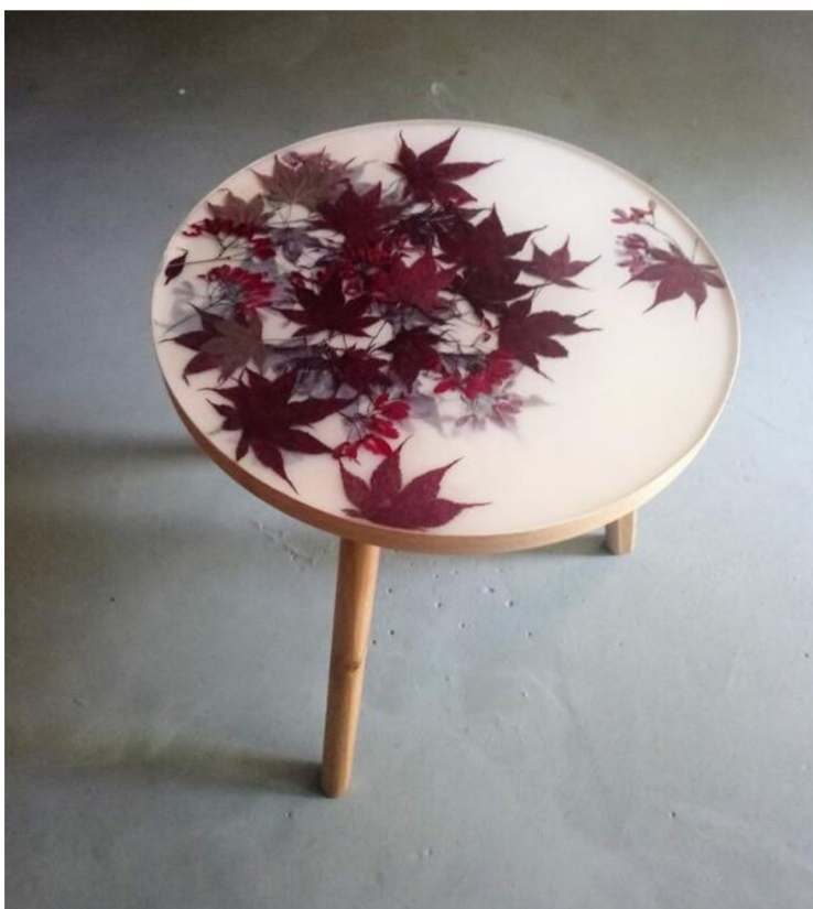
Obr. č. 8. Chimery: upcyklovaný konferenční stůl