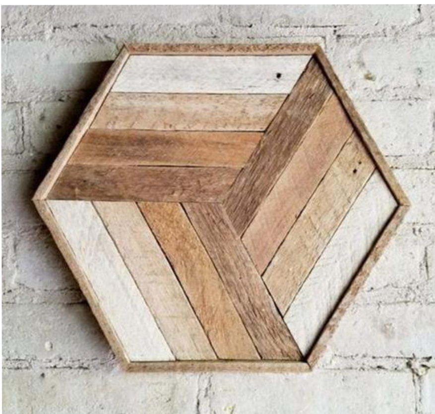
Obr. č. 30. Dekorace ze dřeva