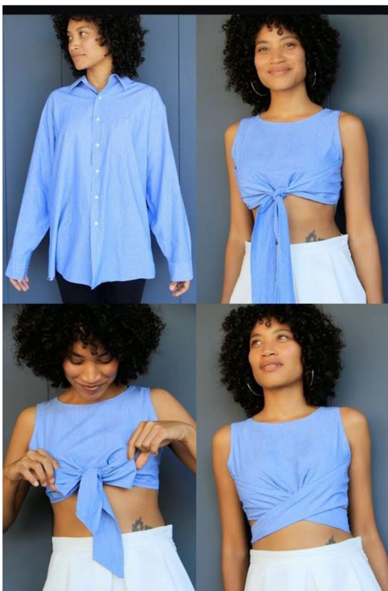
Obr. č. 21. Top z pánské košile