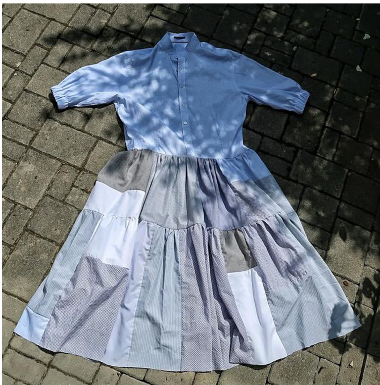
Obr. č. 3. LuciinaNebesicka: Šaty z osmi košil