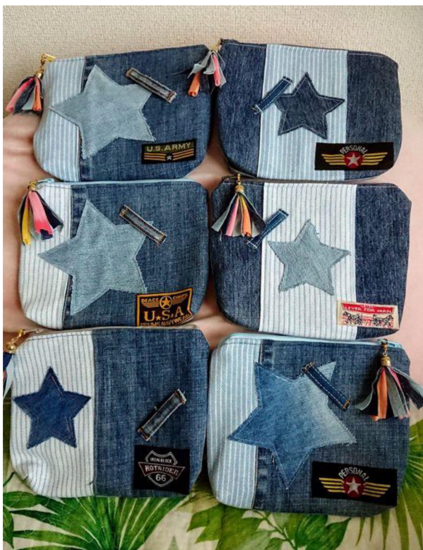
Obr. č. 19. Peněženka z jeansů