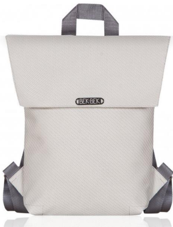
Obr. č. 13. BEKBEK: Batoh Snow ze stínících rolet