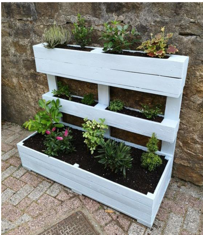
Obr. č. 28. Stojan na květiny z palety