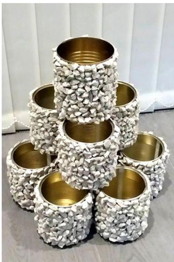
Obr. č. 18. Květináč nebo stojan na tužky z plechovky