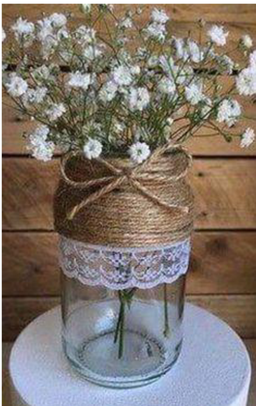
Obr. č. 25. Váza ze sklenice