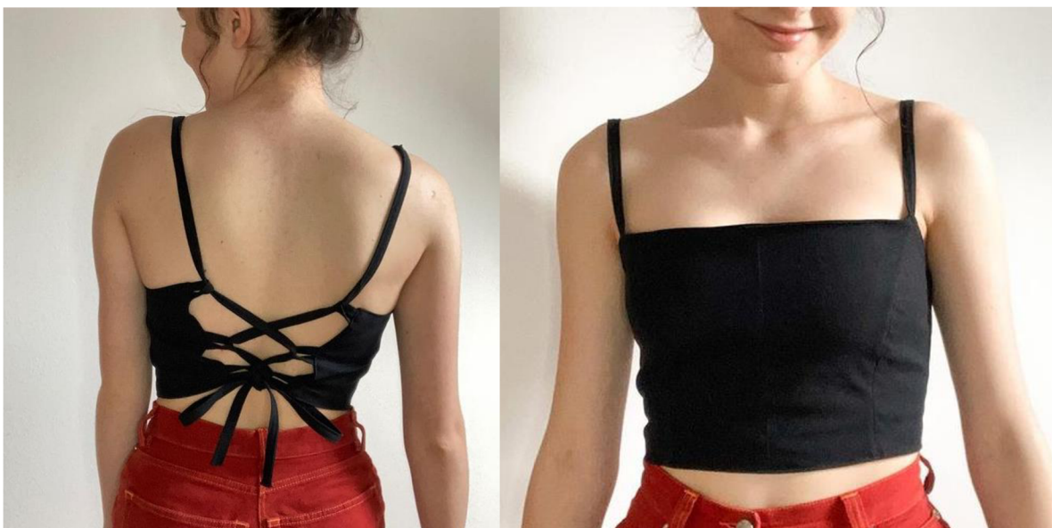
Obr. č. 6. Vedu_clothing: Top se šněrováním ze starých kalhot