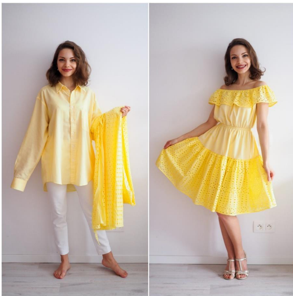
Obr. č.1. LaFlorita: upcyklace košile a zbytkové metráže