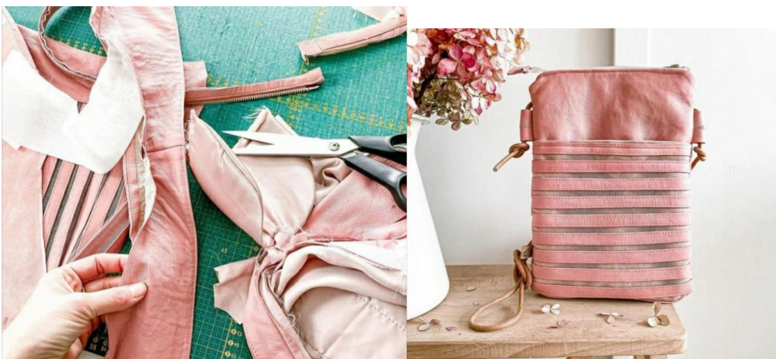
Obr. č. 2. BylaJsemSukně: crossbody z bundy