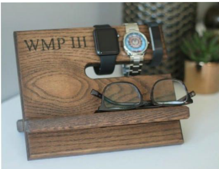
Obr. č. 29. Stojan na mobil aj. z dřeva