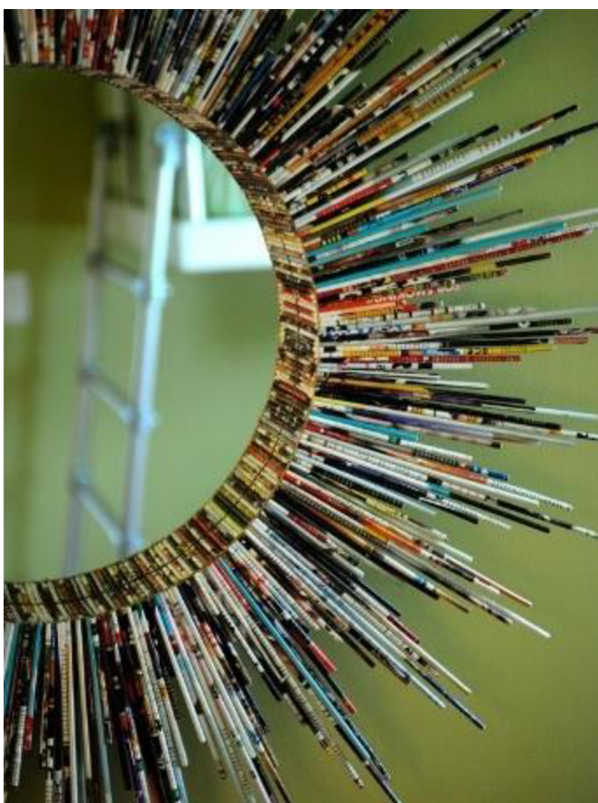
Obr. č. 34. Dekorace ze starého papíru