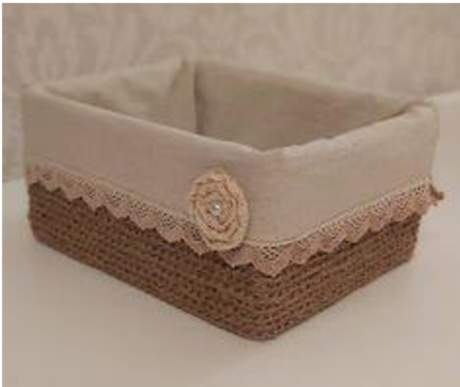
Obr. č. 32. Koš z krabice od bot