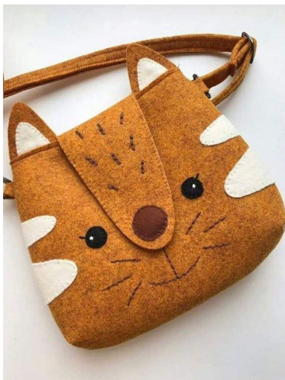
Obr. č. 35. Taška ze zbytků kůže