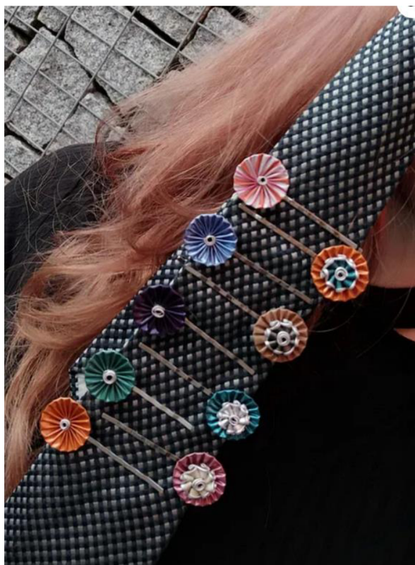
Obr. č. 12. Zuzi.smi: Spona do kravaty