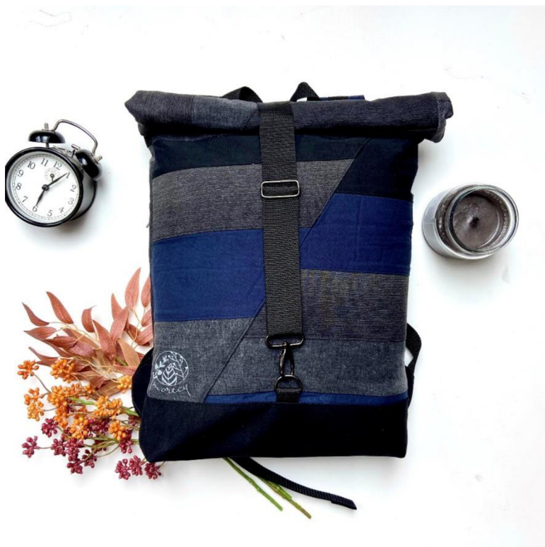
Obr. č. 4. MORECY: Batoh pan Tmavý z Kalhotova