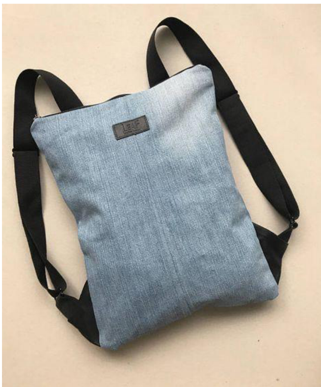
Obr. č. 20. Batoh z jeansů