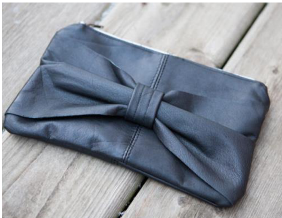
Obr. č. 36. Peněženka ze zbytků kůže