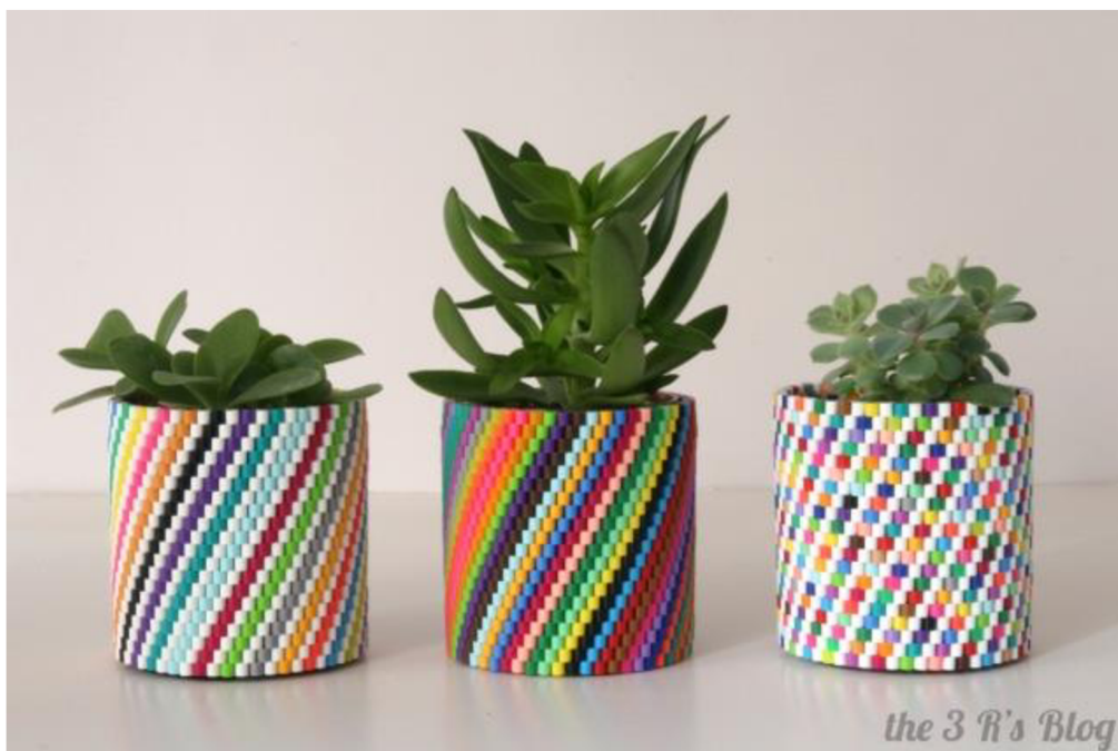
Obr. č. 17. Květináč z plechovek