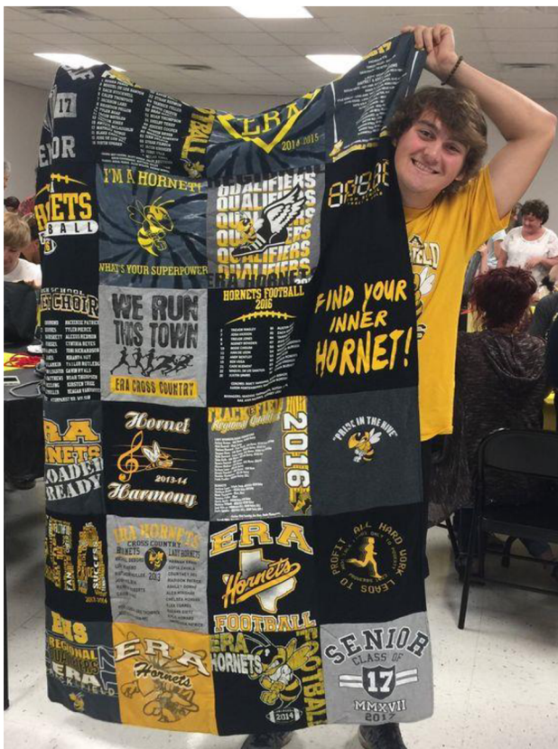
Obr. č. 23. Deka z triček