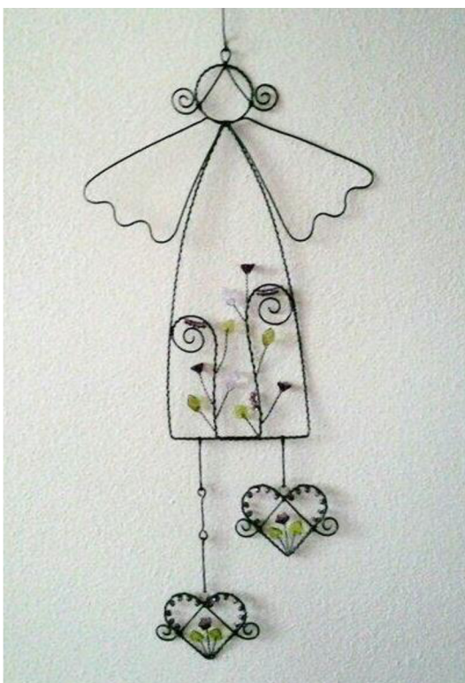
Obr. č. 37. Dekorace z drátů