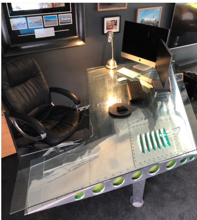
Obr. č. 15. AViART Australia: pracovní stůl z křídla letadla