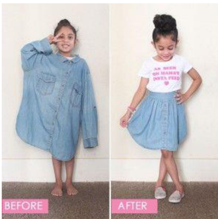
Obr. č. 22. Sukně z pánské košile