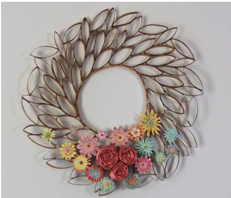
Obr. č. 31. Dekorace z ruliček od toaletního papíru