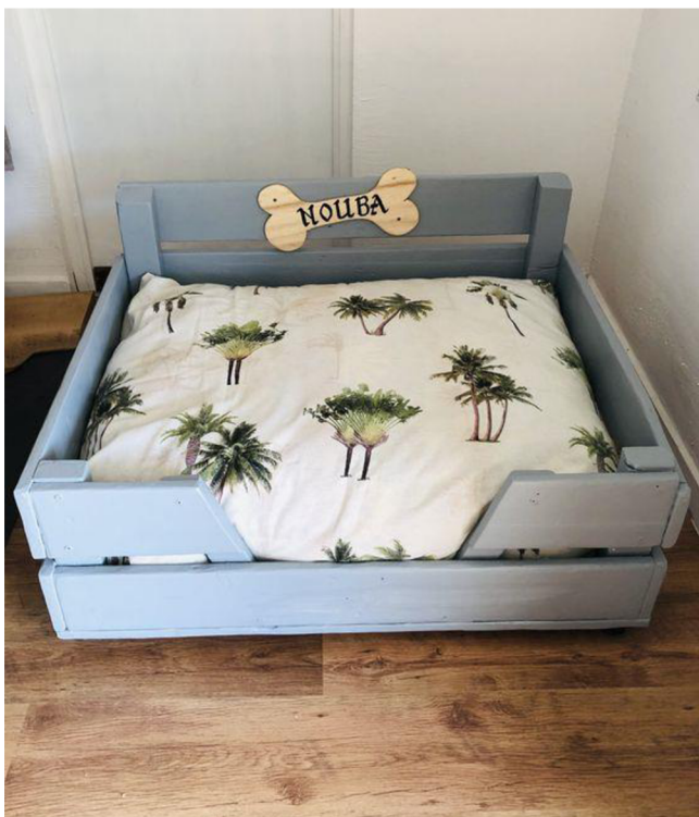
Obr. č. 27. Pelíšek pro psa z palety