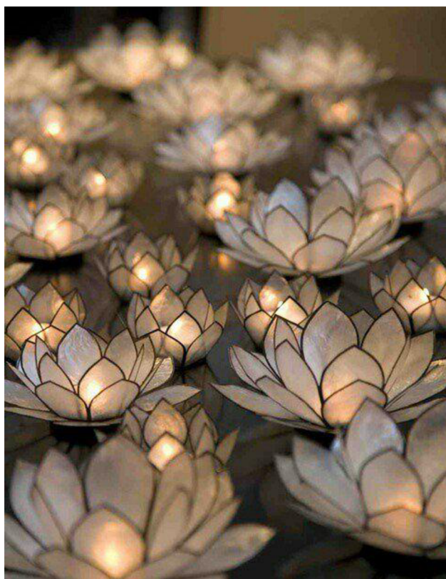
Obr. č. 40. Svícen z PET lahví