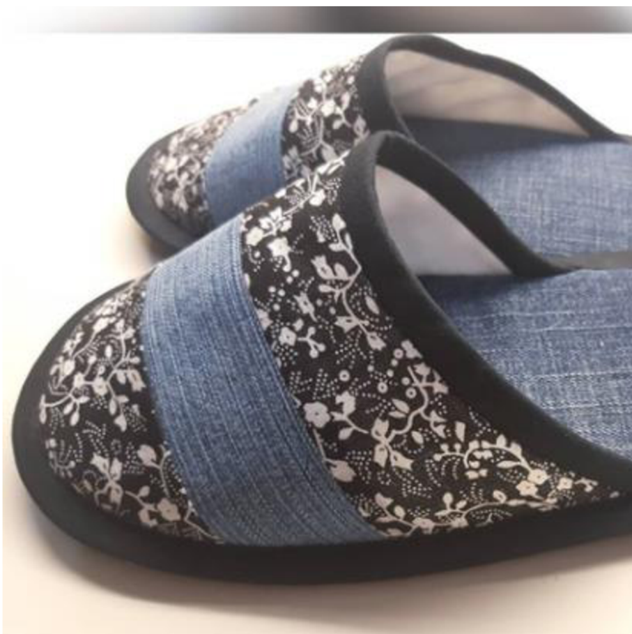
Obr. č. 5. Zhefnuto: pantofle