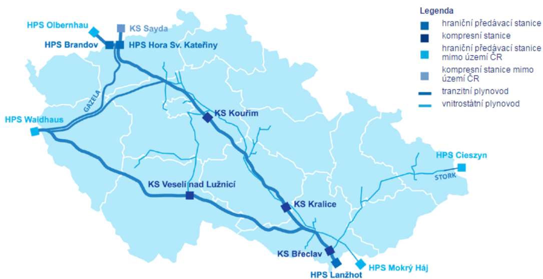
Obrázek č. 3: Plynárenská soustava ČR