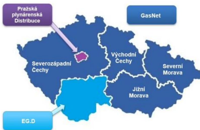
Obrázek č. 2: Provozovatelé distribučních soustav a rozdělení zóny do regionů