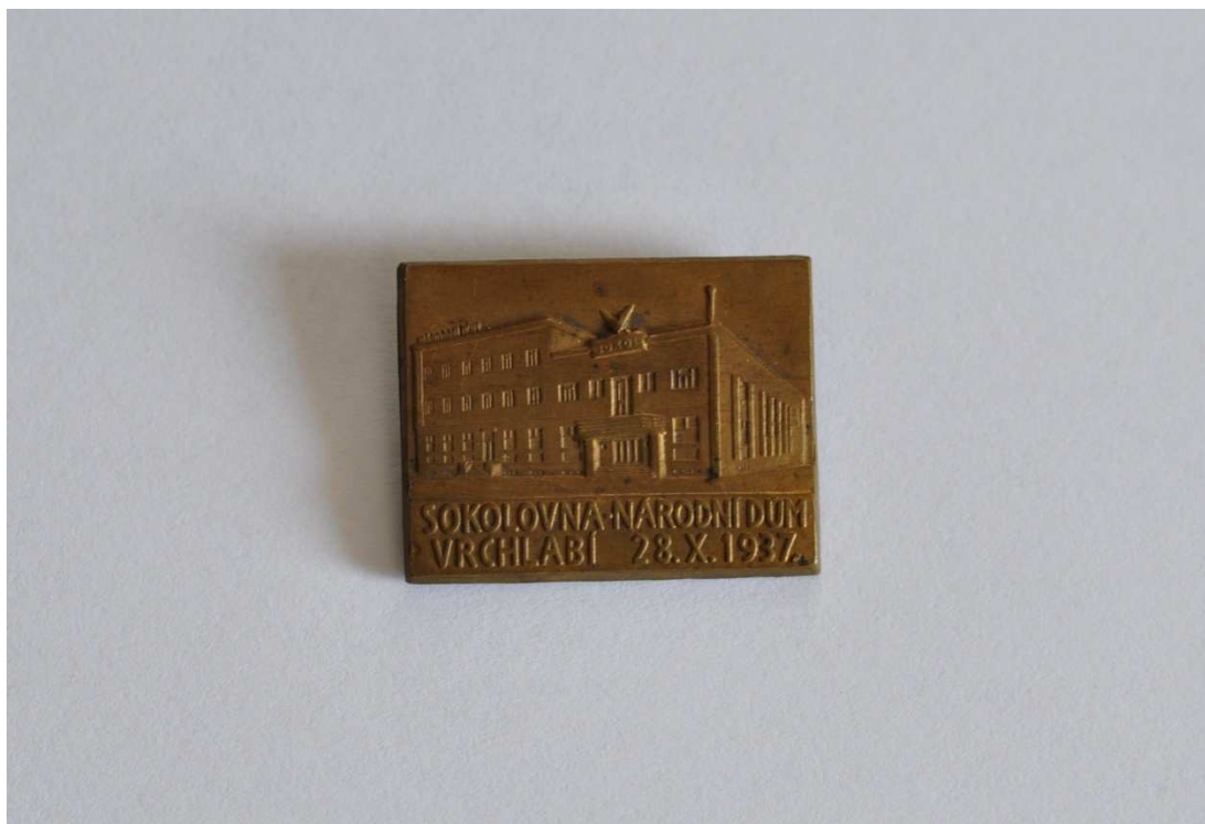
Příloha č. 13: Odznak vydaný při příležitosti otevření vrchlabské sokolovny a Národního domu.