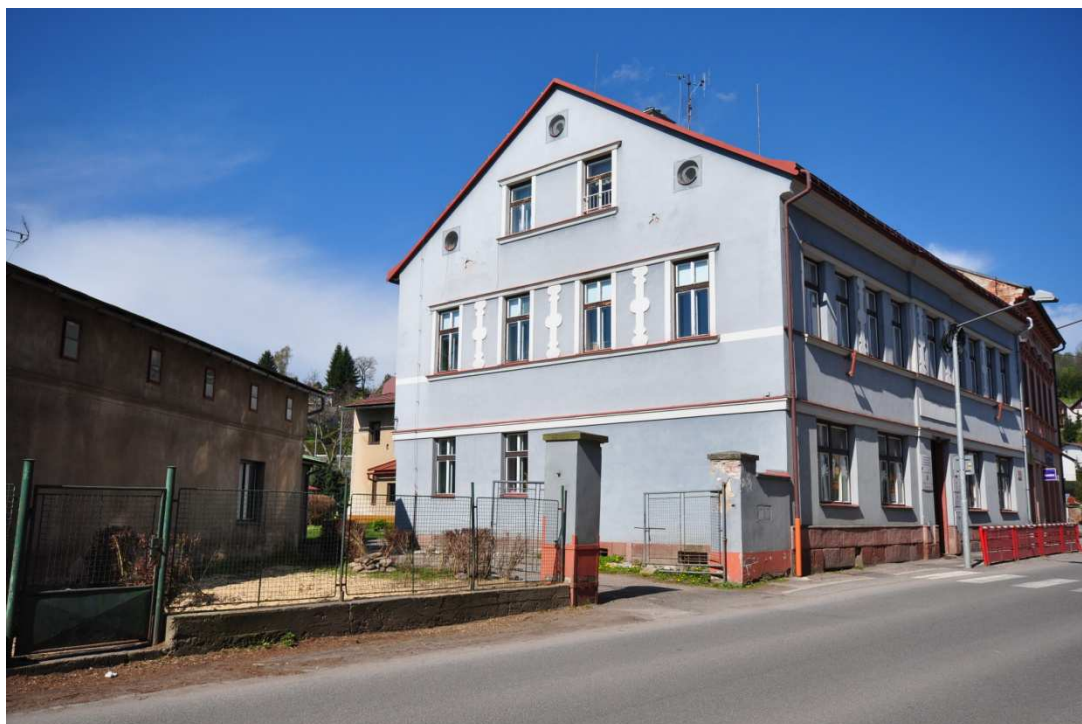
Příloha č. 5: Dům vrchlabského odboru Národní jednoty severočeské, v letech 1913–1919 sídlo české menšinové školy.