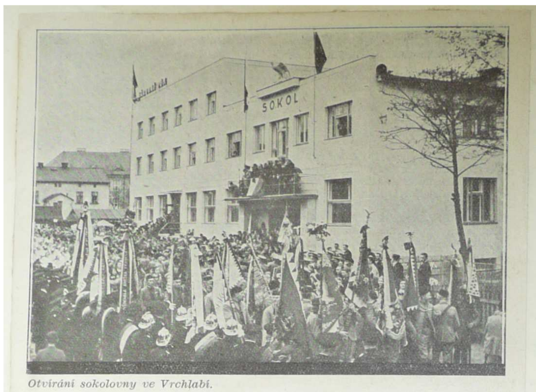
Otvírání sokolovny ve Vrchlabí.