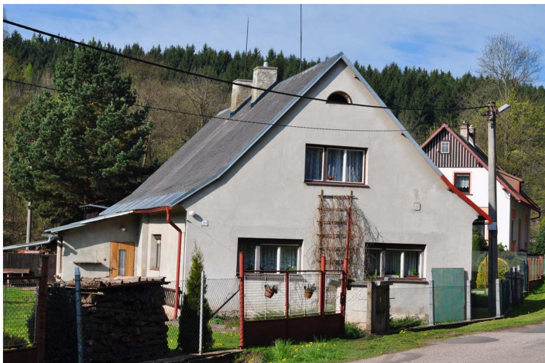
Příloha č. 11: Rudník, bývalé sídlo české menšinové školy.