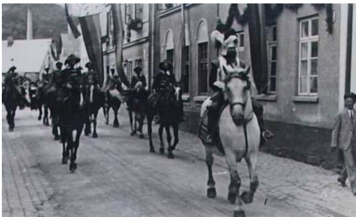
Příloha č. 16: Vrchlabí, oslavy čtyřstého výročí povýšení na město v roce 1933.