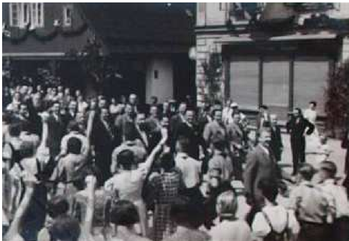
Příloha č. 18: Vrchlabí, sjezd Svazu Němců v Čechách v roce 1937.