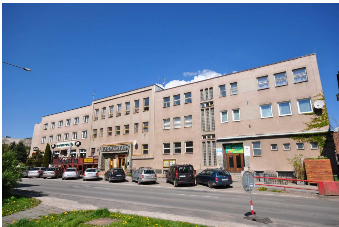
Příloha č. 12: Vrchlábí, sokolovna a Národní dům postavený roku 1937.