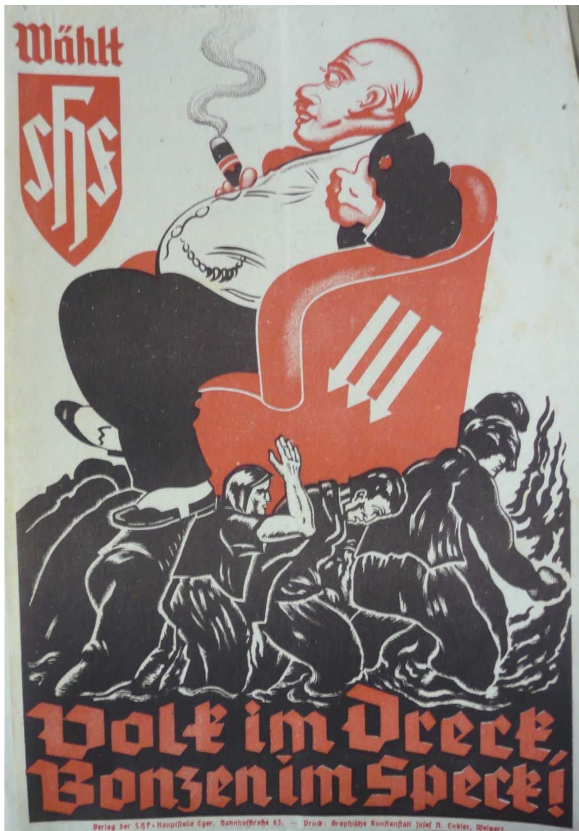
Příloha č. 17: Volební plakát Sudetoněmecké strany šířený v okrese před volbami v roce 1935.