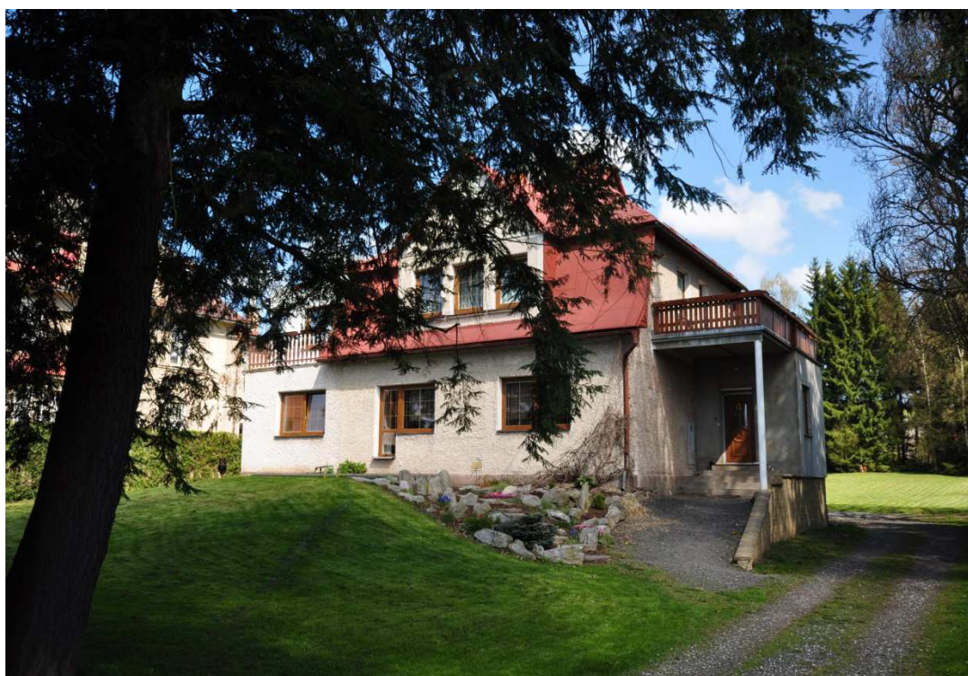
Příloha č. 10: Dolní Branná, bývalé sídlo české menšinové školy.