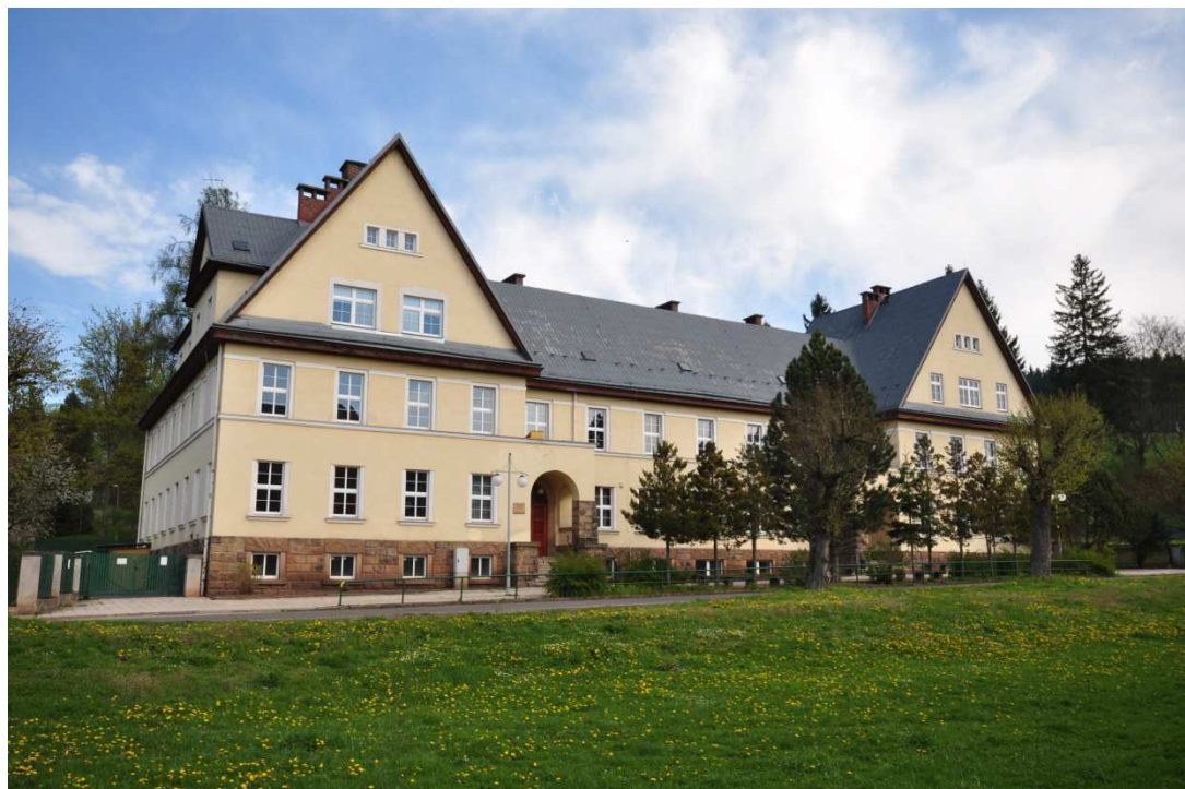
Příloha č. 8: Hostinné, bývalý sirotčinec, od roku 1919 také sídlo české menšinové školy.