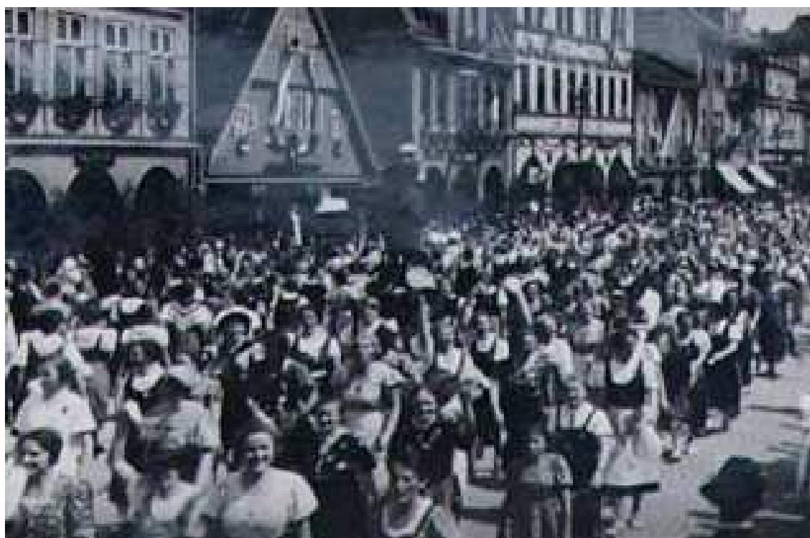
Příloha č. 19: Vrchlabí, sjezd Svazu Němců v Čechách v roce 1937.