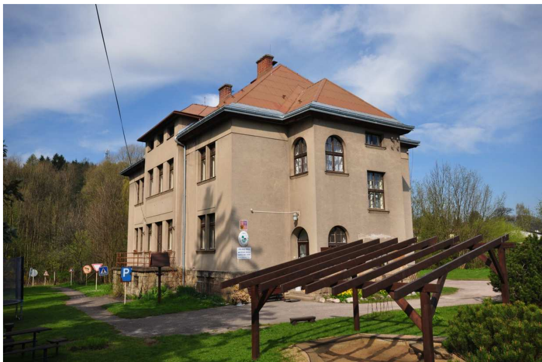
Příloha č. 9: Kunčice nad Labem, bývalé sídlo české menšinové školy.