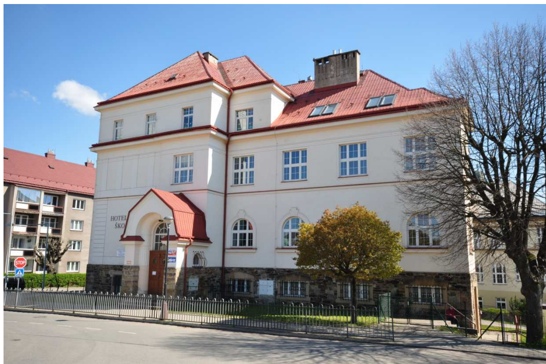
Příloha č. 7: Vrchlabí, bývalá německá jubilejní škola, od roku 1921 sídlo české menšinové školy.