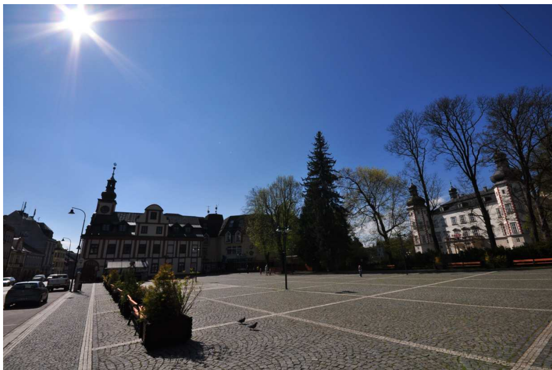
Příloha č. 3: Náměstí ve Vrchlabí, místo pořádání slavností, manifestací a demonstrací.