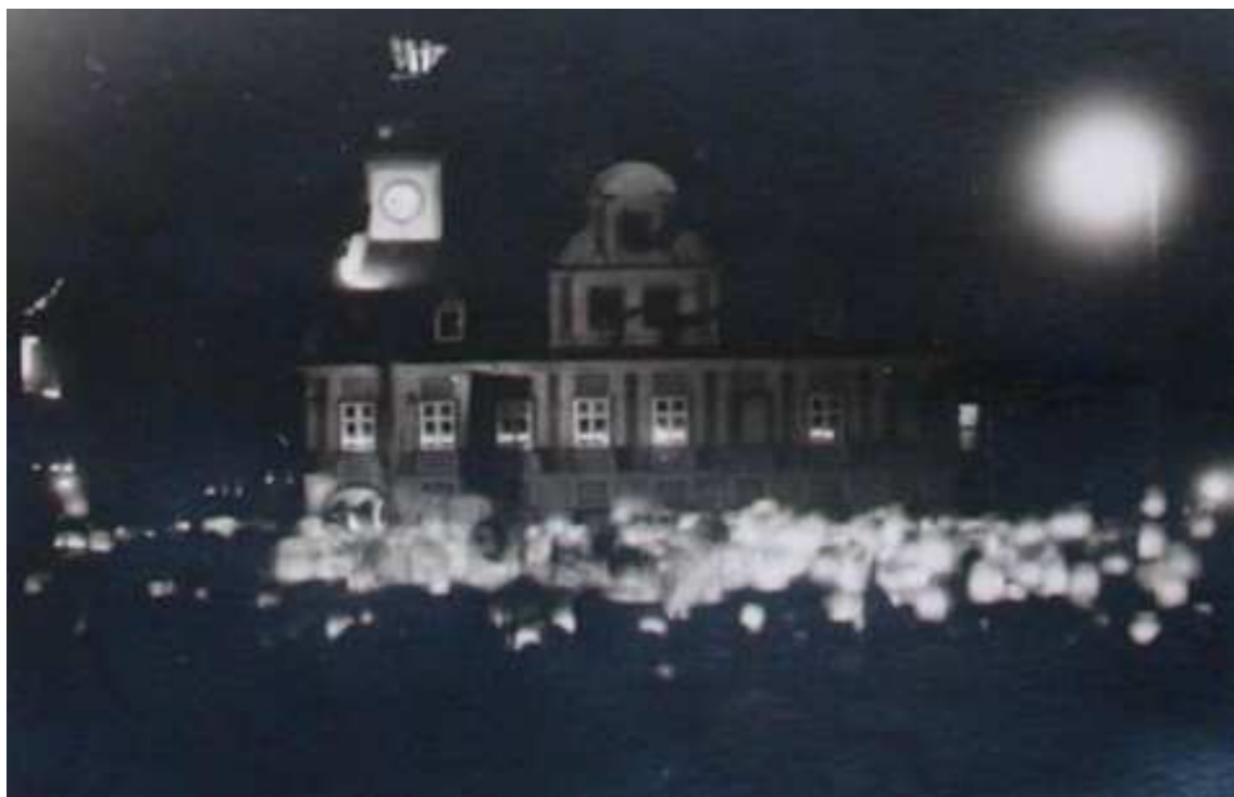
Příloha č. 15: Vrchlabí, oslavy čtyřstého výročí povýšení na město v roce 1933.