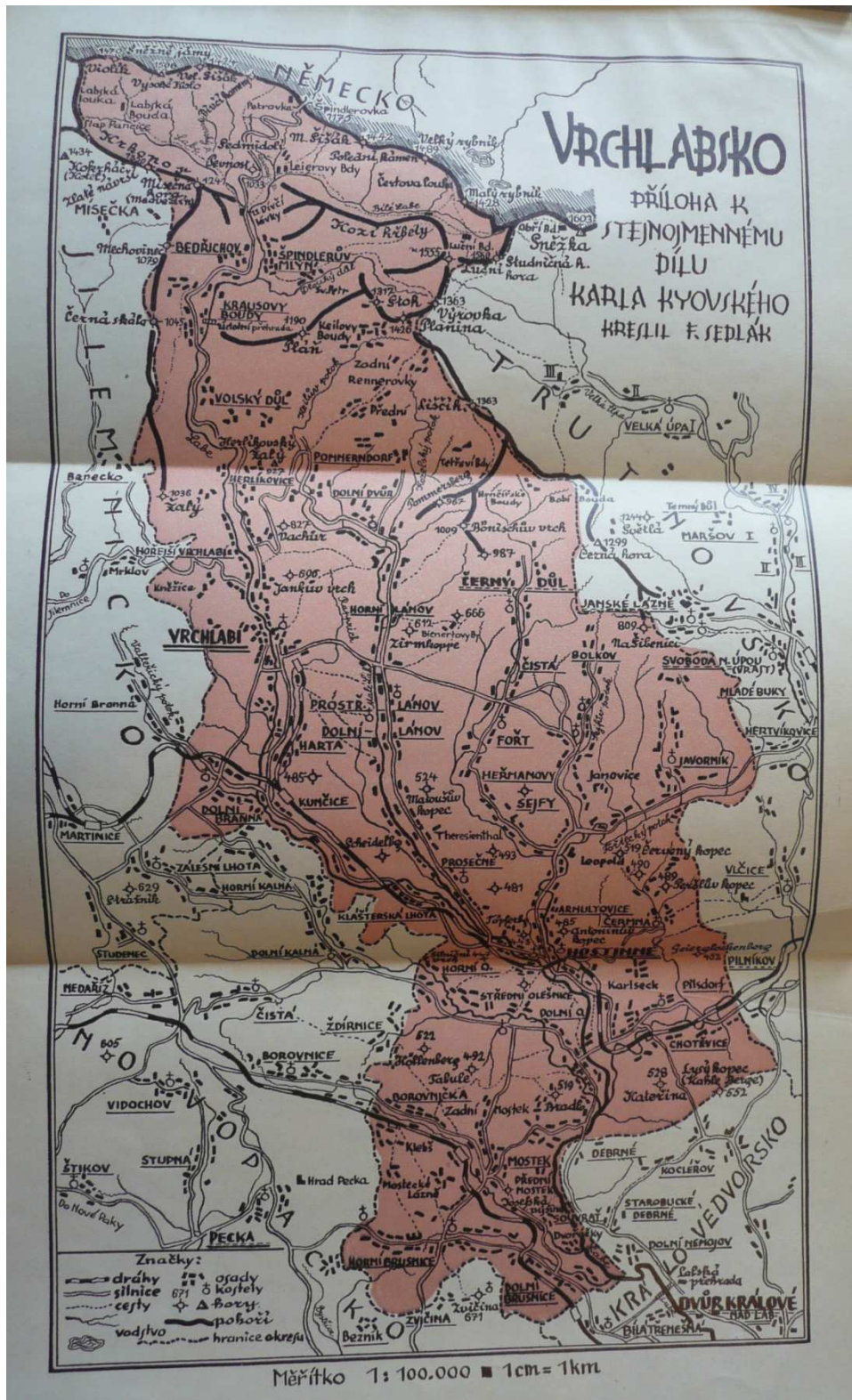
Příloha č. 1: Mapa meziválečného politického okresu Vrchlabí.