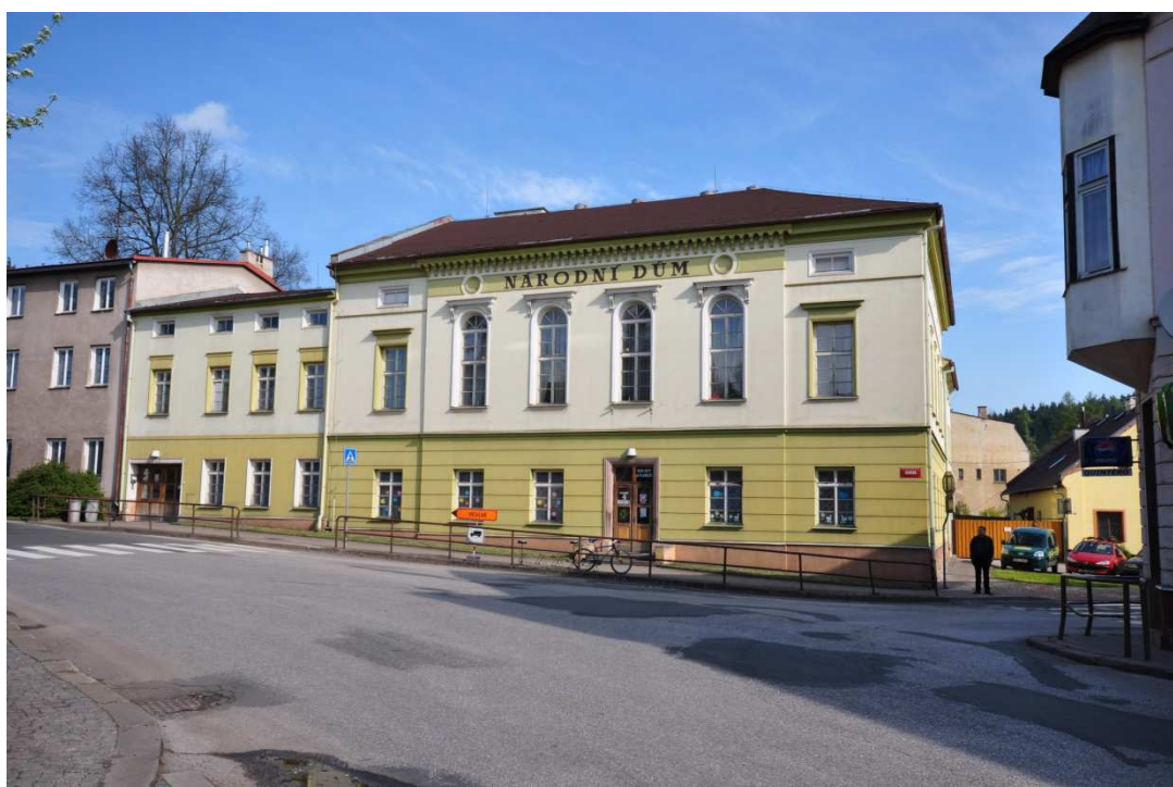
Příloha č. 6: Národní dům v Hostinném koupěný Národní jednotou severočeskou, centrum českého menšinového života.