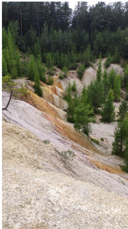
Obrázek 6: Pohled na geologické varhany