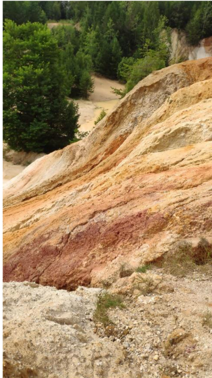
Obrázek 5: Odkryv rudických vrstev