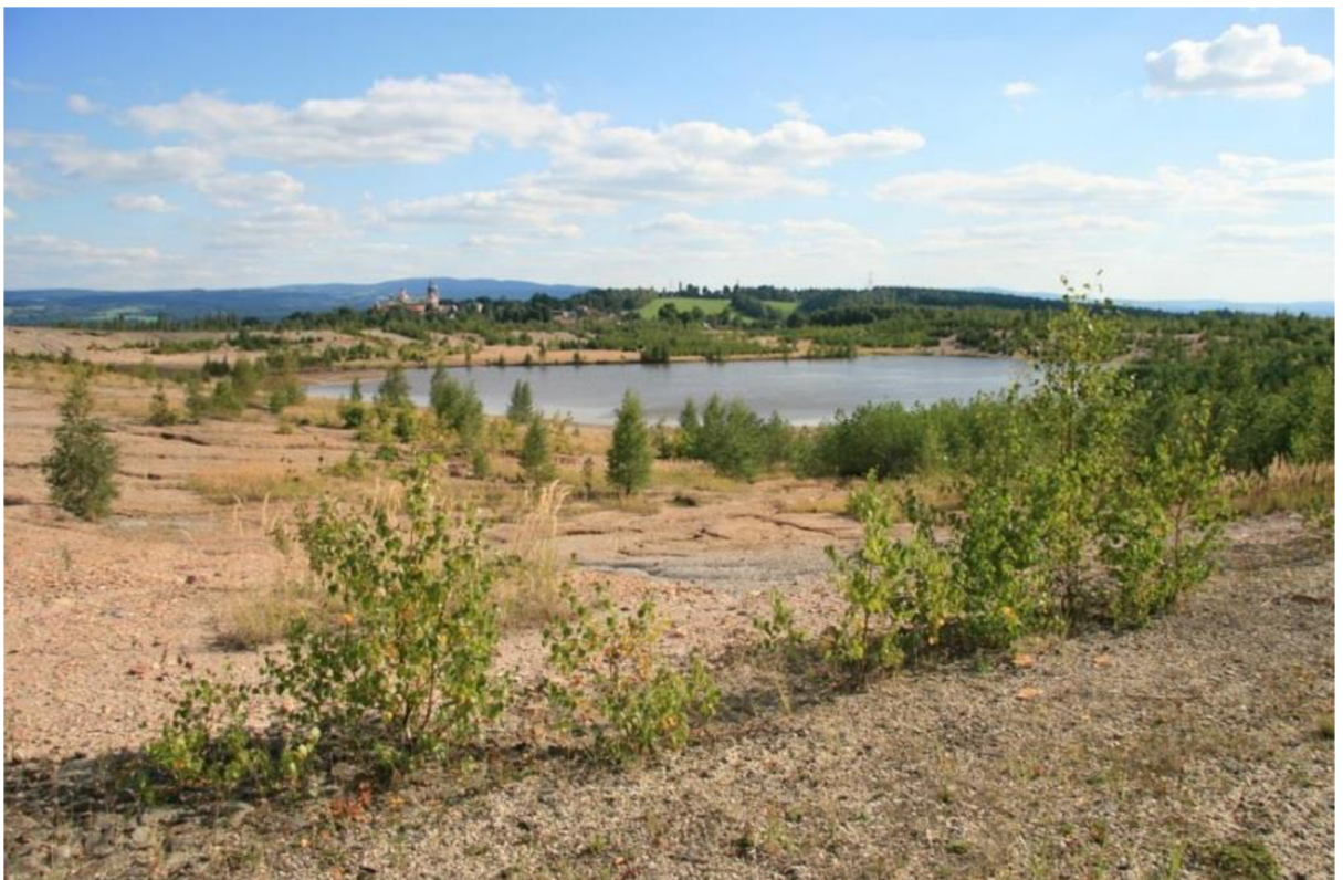
Obrázek 2: Hydrická rekultivace na Lítovské výsypce

Vodohospodářské rekultivace jsou společně s rekonstrukcí vegetačního krytu důležitým opatřením pro tvorbu nového hydrologického režimu. Problémem se stává obnova biologické rozmanitosti druhů vodních rostlin a živočichů, které brání fakt, že jsou tyto uměle vytvořené vodní nádrže většinou dost hluboké a schází jim široká pásma s mělkou vodou. To dokazuje, že projektanti rekultivačních plánů nevěnují dostatečnou pozornost ekologickým vazbám a funkcím nových vodních děl. Dalším negativním faktorem při provádění technických rekultivací je to, že dochází k likvidaci menší a středně velké terénní elevace i deprese, které vytvářejí prostor pro stálé nebo periodické vodní tůně, jež slouží k rozmnožování obojživelníků, na jejichž populace jsou pak potravně závislé i další skupiny obratlovců – jako například některé druhy plazů a ptáků. Dochází tak ke snižování geomorfologické, biotopové i biologické diverzity.