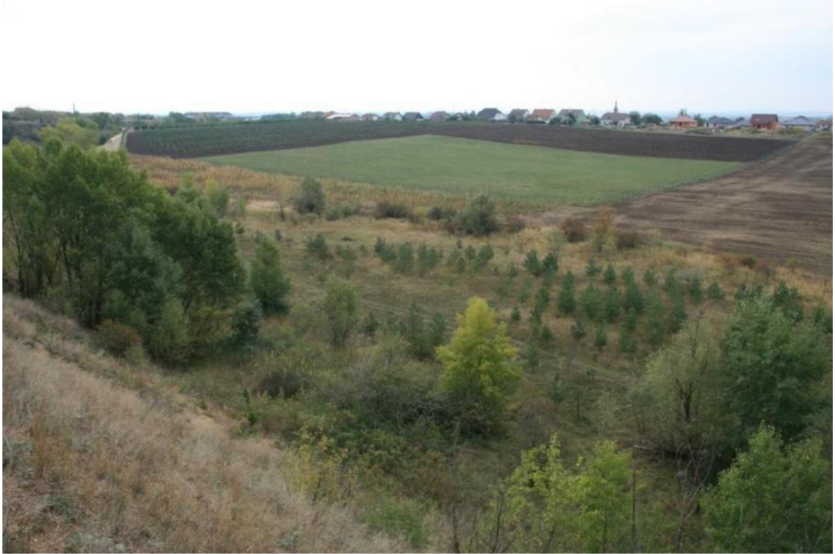
Obrázek 1:Vhodně zkombinovaná zemědělská a lesnická rekultivace

přirozené druhové skladby. Tímto způsobem můžeme dosáhnout pozitivního efektu na biodiverzitu a současně výrazného snížení značných nákladů na lesnické rekultivace, které dnes až trojnásobně převyšují běžné ceny zalesňování na pozemcích určených k plnění funkcí lesa.