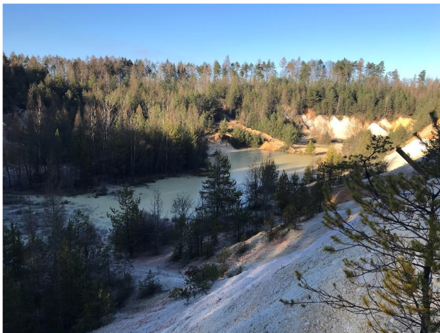
Obrázek 4: Pohled na lom Seč z vrcholku svahů

Jelikož se tato lokalita nachází na chráněném krajinném území a zároveň krasovém území, jedná se o místo, které od ukončení těžební činnosti nebylo nějak výrazně ovlivněno člověkem a jeho zásahy zde jsou viděny pouze po bývalé těžbě. Od ukončení těžby se území mohlo samovolně vyvíjet bez řízení člověkem a vytvořil se zde ojedinělý biotop, na kterém existují zvláště chráněné druhy, které jsou vázány výhradně na písčiny. V porovnání s lomy, které se nacházejí v blízkém okolí, kde v převážné většině byla uplatněna hydriická rekultivace, což znamená zavezení lomu určitým materiálem a následné zatopení a využití pouze k rekreačním účelům, nabízí toto území budoucím specialistům pro plánování rekultivací jedinečnou možnost pro názornou ukázkou samovolné sukcese jako přírodě blízké obnovy.