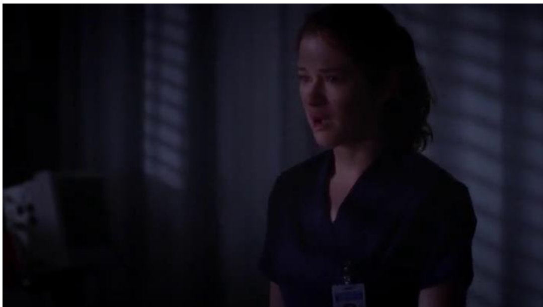
obr. 19. – „ Chci tebe, Jacksone. “ (epizoda 9x24 Perfect Storm )