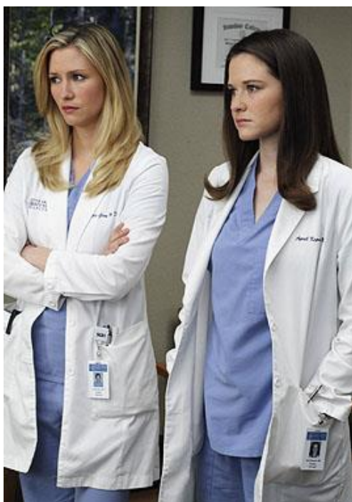
obr. 4. – Aprilina původní barva vlasů (epizoda 6x19 Sympathy For the Parents / Smrt paní Clarkové )