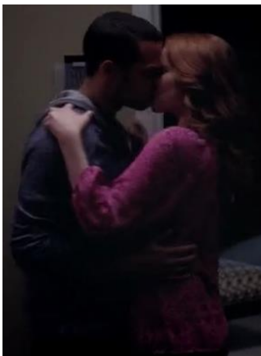
obr. 15. – April iniciativně políbí Jacksona (epizoda 8x21 Moment of Truth / Okamžik pravdy )