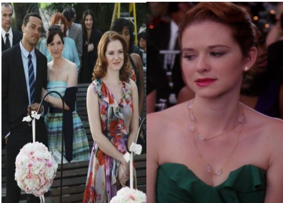
obr. 17., 18. – April na svatbě Callie jako panna, April na svatbě Mirandy po ztrátě panenství (epizody 7x20 White Wedding / Svatba v bílém, 9x10 Thing We Said Today / Začít od začátku)