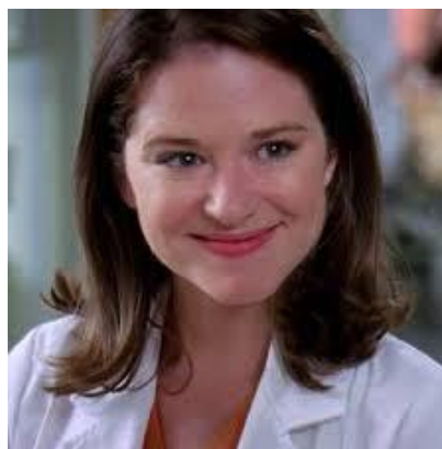
obr. 12., 13. – V obou případech je April učarována „McVysněným“, což vyvolává negativní reakce (epizody 6x20 Hook, Line and Sinner / Hák, miminko a dr. Evans , 6x05 Invasion / Invaze )