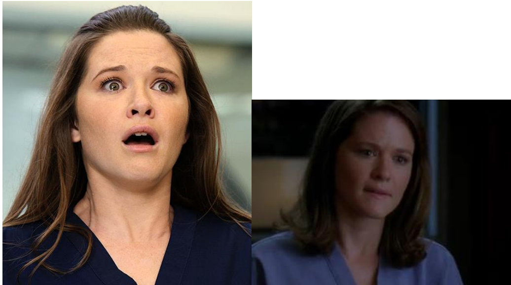
obr. 8., 9. – Detailní záběry na tvář Sarah Drew zachycující mimiku a výraz obličeje (epizody, 6x23 Sanctuary / Střelec , 6x06 I Saw What I Saw / Co jsem viděl, to jsem viděl )