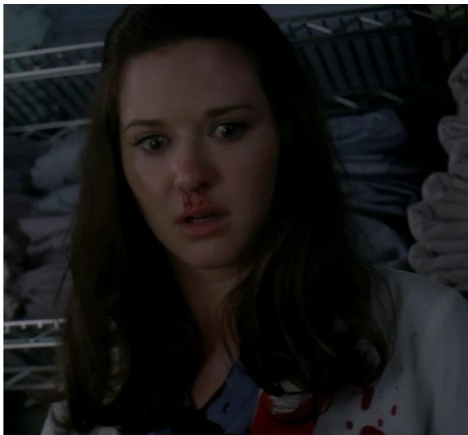
obr. 10. – Výraz tváře April při pohledu... (epizoda 6x23 Sanctuary / Střelec )