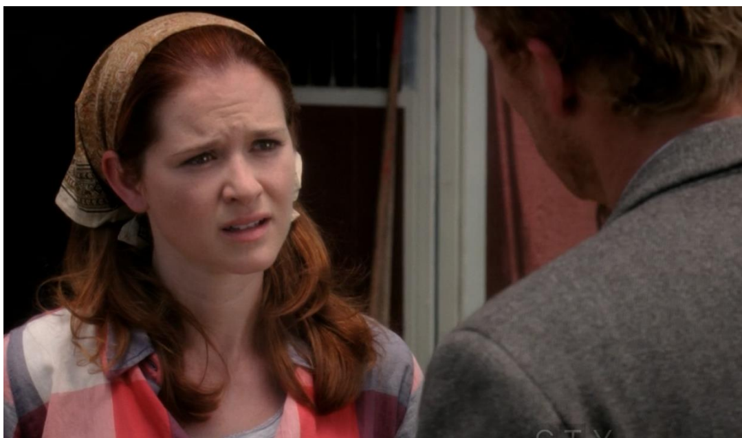
obr. 20. – April ve svém rodinném prostředí farmy (epizoda 9x01 Going Going Gone / Dotyk medúzy)