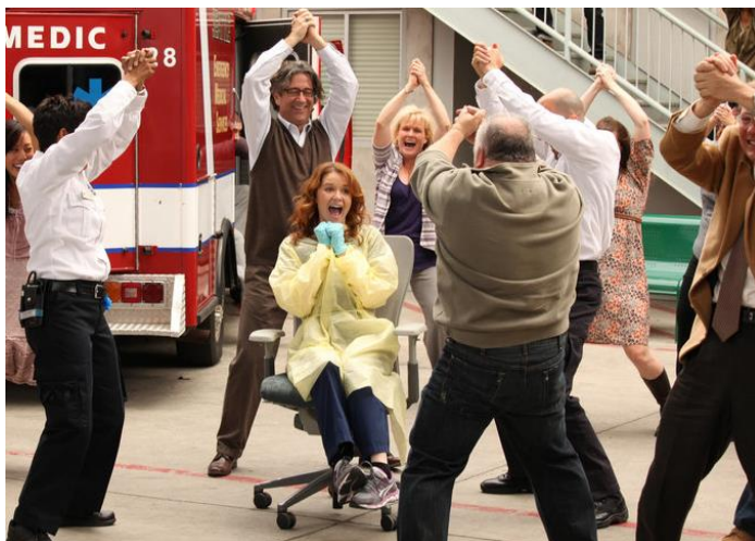
obr. 21. – Matthew žádající April o ruku (epizoda 9x23 Readiness Is All )