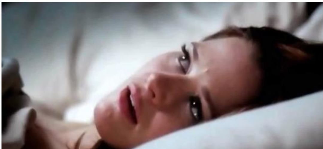
obr. 16. – Aprilino uvědomění, že právě ztratila panenství (epizoda 8x21 Moment of Truth / Okamžik pravdy)