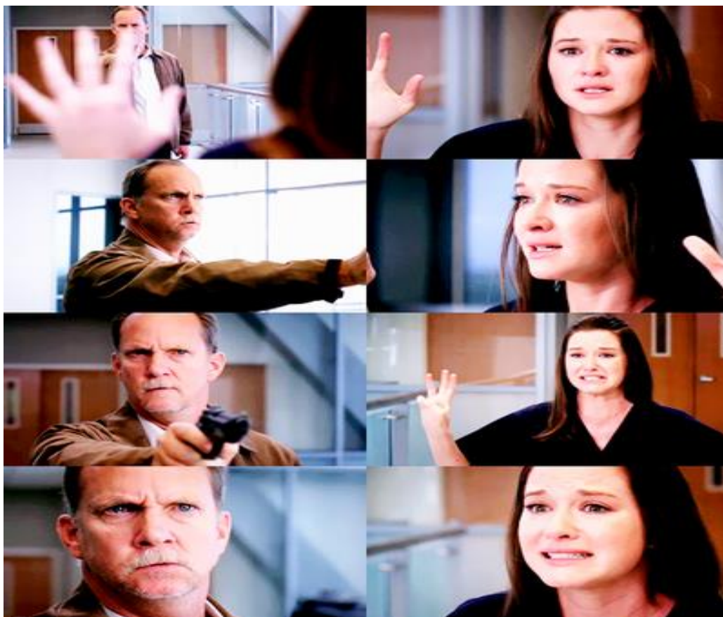
obr. 2. – April říkající svůj monolog tváří v tvář ozbrojenému Garymu Clarkovi (epizoda 6x23 Sanctuary / Střelec )