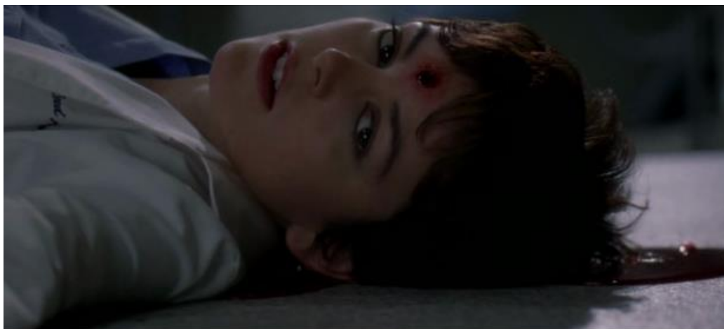
obr. 11. - ...na mrtvou Reed Adamson v temném skladu (epizoda 6x23 Sanctuary / Střelec )