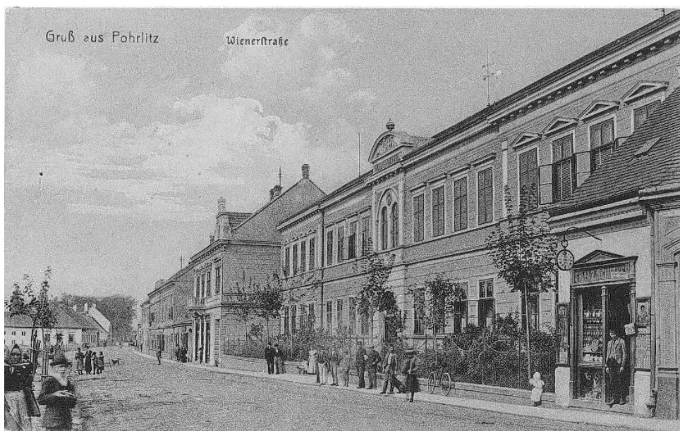
KRATOCHVÍL, A.: Pohořelický okres . Brno: Garn, 1913.