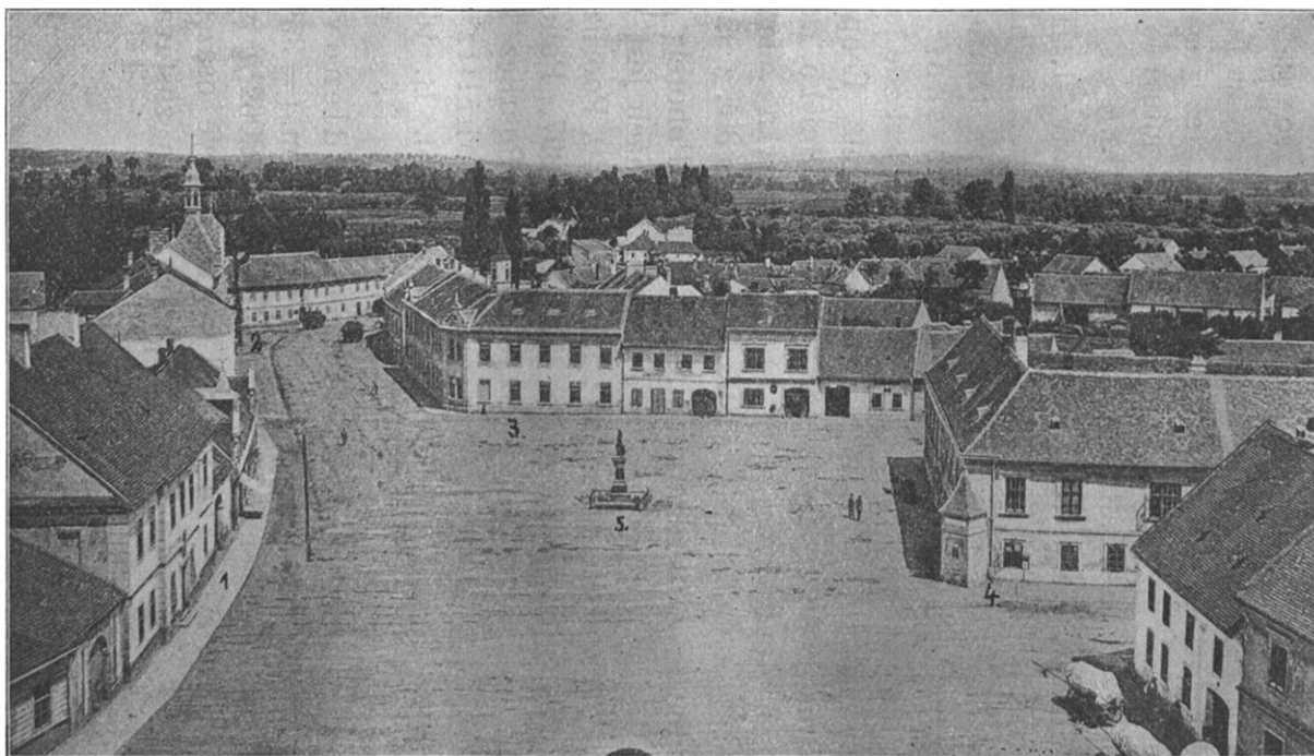
KRATOCHVÍL, A.: Pohořelický okres . Brno: Garn, 1913.

Příloha 5 - náměstí Svobody v Pohořelicích (1 = fara; 2 = spořitelna; 3 = radnice; 4 = býv. svob. dvůr (Rundenštejn), dnes hotel „Pfaun“; 5 = socha císaře Josefa II.)