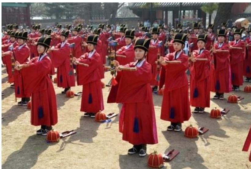
Tanečníci při rituálu na počest Konfucia