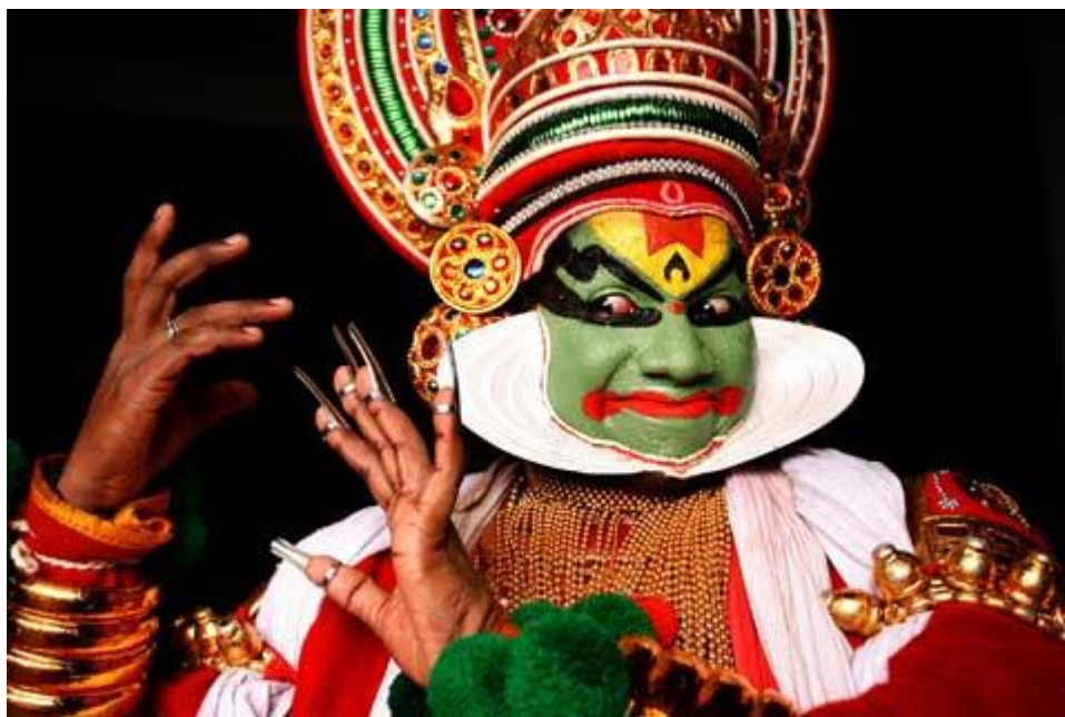
Indický tanec Kathakali