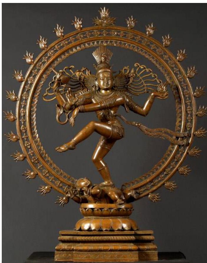
Bronzová socha boha Šivy – Natarádži, zpodobňující jeho kosmický tanec