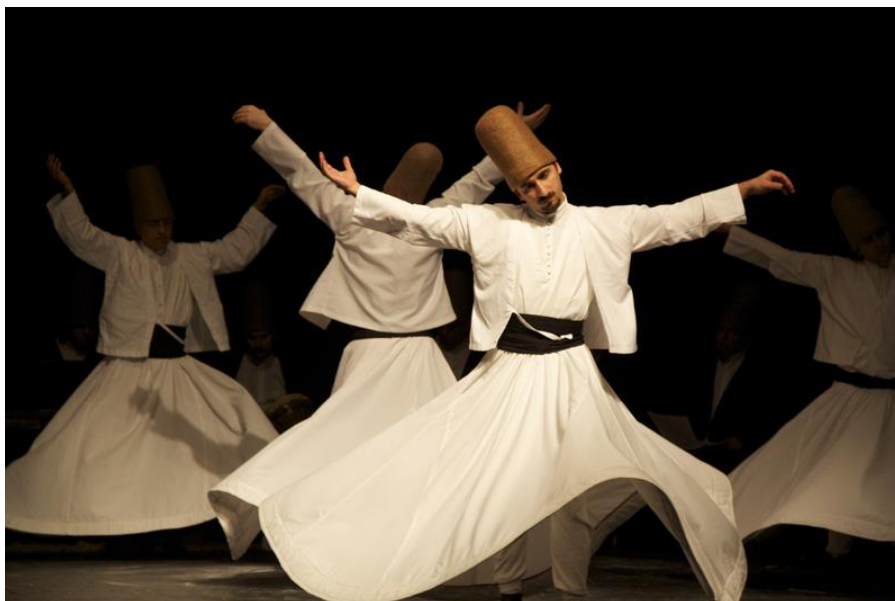
Tanec derviřů