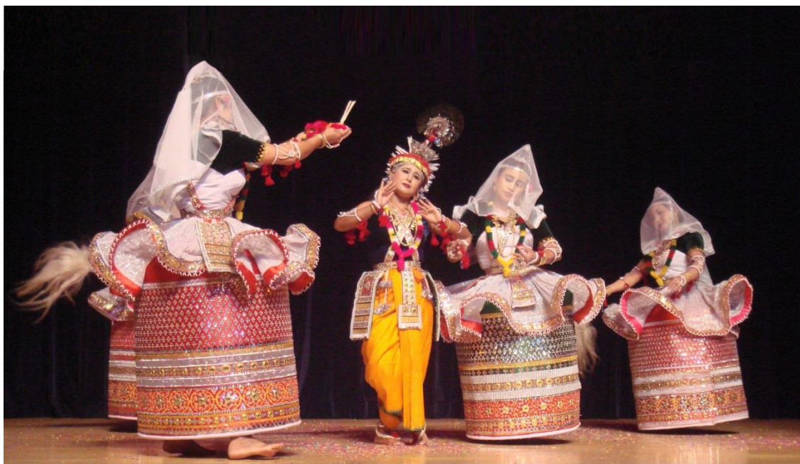
Tanečnice Manípuri