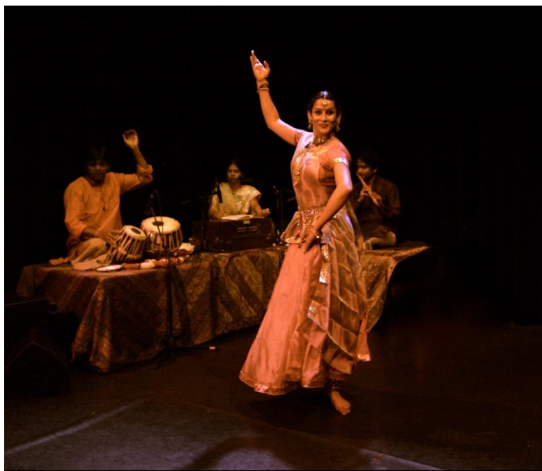
tanečnice tančící Kathak, v pozadí s hudebníky