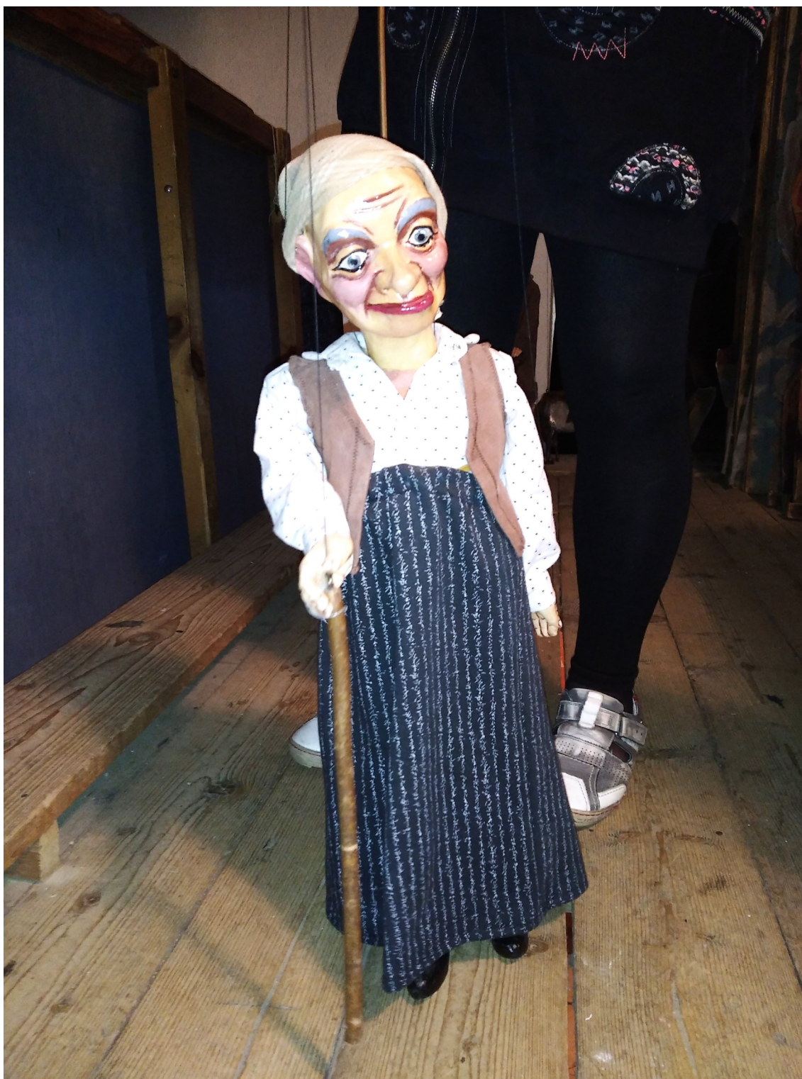
Příloha č. 5: Stařenka, loutka Loutkové scény DS Krakonoš, Vysoké nad Jizerou