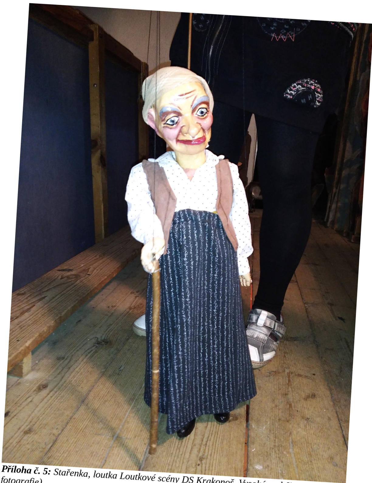
Příloha č. 5: Stařenka, loutka Loutkové scény DS Krakonoš, Vysoké nad Jizerou