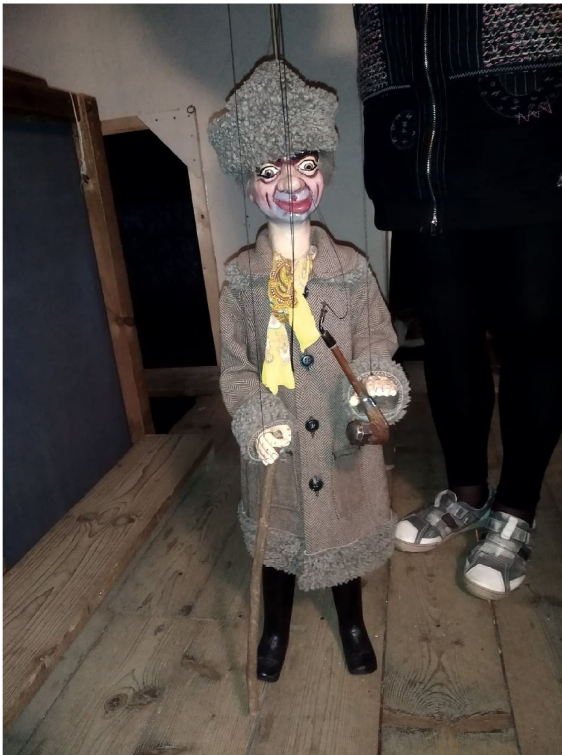
Příloha č. 3: Starosta Škrhola, loutka Loutkové scény DS Krakonoš, Vysoké nad Jizerou