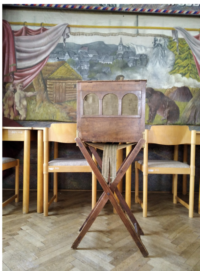
Příloha č. 8: Flašinet, Loutková scéna DS Krakonoš, Vysoké nad Jizerou