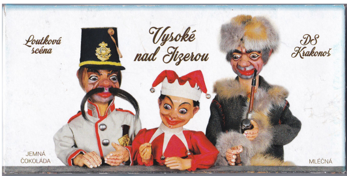
Příloha č. 9: Čokoláda s motivy LS Krakonoš (k zakoupení v rámci představení), Loutková scéna DS Krakonoš, Vysoké nad Jizerou