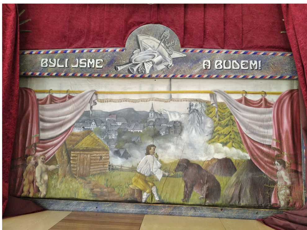
Příloha č. 7: Opona s heslem LS, Loutková scéna DS Krakonoš, Vysoké nad Jizerou