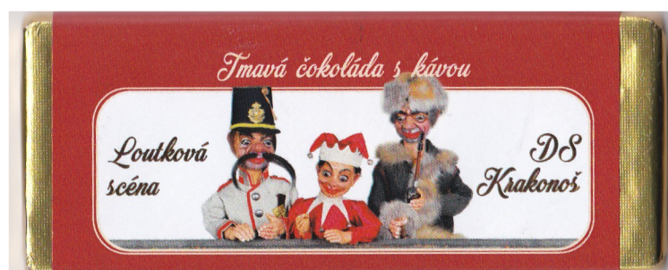
Příloha č. 10: Čokoláda s motivy LS Krakonoš (k zakoupení v rámci představení), Loutková scéna DS Krakonoš, Vysoké nad Jizerou