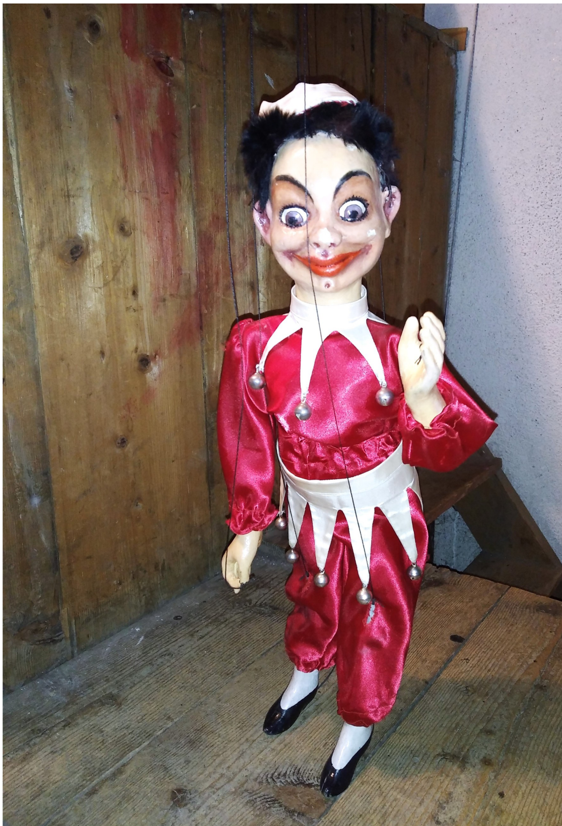
Příloha č. 2: Kašpárek, loutka Loutkové scény DS Krakonoš, Vysoké nad Jizerou