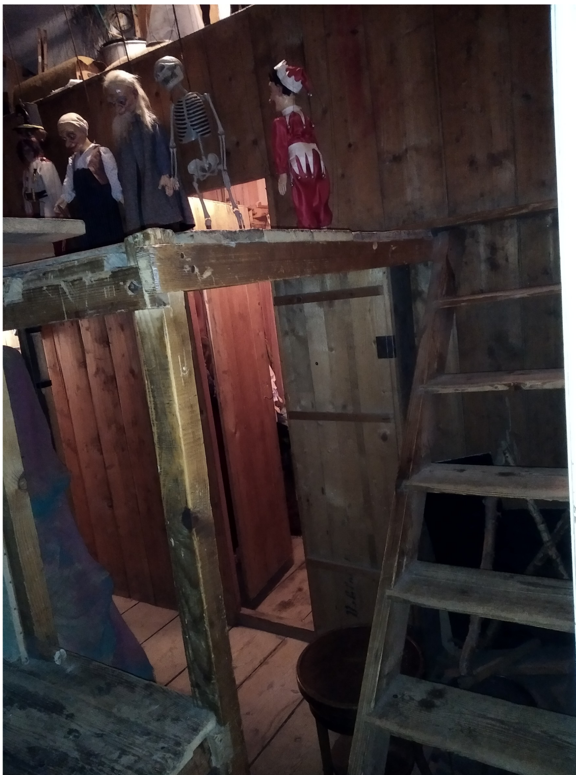
Příloha č. 6: Zákulisí loutkového divadla, schody a plošina za (nad) scénou, Loutková scéna DS Krakonoš, Vysoké nad Jizerou