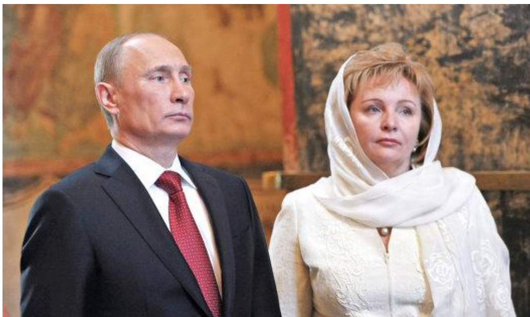
Obr. č. 7: Ruský prezident s manželkou Ljudmilou