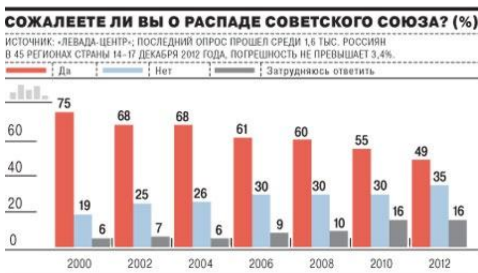
Graf 3: Kolik Rusů lituje rozpadu Sovětského svazu 17

k velkému národnímu pokroku a k získání velkých území. Průzkumy prokázaly, že názor Putina sdílí až 60% mladých Rusů. Sám Putin odpověděl na dotaz o jeho osobním vztahu k rozpadu SSSR následovně: «Развал Советского Союза-это общенациональная трагедия огромного масштаба. Я думаю, что рядовые граждане бывшего Советского Союза и граждане постсоветского пространства, стран СНГ ничего от этого не выиграли- наоборот, люди столкнулись с огромным количеством проблем. Но, Российская Федерация, сохранилась, и она перестала быть „дойной коровой“ для всех и каждого.» 16