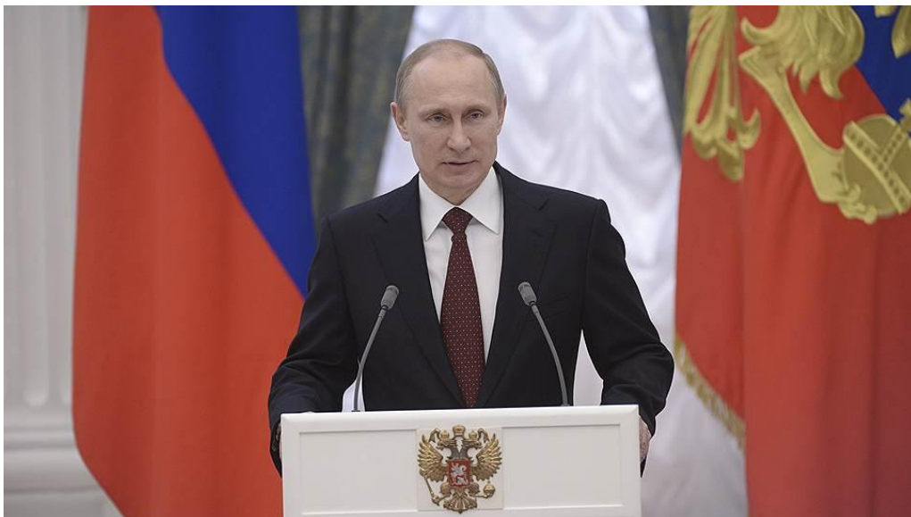
Obr. č. 9: Vladimír Putin