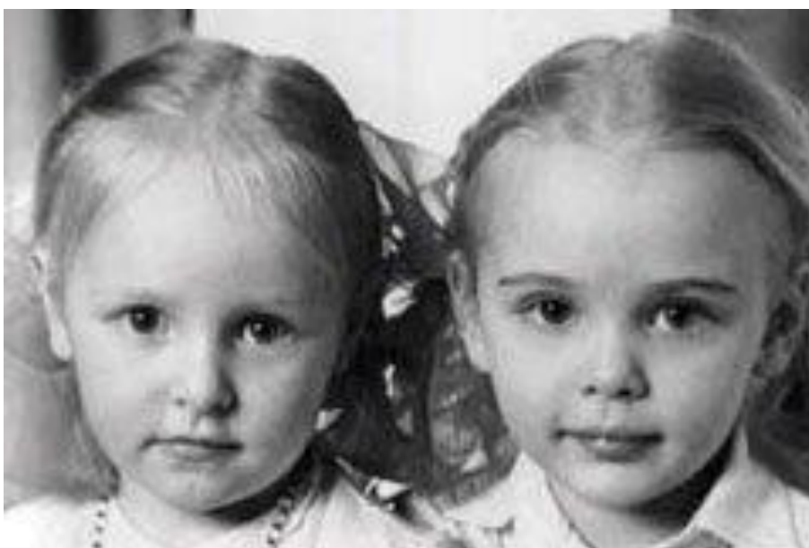
Obr. č. 4: Dcery Putina a jeho ženy