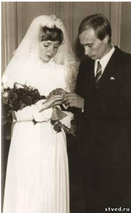
Obr. č. 3: Svatba Vladimíra s Ljudmilou