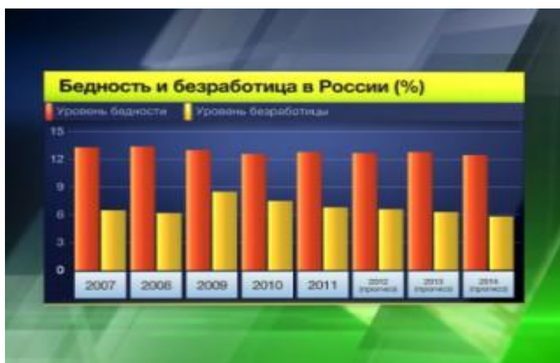
Graf 4: Snižování počtu chudých lidí 18

Zlepšení ekonomické situace se podepsalo i na výplatách. Na konci roku 2000, tedy po nástupu Putina na post prezidenta, začaly příjmy převyšovat růst cen. Abychom získali představu, nutno uvést konkrétní čísla. Během třinácti let (2000-2013) se průměrný příjem na člověka zvýšil z 2281 rublů na úctyhodných 38340 rublů. Na průměr mají samozřejmě veliký vliv vysoké výplaty ve velkých městech, především pak v Moskvě. V Moskvě jsou totiž peněžní ohodnocení zaměstnanců mnohokrát vyšší než v ostatních městech. S rostoucími výplatami klesl počet chudých lidí, jejichž finanční situace neodpovídá životnímu minimu. S největší chudobou se Rusko potýkalo v roce 1992, kdy byl prezidentem Boris Jelcin. Tehdy se počet chudých lidí pohyboval okolo 49 milionů lidí, což je přibližně 33,5% populace Ruské federace. Po zvolení Putina do funkce prezidenta všichni očekávali zázraky. Nutno podotknout, že se obrátili na správného člověka, který pouze nesliboval, ale také jednal. Výsledky mluví za vše.