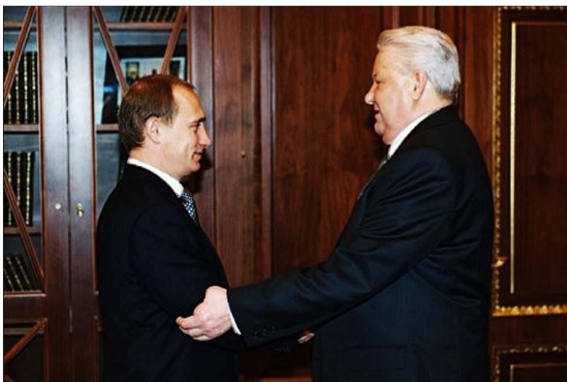
Obr. č. 6: Putin s bývalým prezidentem Borisem Jelcinem