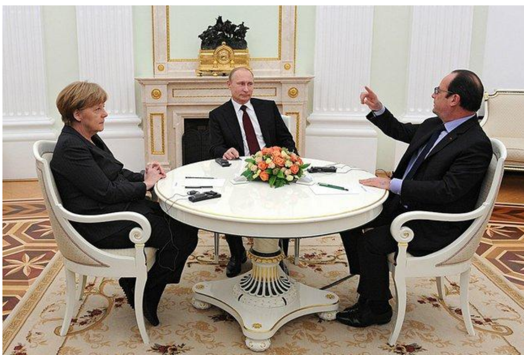
Obr. č. 8: Putin s Angelou Merkel a francouzským prezidentem