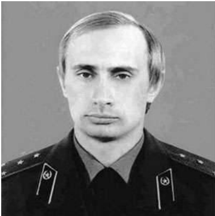
Obr. č. 5: Putin v KGB