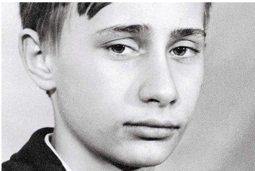
Obr. č. 1: Vladimír Putin v mládí