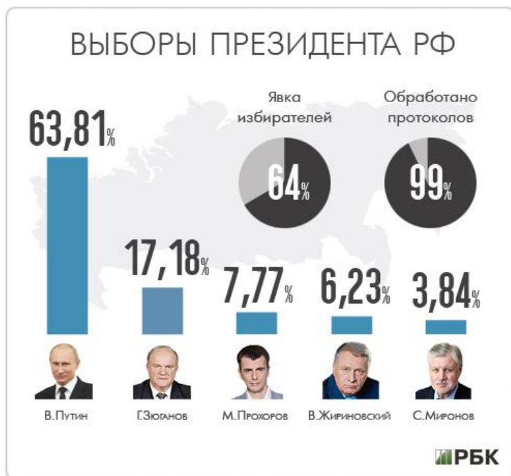
Graf 1: Volba prezidenta v roce 2012 13

rušena z důvodu nahlášené bomby nebo jiných potíží. Říká se, že dokonce dva z jeho protikandidátů měly být do voleb pouze nastrčení, aby tak podpořili popularitu Putina. Kde je pravda nikdo neví. Ta zůstane bezpečně ukryta za zdmi Kremle.