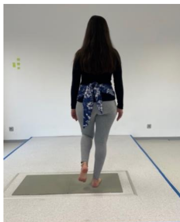
Obrázek 4. Stoj na dominantní končetině