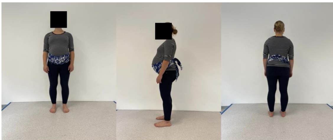
Obrázek 8. Úvaz podvazového šátku