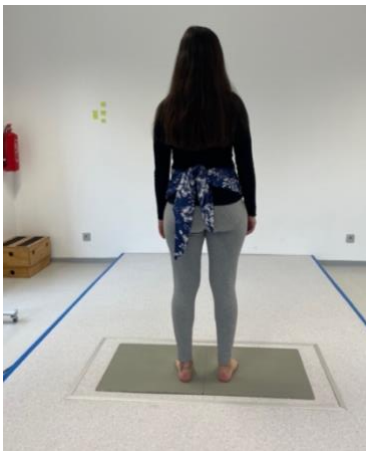
Obrázek 3. Stoj na šířku pánve

Lisfrankova kloubu. Následovalo měření senzory Trigno (Delsys®, Boston, USA). Proband byl poučen, aby po odstartování došel z místa A do místa B, jež od sebe byly vzdálené 17,80 m, svou přirozenou chůzí. Následně se měření opakovalo, přičemž místo B bylo výchozím bodem. Po dokončení měření při výše zmíněných situacích, byl probandovi uvázán podvazový šátek, jehož úvaz byl pro všechny stejný (Obrázek 8) a měření se opakovalo. Referenčním bodem byla otázka směřující na probandovi subjektivní pocity po uvázání šátku, přičemž očekávanou odpovědí bylo popsání nadlehčení, u netěhotných žen to byl pocit zpevnění.