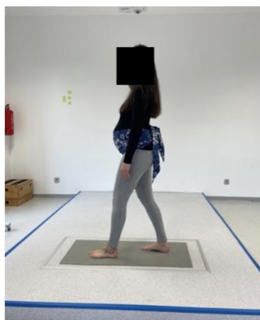
Obrázek 6. Tandemový stoj s nedominantní končetinou vpředu