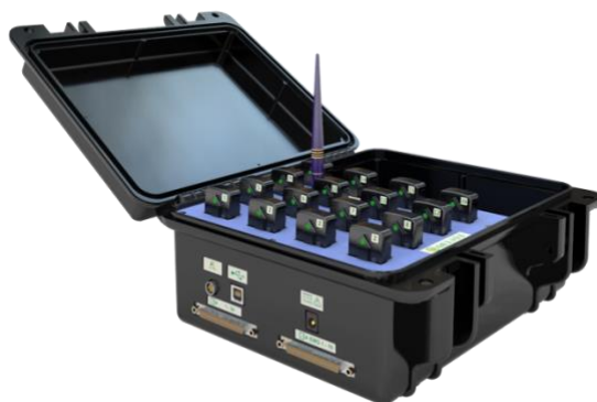
Obrázek 2 Trigno wireless system

Akcelerometrický systém typu Trigno wireless systém (Delsys Inc., Natick, MA, USA, sběrná frekvence 296 Hz), byl využit pro snímání zrychlení. Zařízení v sobě kombinuje senzory pro snímání zrychlení a senzory pro snímání povrchového EMG signálu (Obrázek 2).