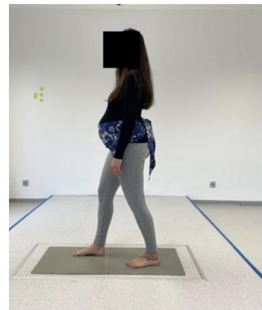
Obrázek 5. Modifikovaný tandem v dominantní končetinou vpředu