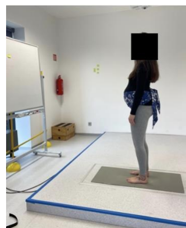
Obrázek 7. Stoj otočený o 90°