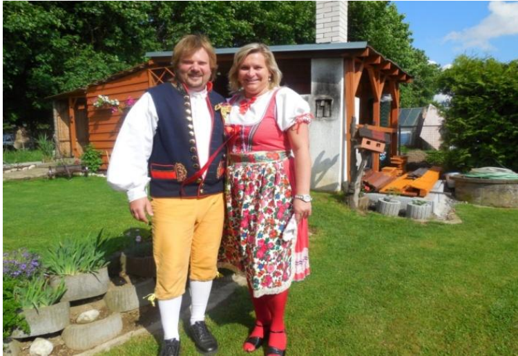
Obrázek 2. Pouť, Draženov, r. 2014.

Pokud se rodiče dětí oblékají na slavnosti do krojů, je to ta nejlepší cesta k předávání tradic. Na druhém obrázku je takzvaný lehký kroj, který byl vhodný pro běžné nošení. Není tak slavnostní, jako kroj těžký . Ale přesto ho dnešní soubory stále používají. Kroj se dá různě kombinovat. Při vystoupení souboru mají dívky na hlavě červený šátek s tištěným vzorem.