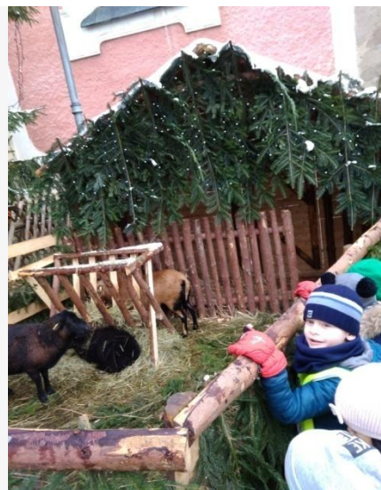
Obrázek 15. Živý Betlém