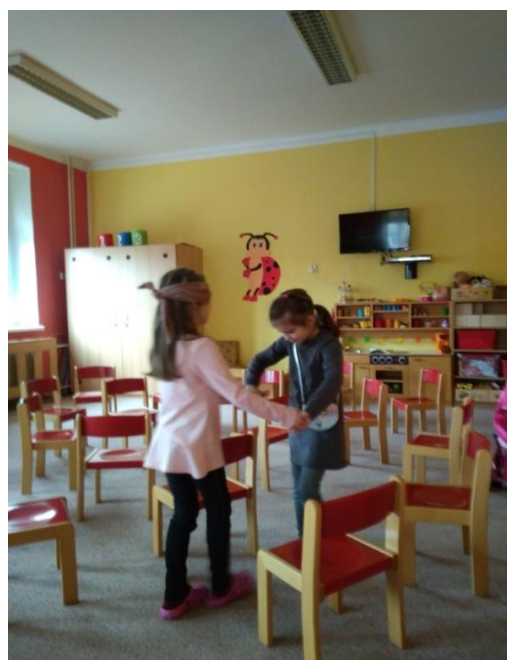
Obrázek 7. Strážný anděl