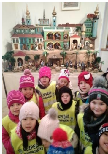
Obrázek 17. Výstava Betlému