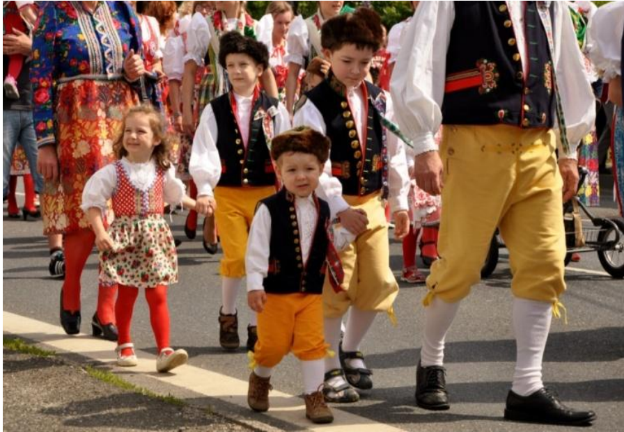
Obrázek 1. Děti v průvodu, rodáci Draženov, r. 2015.

Na uvedeném obrázku bych chtěla zdůraznit, že nošení kroje u dětí jde spíše o funkci estetickou, dítě je pasivním nositelem kroje, nijak samo do jeho podoby a úpravy nezasahuje. Jde o náznak příslušnosti zachovávat tradice a znát své kořeny. Dítě je vedeno, aby si uvědomilo svoji identitu s místem, kde se narodilo, kde vyrůstá. Rozhodnutí v pozdějším věku, zda si kroj obléct se nechává pouze na něm samém. Pravidla oblékání kroje a barevných kombinací se na dolním i horním Chodsku předávají z generace na generaci. V Draženově se dodnes zachovaly staré zvyky a částečně i chodské nářečí.