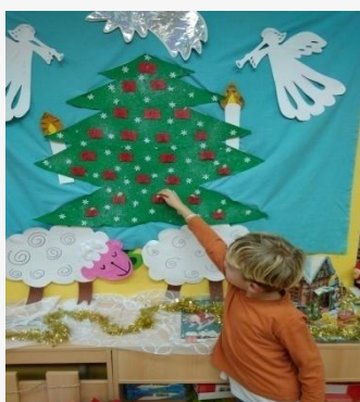
Obrázek 19. Poslední přání

Překvapení z kouzelného stromu – dnešní den byl pro nás velice zvláštní, protože jsme věděli, že kouzelný strom má už jen jedno neodkryté psaníčko. Děti celé ráno byly netrpělivé a domlouvaly se, co by asi mohlo psaníčko mít za poslední překvapení. Třída byla krásně uklizená a vánočně nazdobená, stoly byly prostřené a koledy nám poskytly krásnou vánoční atmosféru. Poprosila jsem jednoho chlapce, zda by nám neodkryl poslední překvapení z našeho kouzelného stromu, které jsem dětem přečetla, překvapení obsahovalo, že nás dnes navštíví Ježíšek, abychom byli hodně potichu a nezapomněli Ježíškovi otevřít okno.