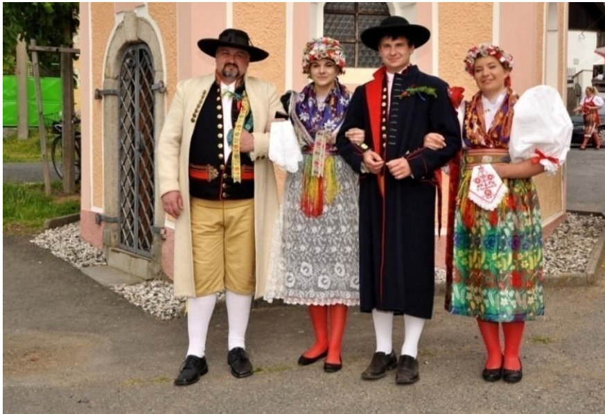
Obrázek 4. Rodáci Draženov, Chodská svatba, r. 2015.

Na čtvrtém obrázku je kroj svatební, který se na Chodsku od konce 19. století oblékal už jen velmi zřídka, neboť jej nahradily šaty „pancký“. V současné době se mezi lidmi opět kroje při svatbách začínají postupně objevovat.