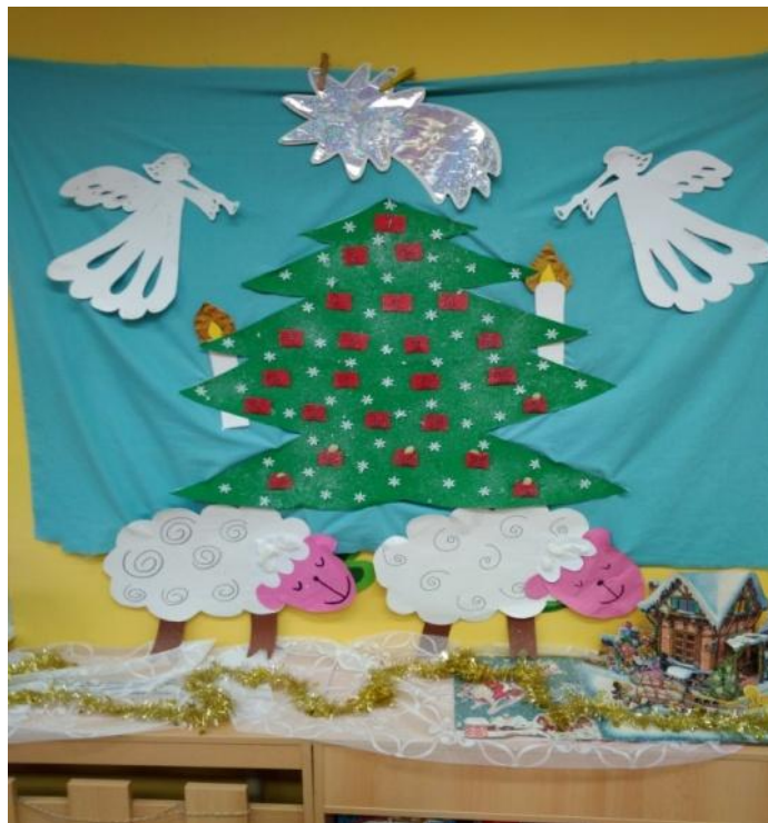
Obrázek 5. Kouzelný strom s překvapením

Pro lepší časovou představu dětí jsem připravila adventní kalendář v podobě látkového stromu, který je kouzelný. Na svých větvích má pytlíčky, ve kterých jsou psaníčka s nějakým překvapením nebo úkolem pro děti - na každý adventní (pracovní) den, jeden. Až děti rozbálí poslední psaníčko, budou vědět, že do školky přijde Ježíšek.