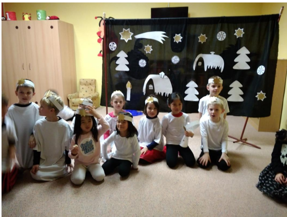
Obrázek 16. Vánoční besídka