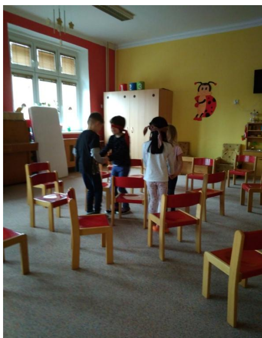
Obrázek 6. Strážný anděl

Co to novýho, neslýchanýho. Děti, také slyšíte mráz, jak nám klepe na okýnko? Pojd'te, pustíme ho k nám. Nácvik písně.