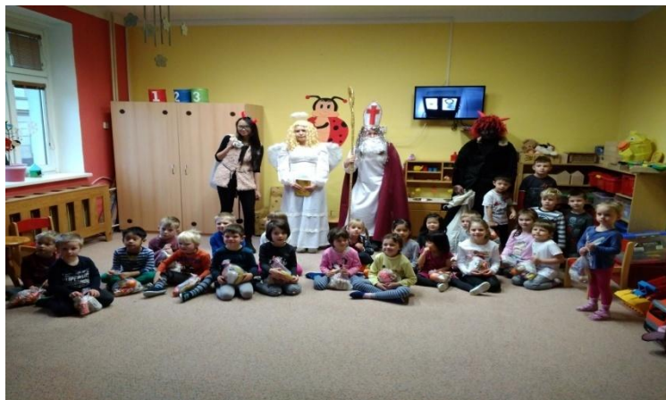
Obrázek 13. Návštěva Mikuláše, anděla a čerta

Píseň – Mikuláši, Mikuláši, hdo to tady děti straší, hdo tu řinčí řetězem a hdo s tebou přišel sem.