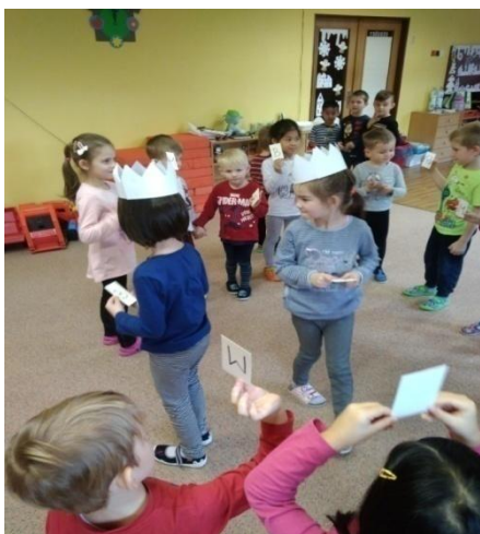
Obrázek 21. Hledání stejných písmenek