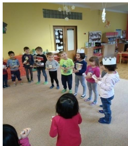
Obrázek 22. Tvoření trojic