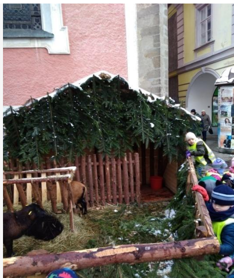
Obrázek 14. Živý Betlém

Nakresli obrázek z vycházky – vymýšlení vlastních námětů. Děti ve školce dostaly za úkol nakreslit obrázek z vycházky, co se jim nejvíce líbilo.