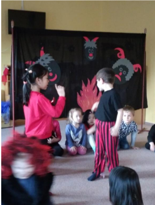
Obrázek 8. Tancovalo pět čertů