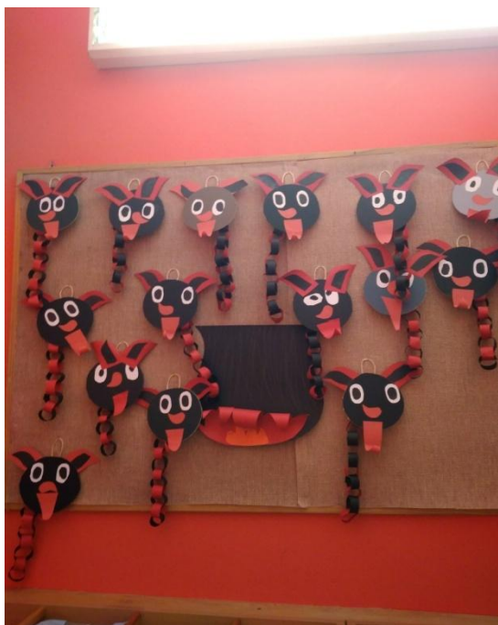
Obrázek 11. Výstava vyrobených čertů