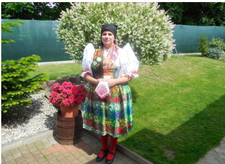
Obrázek 3. Sváteční kroj, Draženov, r. 2015.

Pokud se rodiče dětí oblékají na slavnosti do krojů, je to ta nejlepší cesta k předávání tradic. Na druhém obrázku je takzvaný lehký kroj, který byl vhodný pro běžné nošení. Není tak slavnostní, jako kroj těžký . Ale přesto ho dnešní soubory stále používají. Kroj se dá různě kombinovat. Při vystoupení souboru mají dívky na hlavě červený šátek s tištěným vzorem.