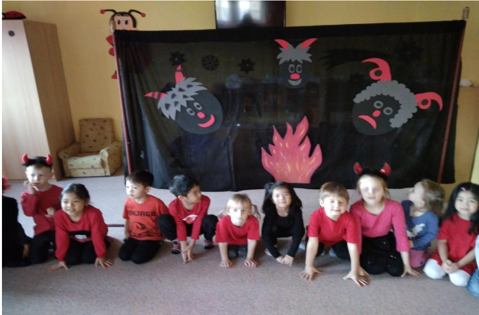
Obrázek 12. Peklo