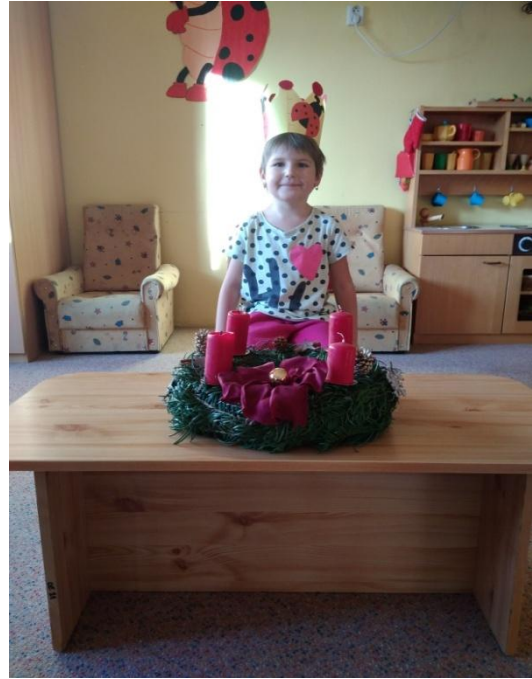
Obrázek 10. Adventní věnec