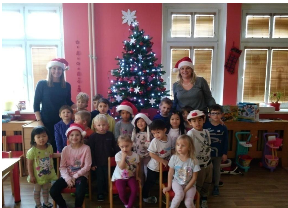
Obrázek 20. Vánoční nadílka

Kdo má v dlani stříbrný oříšek – oříšek obalený ve stříbrném staniolu, kdo ho má na Štědrý večer v dlani, přeje si nějaké přání a určitě se mu přání splní. Děti sedí v kruhu těsně vedle sebe a v klíně sepjaté dlaně. Hadač jde za dveře a druhé dítě má v dlani oříšek, schovaný, aby ho nikdo neviděl. Uvnitř kruhu obchází jedno dítě po druhém, své sepjaté dlaně s oříškem vkládá do dlaní všech dětí a pouze jednomu dítěti nepozorovaně vpustí oříšek do dlaní, poté pokračuje dál, jakoby nic. Děti společně zavolají hadače a ten má za úkol uhádnout, kdo skrývá oříšek v dlani. Když uhodne, vezme si oříšek do dlaní a může si něco přát.