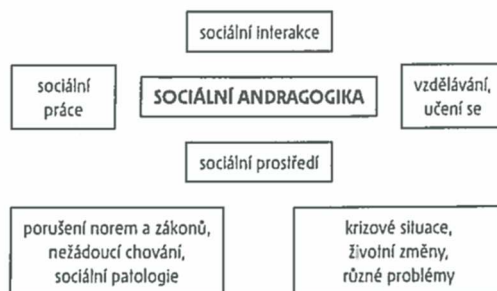
Schéma 3.1 Sociální andragogika jako průnik praxe sociální práce a teorie vzdělávání dospělých