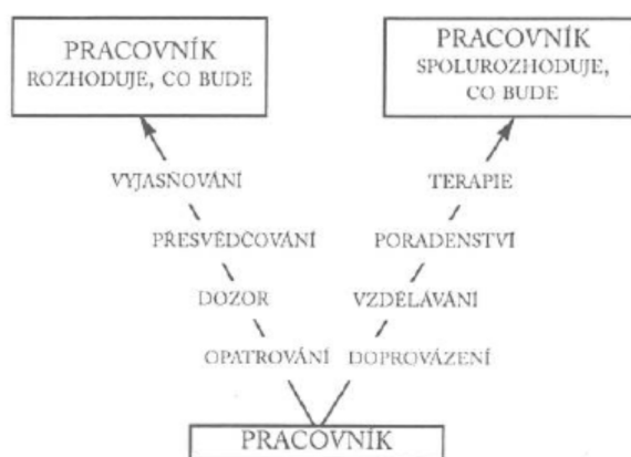
Obrázek 4: Profesionální způsoby práce