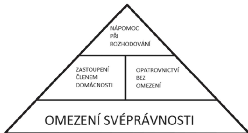
Obrázek 1: Schematické znázornění podpůrných opatření při narušení schopnosti zletilého člověka právně jednat