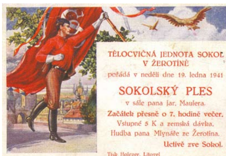
Příloha č. 5. Pozvánka na sokolský ples z roku 1941