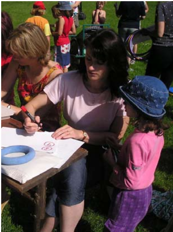
Příloha č. 32. Organizace sokolského dětského dne