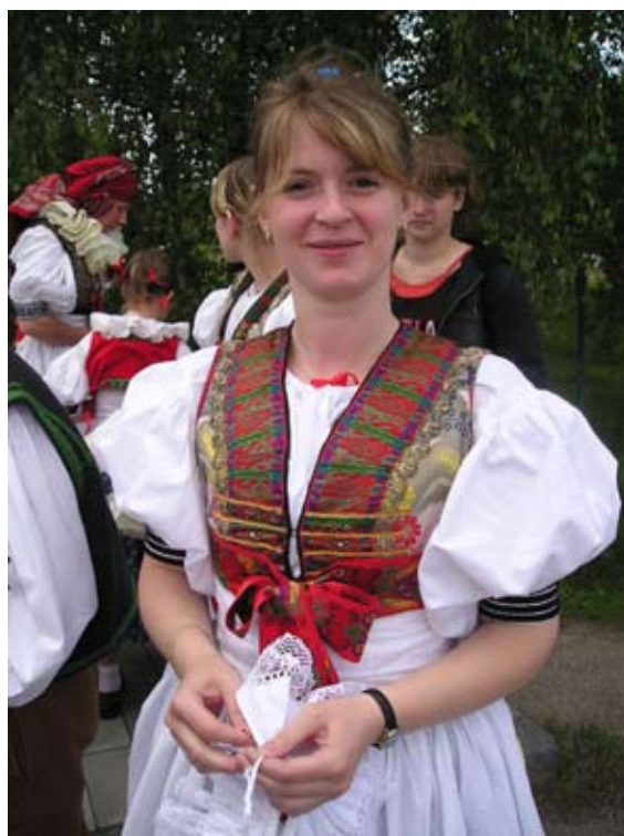
Příloha č. 14. Sokol stále udržuje národní tradice