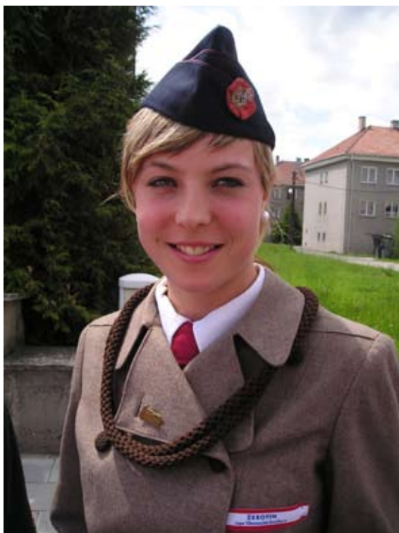
Příloha č.11. Ženský sokolský kroj