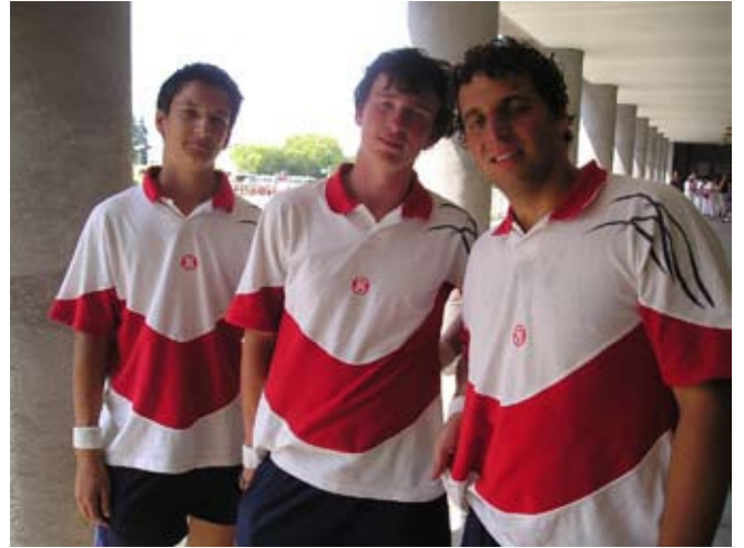
Příloha č. 26. Sokolský dorost