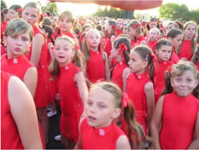
Příloha č. 25. Sokolské mládí