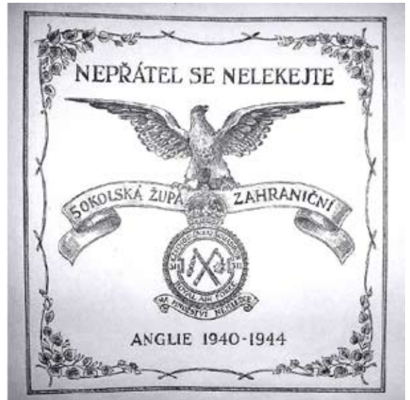
Příloha č. 7. Sokol ve válečné Anglii