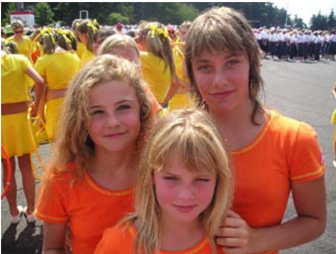
Příloha č. 27. Sokolské cvičenky