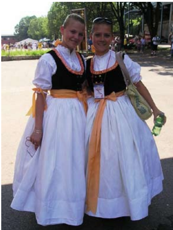
Příloha č. 15. Sokolské folklorní soubory – ukázka kroje