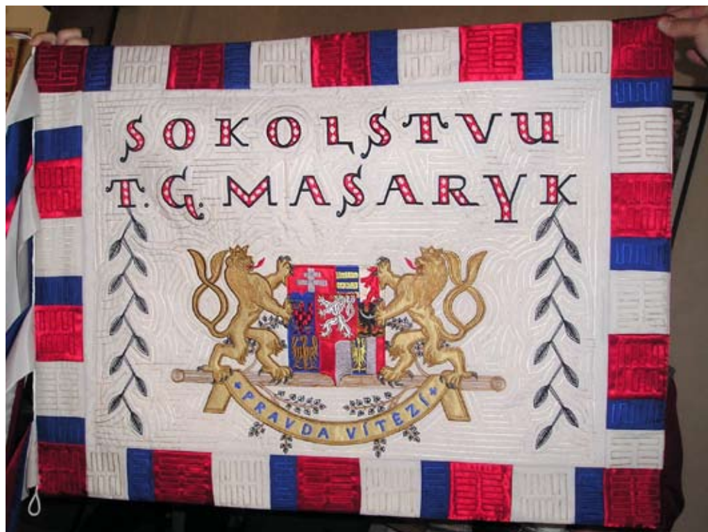
Příloha č. 9. Prapor věnovaný sokolstvu TGM