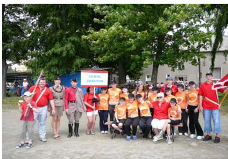
Příloha č. 38. Sokol Žerotín dnes