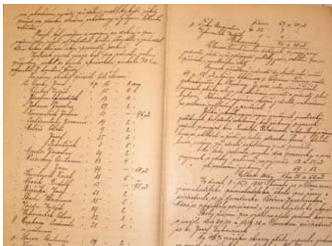
Příloha č. 4. Členové a příznivci Sokola darovali části svých pozemků na výstavbu sokolovny