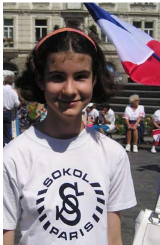
Příloha č. 21. Sokol ve Francii