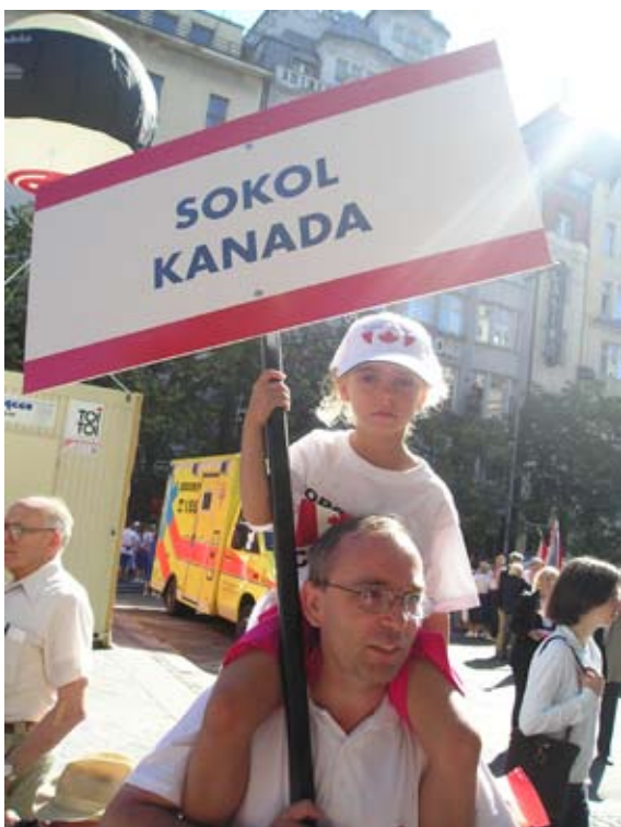
Příloha č. 17. Sokol v Kanadě