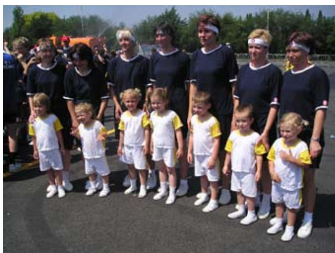
Příloha č. 23. Sokolská všestrannost – rodiče a děti