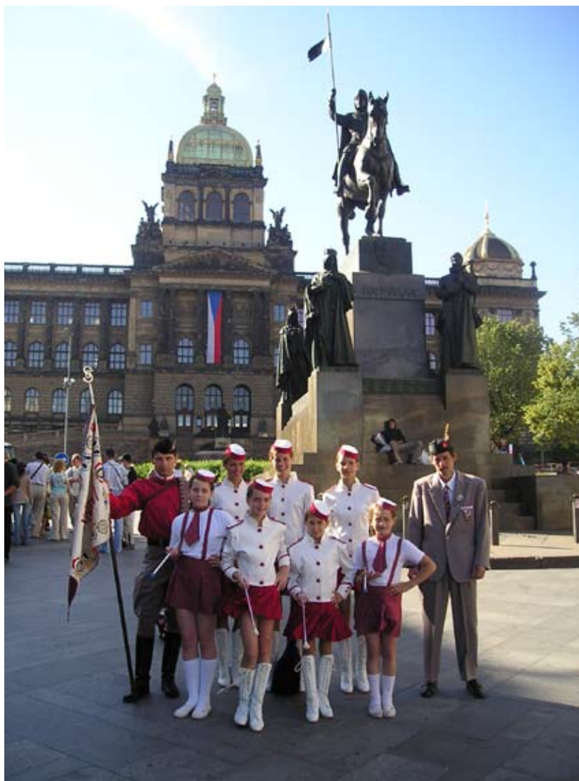
Příloha č. 30. Sokolské slavnosti