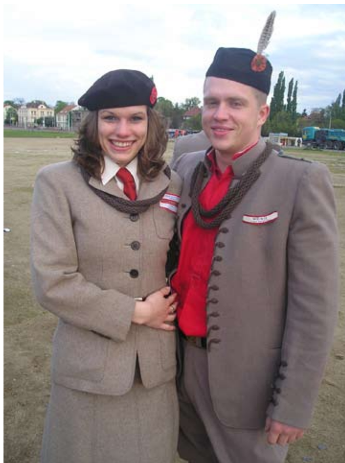
Příloha č. 10. Oslavy 60. výročí osvobození v Praze