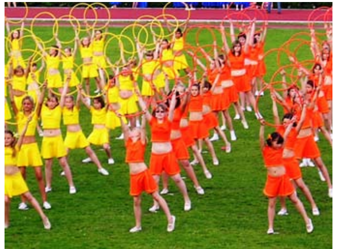
Příloha č. 28. Cvičení