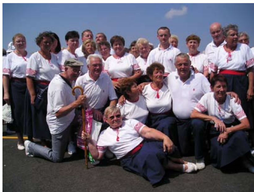
Příloha č. 29. Sokolská Věrná garda