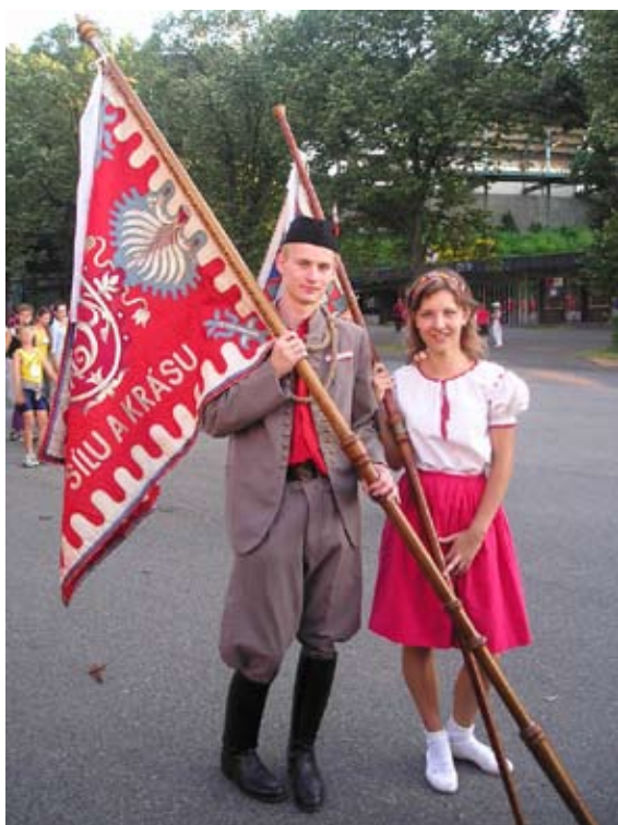
Příloha č. 13. Divčí sokolský kroj