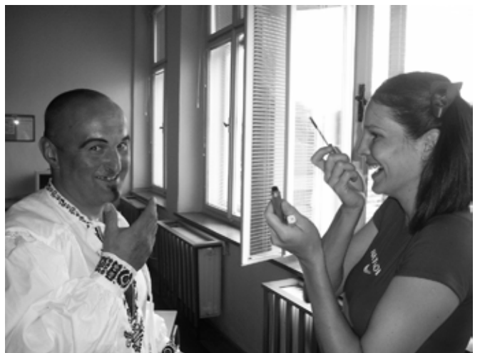
Příloha č. 35. Sokolský smysl pro humor