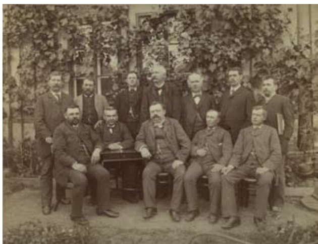
Příloha č. 1. Rolnicko-čtenářská beseda Žerotín 1886. Její členové později založili Sokol Žerotín