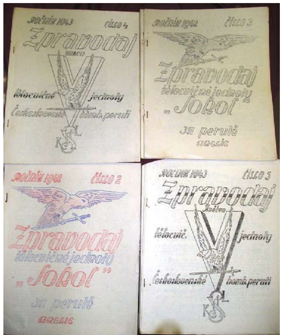
Příloha č. 8. Ukázka válečných sokolských zpravodajů