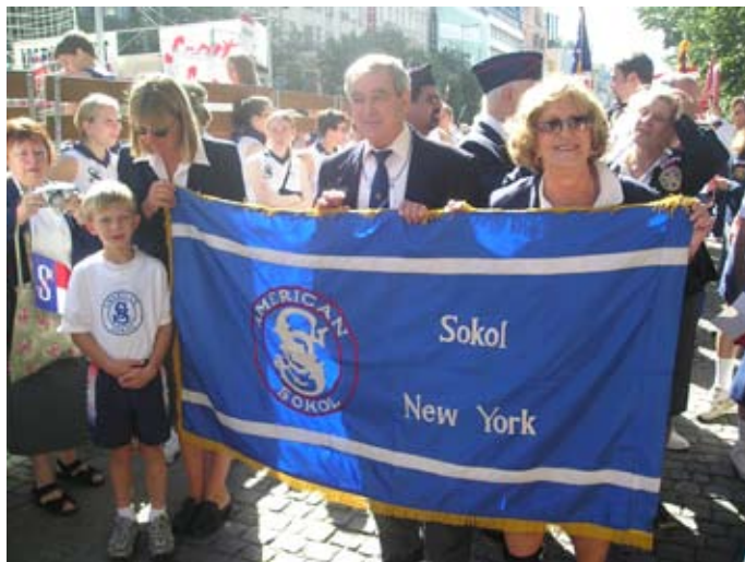
Příloha č. 16. Sokol v Americe