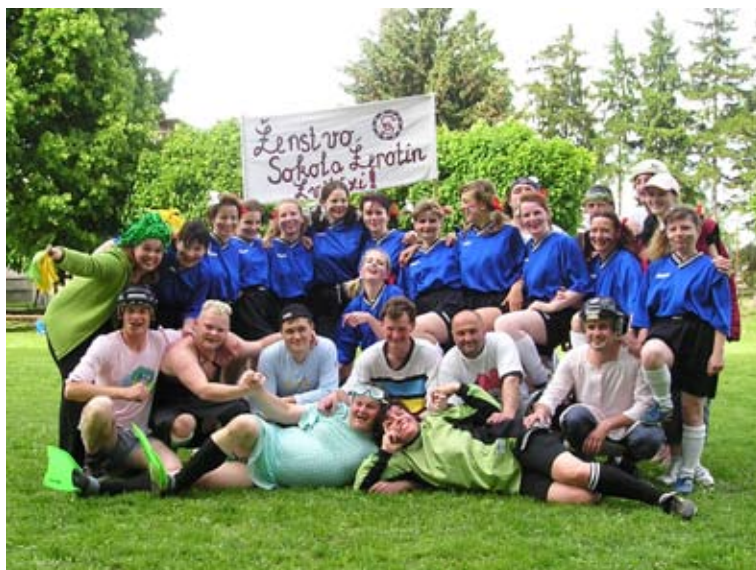
Příloha č. 36. Sokolské sportování