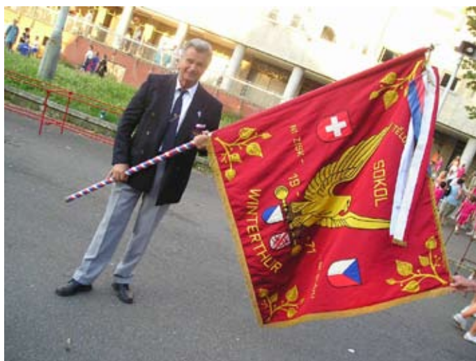
Příloha č. 19. Sokol ve Švýcarsku