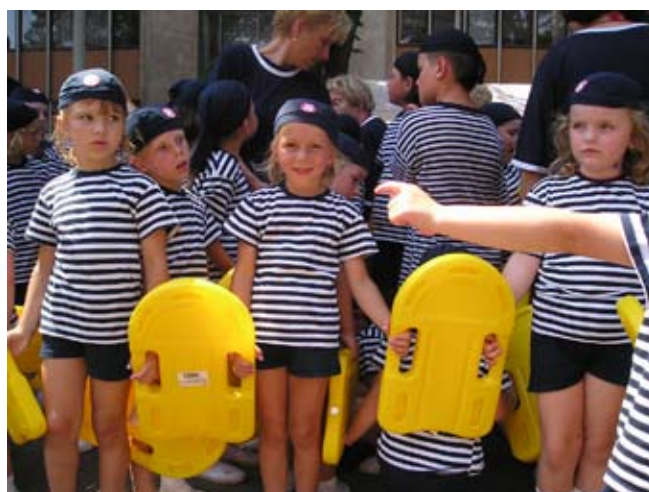
Příloha č. 24. Sokolská všestrannost – piráti