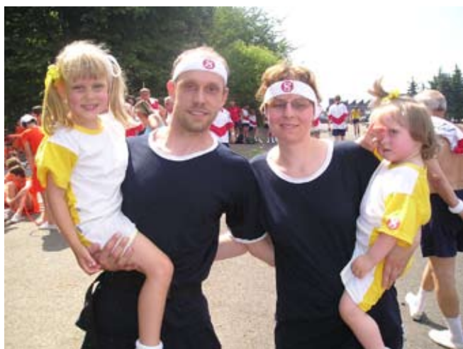
Příloha č. 22. Rodina