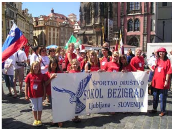
Příloha č. 20. Sokol ve Slovinsku