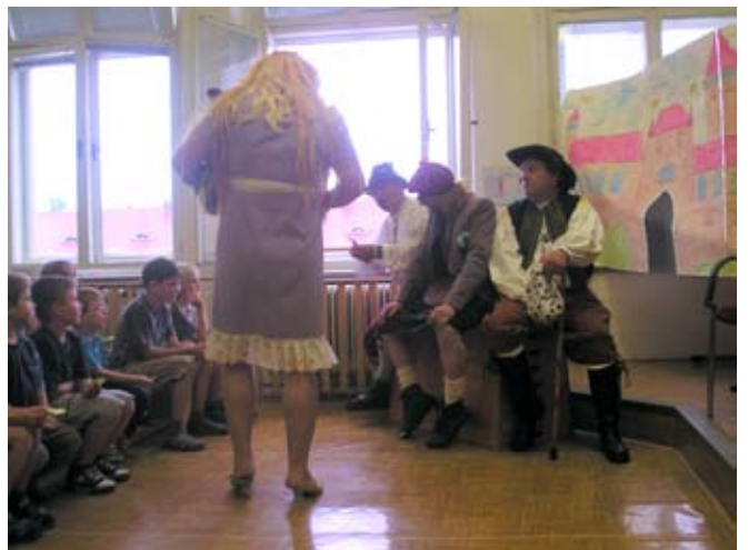
Příloha č. 34. Sokolské ochotnické divadlo v Žerotíně