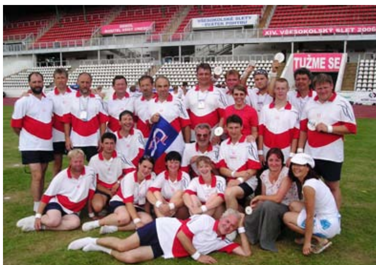
Příloha č. 37. Sokol Žerotín a Sokol Hnojice na XIV. všesokolském sletu v Praze na Strahově