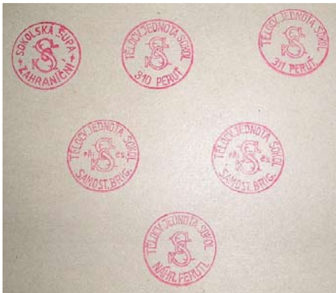
Příloha č. 6. Razítka některých sokolských jednot vytvořených v čs. zahraniční armádě za 2. svět. války