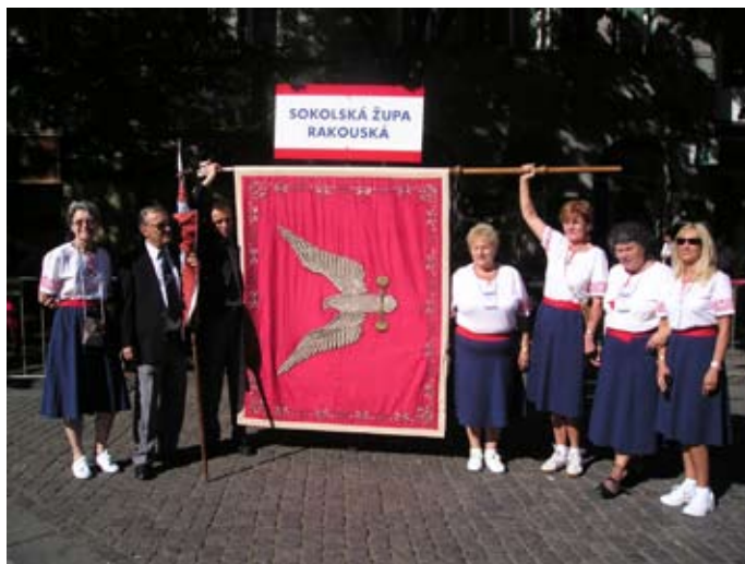
Příloha č. 18. Sokol v Rakousku