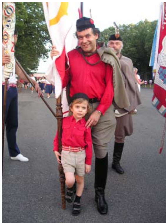
Příloha č. 12. Mužský a žákovský sokolský kroj