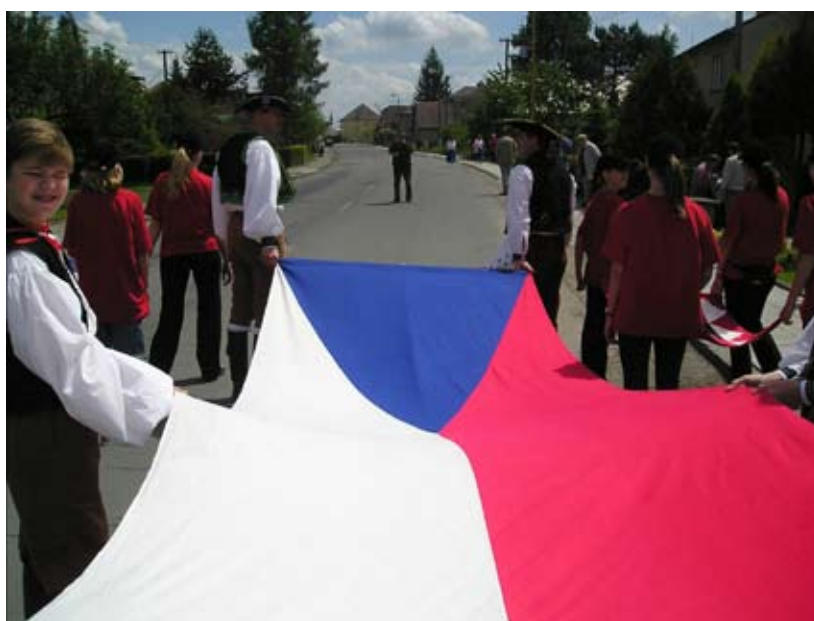
Příloha č. 31. Sokolský průvod