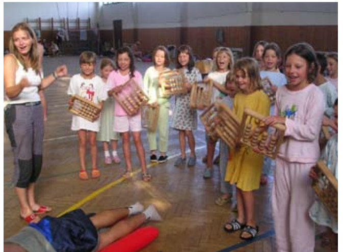
Příloha č. 33. Sokolský budíček