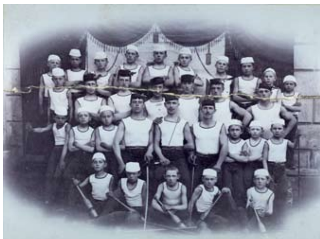
Příloha č. 2. Tělocvičná jednota Sokol Žerotín 1899