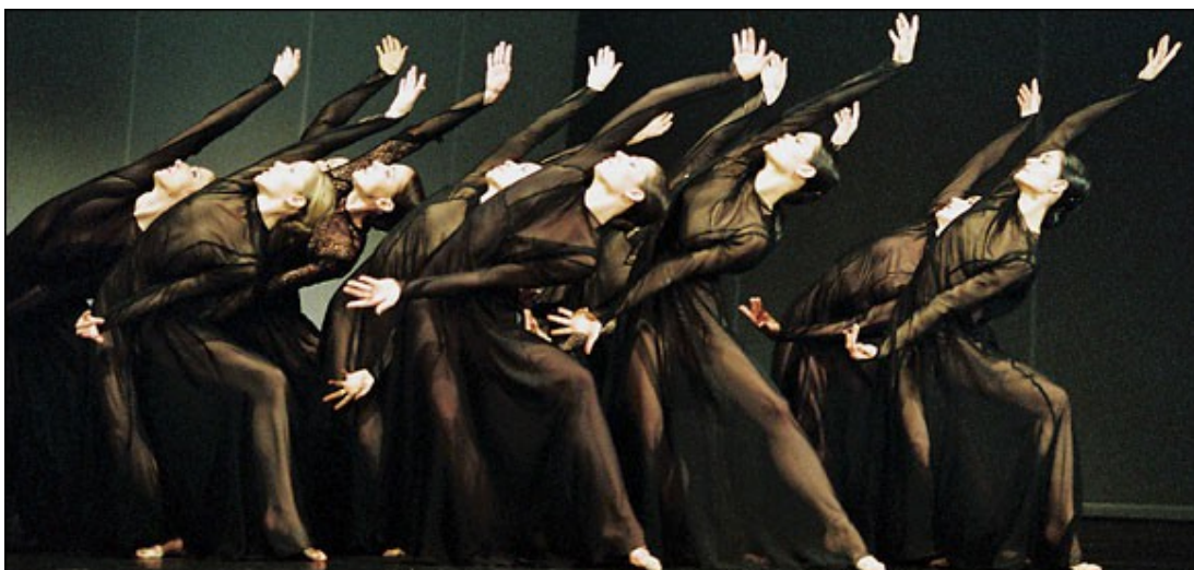
Obr.3. Pina Bausch

Tato citace upozorňuje i na problém který se vyskytuje při výuce rytmu u neslyšících. Neslyšící mají často problém s pochopením abstraktních nekonkrétních věcí a proto je potřeba jim rytmus přiblížit a zkonkretizovat nejlépe cestou vizuální.