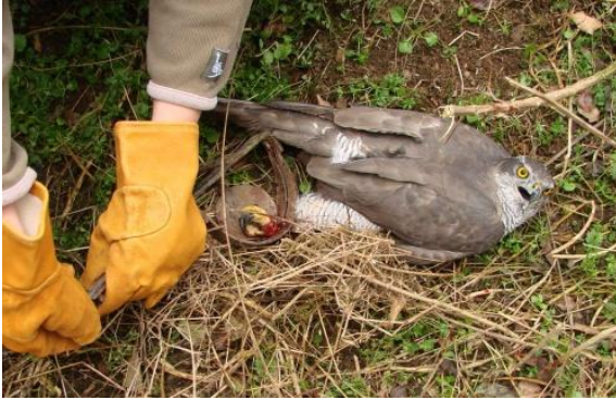
Obrázek 4 – Jestřáb v pasti