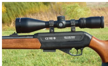
Obrázek 8 – CZ512