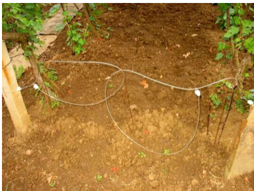
Obrázek 1 – Nastražené oko

Charakteristickou pastí užívanou při páchání pytláctví jsou oka. Jedná se o jednoduchou past, která je opatřena zdrhovací smyčkou a je umístěna na vhodné místo. V minulosti bylo oko vyráběné z různých materiálů od provazů, kožených řemínků až po různá rostlinná vlákna. S postupem času se začal jako materiál používat drát a různé struny. Tato past nevyžaduje přítomnost lovce, ale vyžaduje dobrou znalost zvyklostí zvěře např. ochozy nebo způsob pohybu. Oka se používala k lovu ptáků nebo savců. Oko pytlák umístil většinou do ochozů, kudy zvěř prochází a v daném místě je vlivem porostu nucená sehnout hlavu. Taková past se nechala kombinovat s napruženým kmínkem, který svým vypružením zvěř snáze zachytil a vyzvedl do výšky. Takto chycená zvěř se uškrtila.