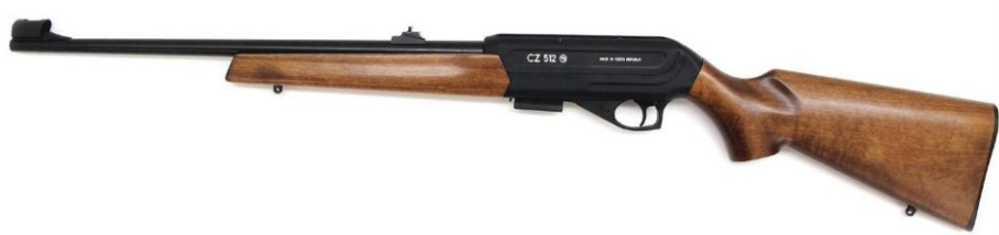
Obrázek 6 – CZ512