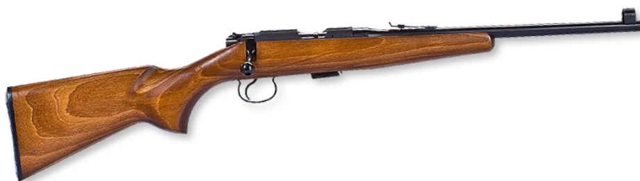
Obrázek 9 - CZ ZKM 452 ráže 17HMR