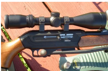
Obrázek 7 – CZ512