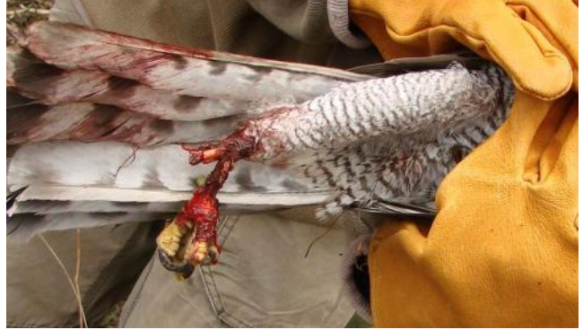
Obrázek 5 – poranění jestřába od želez

Mohl bych pokračovat do nekonečna, protože důmyslnost a zručnost pytlákům rozhodně nechybí a jsou schopni neustále vymýšlet nové systémy. Jako poslední způsob neoprávněného lovu zvěře a rozhodně nejrozšířenější je lov střelnou, ale i tichou chladnou zbraní. Za chladné tiché zbraně jsou považovány zejména různé luky, kuše a samostříly. Tyto zbraně jsou dnes k dostání v různých obchodech, kde je možno na ně zakoupit i zaměřovací zařízení. Zbraně jsou to velice účinné, co se týká dostřelu i na větší vzdálenosti. Zasažená zvěř šípem z takové zbraně v mnoha případech pouze zraněná. V případě těchto poranění dochází k trápení a mnohdy až k úplnému vyčerpání, které končí smrtí. Chladné zbraně užívají pytláci z důvodu tichého výstřelu a v případě nalezení střely (šípů) nemožnou balistickou expertízu. Další druh zbraní, které pytláci používají, jsou palné zbraně. Jsou využívány buď upravené nebo originální od výrobce, legálně či nelegálně držené. Jedny z nejčastěji používaných zbraní jsou malorážkové zbraně a zbraně malé ráže jako např. CZ 512 nebo CZ ZKM 452 ráže 17HMR, které nezpůsobují po výstřelu velký hluk a na srnčí zvěř jsou účinné.