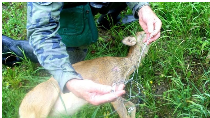
Obrázek 2 – Srna chycená do oka

Další typickou pastí, mezi pytláky rozšířenou, jsou takzvaná železa, která mnohdy zvěř neusmrtí, ale zmrzačí. K poranění dochází obvykle na končetinách