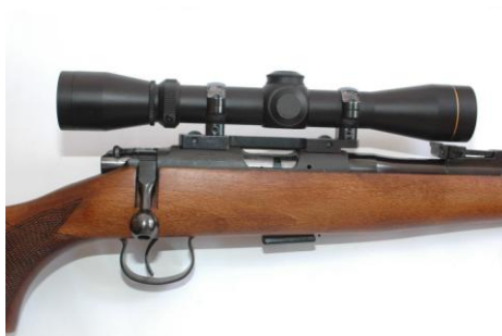
Obrázek 10 - CZ ZKM 452 ráže 17HMR