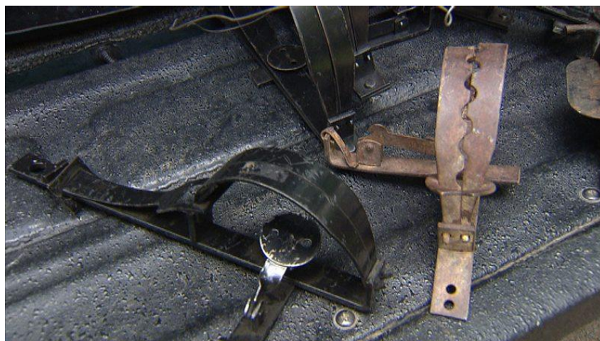
Obrázek 3 - železa

chycené zvěře. Železa různých tvarů a provedení lze koupit v některých železářstvích. Oficiálně se prodávají jako pasti na odchyt potkanů. Zruční pytláci si takové pasti vyrobí doma sami. Takové pasti dokáží chytit nejen drobnější zvěř, ale i statné kusy. V mnohých případech dokáží zmrzačit i člověka, který se bez cizí pomoci ze želez nedostane. Železa pachatelé nejčastěji pokládají na vyšlapané stezky a ochozy zvěře, kde je maskují a uchytí pomocí řetězu, většinou ke stromu. Jak už jsem zmínil, železa nejsou nebezpečná nejen pro zvěř, ale zejména i pro člověka nebo psa. V mnoha případech dochází k amputaci končetin. Jsou i případy, kdy se do želez doplněné vnadidlem chytily dravci jako káně, jestřáb a další. Bohužel tyto pasti nelíčí pouze pytláci, ale i majitele hospodářských usedlostí, kteří se snaží tímto způsobem chytat kuny a jiné škůdce. Jako další pasti bych mohl jmenovat různé sklápěcí pasti, pasti opatřené padacími dvířky, sklopce apod.