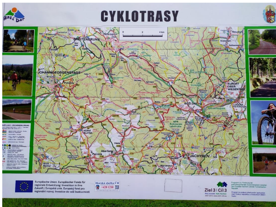
Obrázek 12 Cyklotrasy Krušné hory