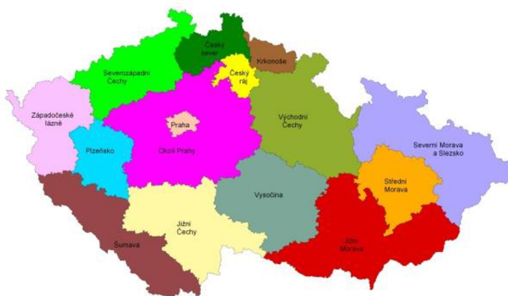
Turistické regiony České republiky