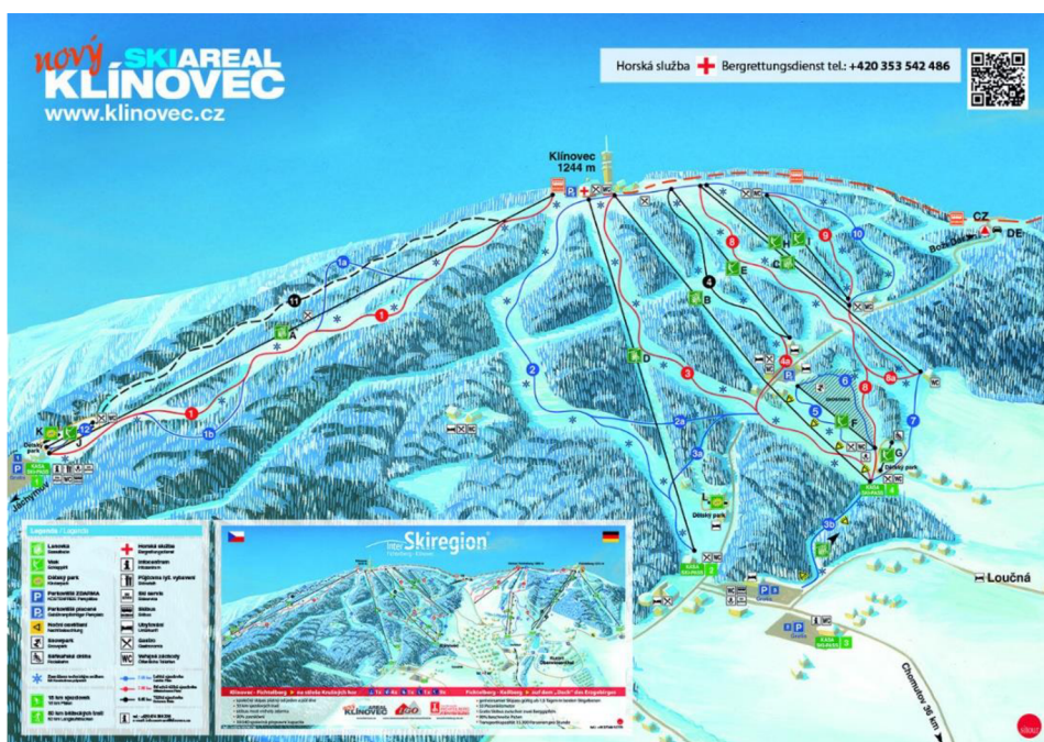
Obrázek 7 Mapa Ski Areálu Klínovec

Skiareál Klínovec nabízí v současné době 32 sjezdových tratí v celkové délce 31,5 km třech obtížností a to modrou, která je vhodná pro začátečníky, červenou pro rekreační lyžaře a černou, která je určena pro výborné lyžaře. Pro přepravu lyžařů je využíváno 5 lanových drah, 11 vleků a 5 lyžařských pasů pro děti. Areál se může pyšnit nejdelší a zároveň nejnovější spojovací sjezdovou tratí Rondo, která umožňuje lyžařům přepravu z vrcholu Klínovce na Neklid a měří 5 200 m (klinovec.cz, 2021).