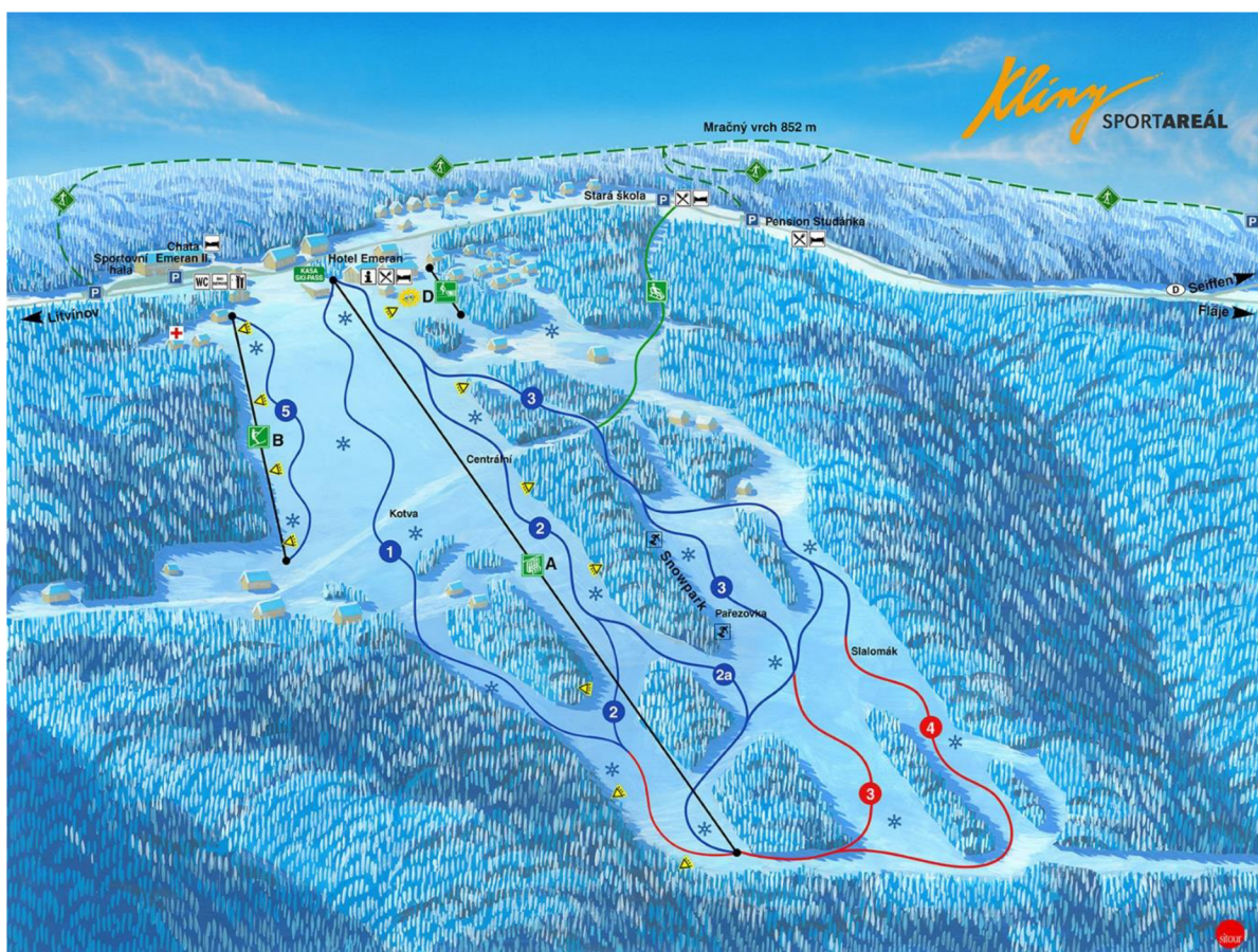
Obrázek 9 Sportareál Klíny