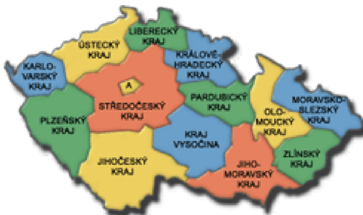
Obrázek 3 Kraje České republiky