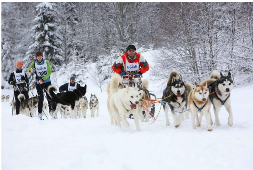
Obrázek 11 Psí spřežení

Psí spřežení neboli musherství lze vyzkoušet ve Sportovním areálu Eduard, který se nachází mezi Neklidem a Božím Darem. Návštěvníka zprvu čeká seznámení se s fascinujícím plemenem Husky, následuje jejich krmení, postrojení a zapřažení. Poté je návštěvník obeznámen technikou jízdy a základními povely. Po dokončení vyjíždky je nutné odstrojit čtyřnohého sportovce, vypřáhnout a dát pamlsk za odvedenou jízdu. Celý program trvá něco málo přes hodinu, samotná jízda pak se psím spřežením zhruba dvacet až čtyřicet minut. Tento program stojí 2 300 Kč, pokud ovšem ale chcete zažít pořádný adrenalin, je možnost se stát musherem na saních za 3 200 Kč. Sportovní centrum Eduard nabízí mimo jiné i Skijoring, což je jízda na běžecích lyžích s jedním nebo dvěma psy. Hodina tohoto zážitku vyjde na 1 500 Kč (zivykraj.cz, 2021).