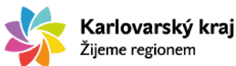
Obrázek 5 Logo DA Živý kraj

V Krušných horách jsou v provozu dvě destinační agentury, které mají za úkol propagovat a zvyšovat kvalitu území z hlediska cestovního ruchu. Karlovarskému kraji se věnuje destinační agentura Živý kraj , která byla založena v roce 2016. Cílem DA Živý kraj je propagace kraje jako exkluzivní turistickou destinaci. DA chce svou činností prezentovat širokou nabídku atraktivit regionu a zvyšovat tak zájem návštěvníků o turistické produkty. Hlavní náplň práce destinační agentury spočívá zejména v obstarání marketingu pro Karlovarský kraj, organizace různých veletrhů, výstav, fam a pres stripů, účast na veletrzích CR v tuzemsku i zahraničí, zajištění propagačních materiálů atd. DA Živý kraj spolupracuje s Ministerstvem místního rozvoje ČR a s agenturou CzechTourism (zivykraj.cz, 2021). Na území Ústeckého kraje má stejný úkol destinační agentura Krušné hory. Turistický webový portál Ústeckého kraje zahrnuje destinační oblasti České Švýcarsko, České středohoří, Dolní Poohří a Krušné hory, tvoří projekt s názvem Brána do Čech (branadocech.cz, 2021).