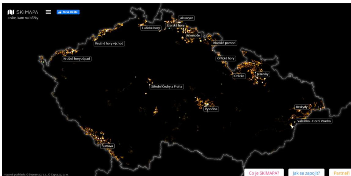
Obrázek 14 Skimapa pro běžkaře