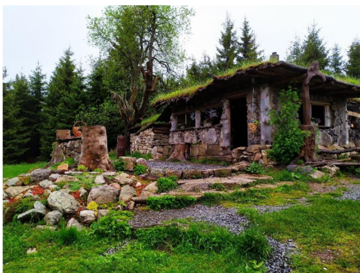
Obrázek 10 Červené jámy

Krušnohorská lyžařská magistrála vede po hřebeni Krušných hor a je jejich páteří trasou v délce 41 km. Vede přes krušnohorská střediska: Bublavu, Rolavu, Jelení, Pernink, Hřebečnou až po Boží Dar. Magistrála je v zimě pravidelně udržována zimní technikou (rolba, skútr) a napojit se na ní mohou běžkaři z Abertam, Horní Blatné, Nových Hamrů a dalších přilehlých míst. Běžkaře zcela jistě potěší občerstvení podél magistrály, a to buď v obcích okolo kterých vede trasa nebo přímo u běžkařské stopy na Červených jámách, Hřebečné či na Jelení. V létě je Krušnohorská magistrála vhodná pro pěší turistiku a cykloturistiku ( krusnehoryaktivne.cz )