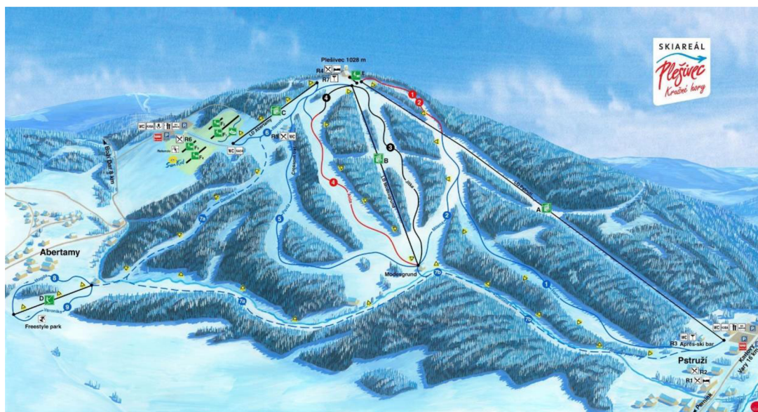
Obrázek 8 Skiareál Plešivec

Areál Plešivec nabízí celkem 9 upravovaných sjezdovek v délce 15 km se třemi lanovými dráhami, které jsou čtyřsedačkové. Pro snowboardisty je tu k dispozici Freestyle park. Nejenže se areál pyšní svými nejmodernějšími technologiemi, ale nabízí svým návštěvníkům také nejdelší černou sjezdovku na Karlovarsku. Pro děti je k dispozici dětský park, který nabízí pohyblivý pás a dětský vlek. Součástí je také skiservis, půjčovna lyží, lyžařská škola a dvě parkoviště, která jsou zdarma (skiarealplesivec.com).