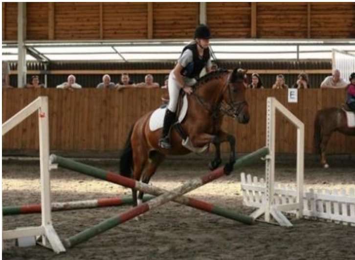
Obr. 8: Ukázka skoku přes překážku v hřebčíně Suchá