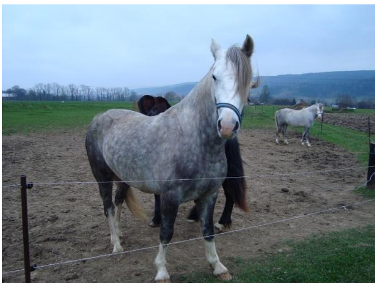
Obr. 12: Velšský pony ve volném výběhu v hřebčíně Karlen