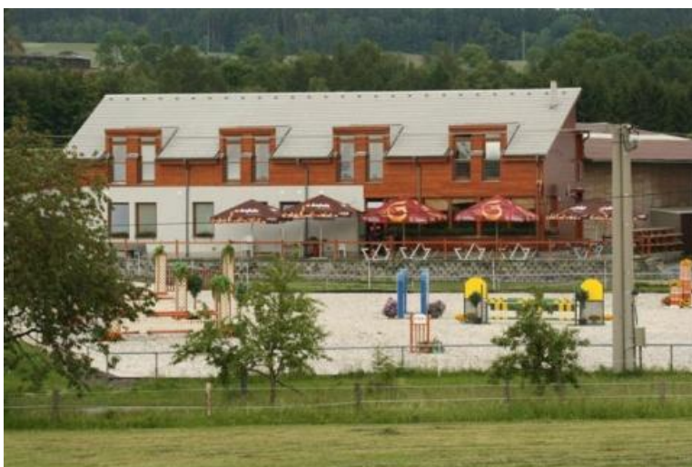
Obr. 3: Penzion Suchá s letní terasou a parkurem

Součástí stáje Manon je penzion Jízdárna Suchá. Je umístěn v klidném prostředí uprostřed krásné přírody s mírně kopcovitým terénem, rozlehlými loukami a hustými lesy. Má výhodnou polohu, nalézá se nedaleko obce Suchá, která leží pouhé 3 km od Litomyšle, města proslaveného Bedřichem Smetanou, Klášterními zahradami a zámekem zapsaným na Seznamu světového dědictví Unesco. Do dalšího většího města, České Třebové, je to necelých 10 km. Česká Třebová je městem kultury a především sportu. Jsou zde značené turistické a cyklistické trasy, krytý plavecký bazén, sportovní haly a sportoviště. Pro milovníky zimních sportů je vhodný ski areál Peklák, zimní stadión a značené běžecké trasy.