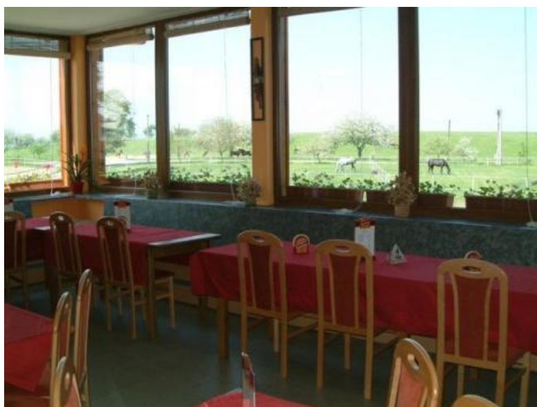
Obr. 5: Restaurace Suchá s možností pozorování koní (zdroj: www.stajmanon.cz )