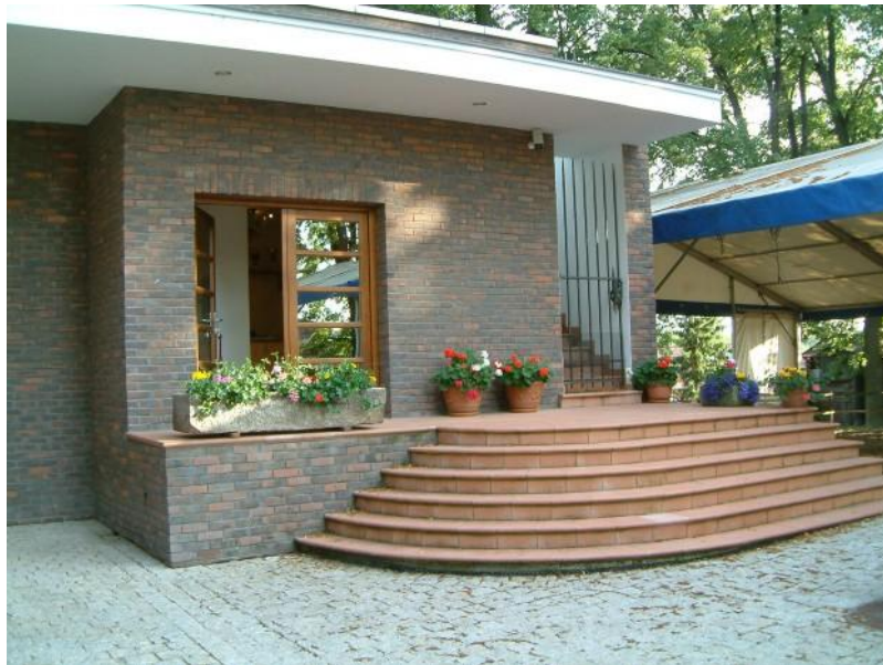
Obr. 1: Stáj Manon, Litomyšl - administrativní budova