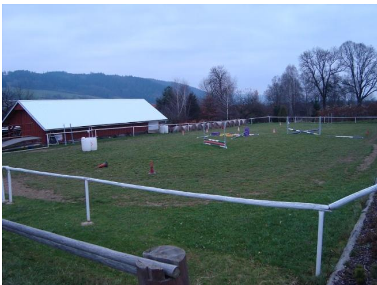
Obr. 10: Venkovní kolbiště s parkurem v hřebčíně Karlen

Konkurence z ostatních koňských farem v okolí se majitelé nebojí díky své úzké specializaci na zmíněné plemeno, které v okolí žádná farma nechová. Návštěvníky farmy tvoří klienti, kteří mají v hřebčíně ustájeny své koně, rodiny s dětmi, účastníci kurzů výcviku jízdy na koni, zájmové skupiny (skautské oddíly, školy, mateřské školy). Největší skupinu však tvoří rodiny s dětmi.