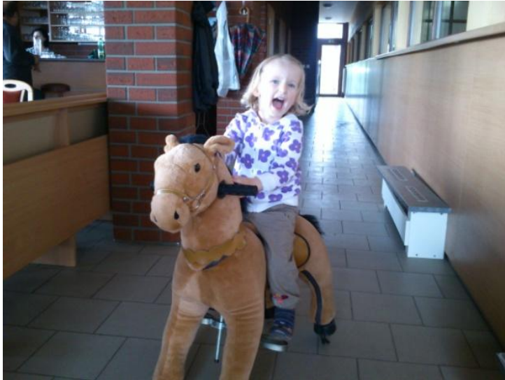
Obr. 7: Atrakce pro děti k zapůjčení v restauraci Suchá