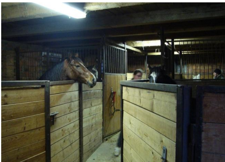
Obr. 11: Pohled do staré stáje v hřebčíně Karlen