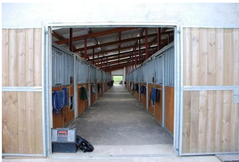
Obr. 4: Pohled do stáje Suchá

Penzion Jízdárna Suchá je moderním jezdeckým areálem vybaveným penzionem, restaurací s letní terasou, parkovištěm, stájemi, krytou jízdárnou, venkovní pískovou jízdárnou s rozměry 25 x 60 m se skokovým materiálem, venkovním kolbištěm 60 x 70 m s moderním pískovým povrchem s geotextilií a stálým tréninkovým parkurem. Součástí areálu je i moderní krytá jezdecké hala 23 x 60 m s osvětlením, kvalitním povrchem a skokovým materiálem. Pro děti je v restauraci za poplatek umožněna jízda na plyšových koních a před restaurací je umístěno vyhrazené místo pro dětský parkur, který je zdarma.