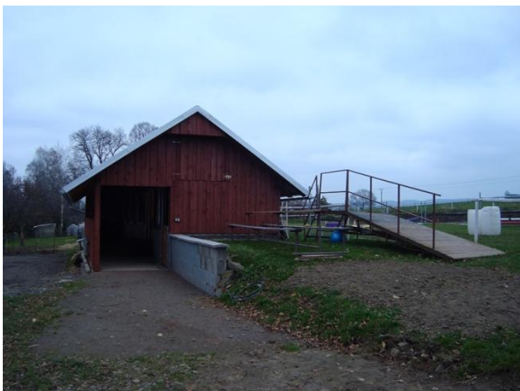
Obr. 9: Nová stáj v hřebčíně Karlen

Konkurence z ostatních koňských farem v okolí se majitelé nebojí díky své úzké specializaci na zmíněné plemeno, které v okolí žádná farma nechová. Návštěvníky farmy tvoří klienti, kteří mají v hřebčíně ustájeny své koně, rodiny s dětmi, účastníci kurzů výcviku jízdy na koni, zájmové skupiny (skautské oddíly, školy, mateřské školy). Největší skupinu však tvoří rodiny s dětmi.