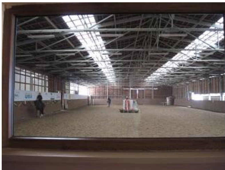
Obr. 6: Krytá jezdecká hala v Suché - průhled z restaurace

Hlavní činností Jezdeckého klubu Hřebčín Suchá je organizace a účast na jezdeckých akcích, jezdecká škola pro děti a mládež, pořádání víkendových či dlouhodobějších pobytů a stále více vyhledávanějších jezdeckých prázdninových kurzů. Jezdecký klub pořádá každoročně velké množství jezdeckých akcí - například série veřejných tréninků, jezdecké závody, Jezdecké hry, drezurní veřejné tréninky a dětské šampionáty. V roce 2012 zde úspěšně proběhla i Velká cena Litomyšle. Pro děti pravidelně organizuje Mikulášský rej v maskách a Mikulášskou besídku. Koncem roku se koná tradiční Jezdecká akademie, kde se v krátkých ukázkách představují žáci Jezdecké školy. O letních prázdninách se klub věnuje především týdenním jezdeckým kurzům pro děti. Kurzy jsou zaměřeny na intenzivní výuku jízdy na koni pro začínající i pokročilé jezdce a na předávání teoretických znalostí.