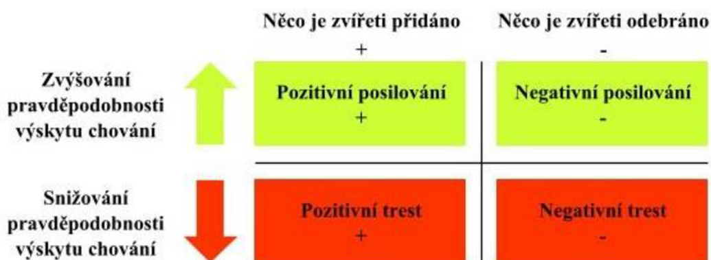
Obr. 2 – Schéma čtyř kategorií reakce Vlastní zpracování

Oba dva typy posílení mají za následek pravděpodobnější opakování chování v budoucnu, na rozdíl od použití obou typů trestů, které způsobují že výskyt chování bude v budoucnu méně pravděpodobný. Pozitivní a negativní posilování vyvolává výrazné emocionální reakce u psů, které mohou mít dlouhodobé účinky na chování. Zvýšená pozornost psovoda je dostatečně silným posilovačem, a naopak odepření pozornosti je pro psy silným trestem. Pokud psovod nalezne optimální rovnováhu mezi těmito posilovači, zajistí si nejlepší cestu k úpravě chování (Jensen 2007).