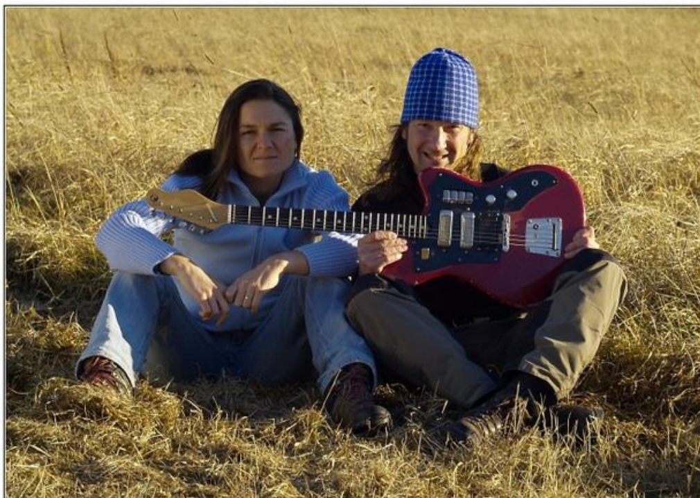
6strun listopad 2011