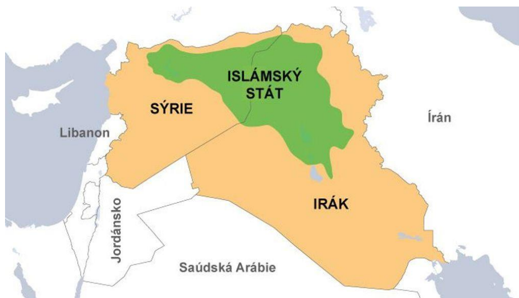
Obrázek 2: mapa Islámského státu