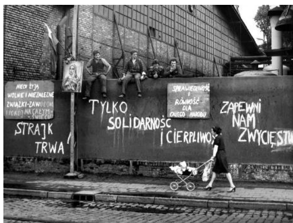
Obrázek 2: Stávka dělníků, Polsko 24

V Polsku v osmdesátých letech sílil hlas Solidarity (polsky Solidarność), což byla organizace na podporu nezávislých odborů. V jejím čele stanul elektrikář Lech Wałęsa, 22 dělník gdaňských loděnic. V roce 1980 spustily odbory stávkou, která reagovala na propuštění jedné ze zaměstnankyň. Stávka neskončila pouze vítězstvím v jednom podniku, ale rozšířila se po celém Polsku. Cílem bylo získání práva na existenci nezávislých odborů, dodržování svobody projevu, docílení náboženské svobody a zlepšení životních podmínek. Zvažovala se intervence vojsk Varšavské smlouvy, stejně jako tomu bylo v roce 1968 v Československu. Proti se postavilo Maďarsko a Rumunsko. Hnutí Solidarita bylo postaveno mimo zákon a pokračovalo v ilegality až do roku 1989. V tomto roce mohli Poláci částečně svobodně volit a Solidarita ve volbách zvítězila. 23 V roce 1990 se Lech Wałęsa stal prezidentem Polské republiky.