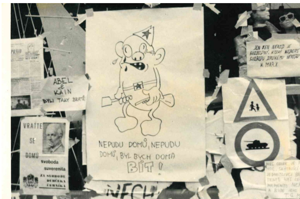
Obrázek 6: Autor neznámý, kresba sovětského vojína 42

Fotografie od neznámého autora s plakátem kresby s textem.