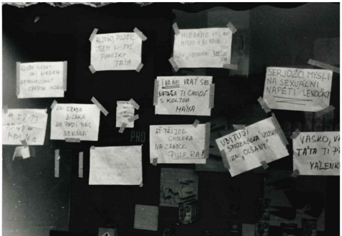
Obrázek 7: Autor neznámý, Vzkazy na výloze, soukromý archiv PhDr. Milana Bárty, Ph.D. 44

Fotograf zachycuje výlohu polepenou komunikáty. Některé jsou stylizovány jako individuální vzkazy rodičů sovětských vojnů. Opět je zde použit český jazyk namísto ruského, z toho lze odvodit, že příjemcem nemá být sovětský voják, nýbrž český občan a slouží k pobavení a vyburcování našich občanů. Předpokládám, že sověští vojáci tyto nápisy nečetli, ať už z časových nebo jazykových důvodů. Nápisy humornou formou glosují touhu obyvatel po odchodu okupačních vojsk.