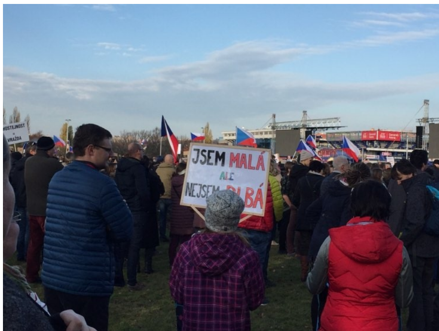
Obrázek 11: Autor Martin Vejvoda, Demonstrace na Letné, Jsem malá, ale nejsem blbá, soukromý archiv Martina Vejvody 54

Fotograf na barevné fotografii zachytil demonstrující děvčátko s transparentem: „ JSEM MALÁ, ALE NEJSEM BLBÁ “. Dá se usuzovat, že tvůrcem bude dospělý rodinný příslušník nebo se jednalo o společné dílo. Rodiče demonstrují své názory skrze své dítě. Poukazují na to, že jednání vlády je čitelné komukoliv, bez ohledu na věk a vzdělání. Efektu je dosaženo právě využitím sloganu, který prezentuje názor malého dítěte, expresivním výrazem a i tím, že transparent nese malá dívka. Transparent byl určen především pro další demonstranty, tedy lidi s podobnými názory. Zapadal do mozaiky dalších hesel, která byla na Letné k vidění. Nepředpokládám, že se autor domníval, že si ho přečte předseda vlády.