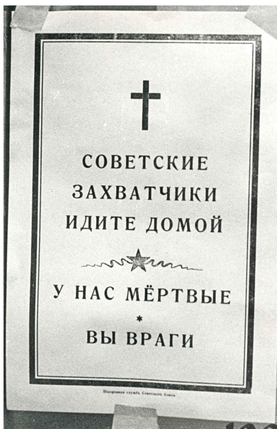
Obrázek 5: Autor neznámý, parte v ruském jazyce, soukromý archiv PhDr. Milana Bárty, Ph.D. 38

Text volně překládám do českého jazyka takto: „ Sověťští okupanti jděte domů, u nás jsou mrtví, jste nepřátelé. Pohřební služba Sovětského svazu. “ Autor se obrací konkrétně na sovětské okupanty v jejich úředním jazyce. Stylizace komunikátu je