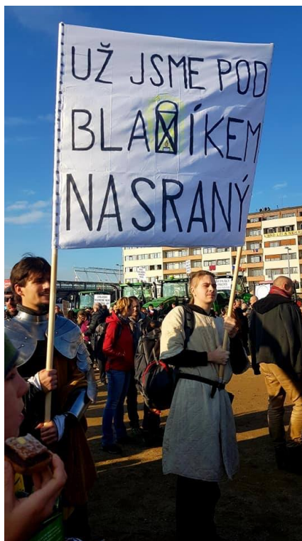
Obrázek 12: Blaniční rytíři na Letné, 55