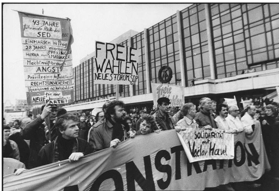
Obrázek 3: Neznámý autor, demonstrace 4. 11. 1989, NDR, Berlín 27

Na snímku je zachycena berlínská protivládní demonstrace v listopadu 1989. Demonstranti na svých transparentech požadují svobodné volby. Na jednom z transparentů vidíme nápis SOLIDARITA s Václavem Havlem (přeloženo do češtiny z německého Solidarität mit Václav Havel). Vzhledem k tomu, že fotografie byla pořízena 4. listopadu a Václav Havel byl v tomto okamžiku disidentem, je zřejmé, že měl své podporovatele i v německém disentu, přestože jeho osoba ještě nebyla z médií masově známá. K odstoupení vlády v Německé demokratické republice došlo 7. listopadu 1989.