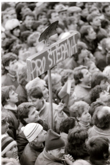
Obrázek 8: Autor neznámý, Letenská pláň – Pro Štěpána 46

Fotografie z prosincové demonstrace v roce 1989 na Letenské pláni zachycuje komunikát, který je zacílen na konkrétní osobu Miroslava Štěpána. 47 Miroslav Štěpán byl negativní postavou nejen sametové revoluce. Občané posílají vedoucího funkcionáře tzv. k lopatě. Jeho promluvy k dělníkům nebyly přijaty pozitivně, viz jeho vystoupení před dělníky v ČKD 23. listopadu 1989. 48 Ve svém projevu zmínil, že v žádné zemi nemohou patnáctileté děti určovat, kdy odejde prezident a kdo se jím má stát. Masa dělníků začala hromadně skandovat: „ Nejsme děti! “ Toto heslo se dostalo do širšího povědomí a stalo se jedním z nezapomenutelných, a to nejen pro účastníky