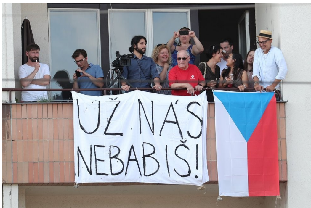
Obrázek 14: Letná, NEBABIŠ, zdroj Blesk 59

Tato fotografie byla také pořízena na Letné v roce 2019. Na balkóně jednoho z domů je umístěn transparent s heslem: „UŽ NÁS NEBABIŠ!“ Jedná se o vtipné využití jména premiéra, namísto slova „nebavíš“ je použit výraz „nebabiš“ (paronymum). Tento výraz