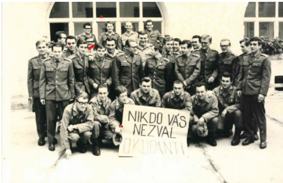
Obrázek 4: Autor neznámý, ozbrojené složky, srpen 1968 33

Fotografie od neznámého autora vznikla v období těsně po okupaci ČSSR, tedy koncem srpna 1968. Jedná se o příslušníky ČSLA.