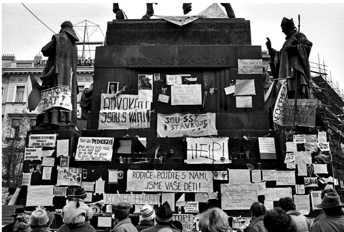
Obrázek 9: Autor neznámý, Václavské náměstí, listopad 1989, zdroj ČTK 49

Z tohoto snímku jsem zvolila transparent: „ RODIČE POJĎTE S NÁMI, JSME VAŠE DĚTI! “ Jako pamětnice sametové revoluce zde mohu využít své prožitky z daného