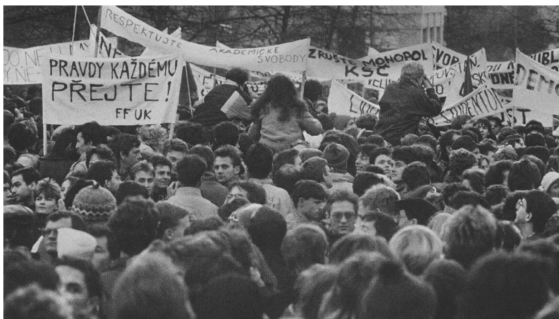
Obrázek 10: Albertov, studentská demonstrace, 50

Na tomto snímku je zachycena demonstrace studentů v listopadu 1989. Věnujme pozornost transparentu: „PRAVDY KAŽDÉMU PŘEJTE! FF UK“. Autoři jsou studenti Filozofické fakulty Univerzity Karlovy. Vidíme zde odkaz na Jana Husa a jeho citát: „ Také prosím, abyste se milovali, dobrých násilím tlačití nedali a pravdy každému