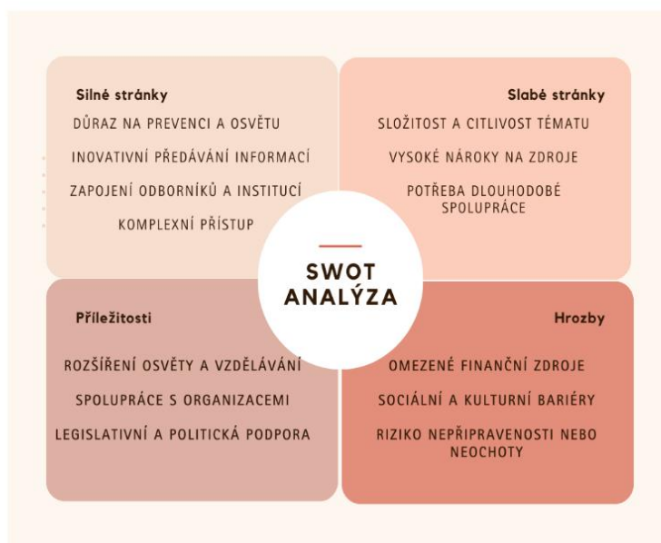
Obrázek 4.: SWOT analýza

V této kapitole se věnujeme SWOT analýze, která slouží k systematickému hodnocení silných a slabých stránek, příležitostí a hrozeb programů zaměřených na prevenci a osvětu o domácím násilí. SWOT analýza je nástroj strategického plánování, který umožňuje organizacím lépe pochopit své vnitřní i vnější prostředí a identifikovat oblasti pro rozvoj a zlepšení.