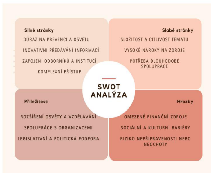
Obrázek 4.: SWOT analýza

V této kapitole se věnujeme SWOT analýze, která slouží k systematickému hodnocení silných a slabých stránek, příležitostí a hrozeb programů zaměřených na prevenci a osvětu o domácím násilí. SWOT analýza je nástroj strategického plánování, který umožňuje organizacím lépe pochopit své vnitřní i vnější prostředí a identifikovat oblasti pro rozvoj a zlepšení.