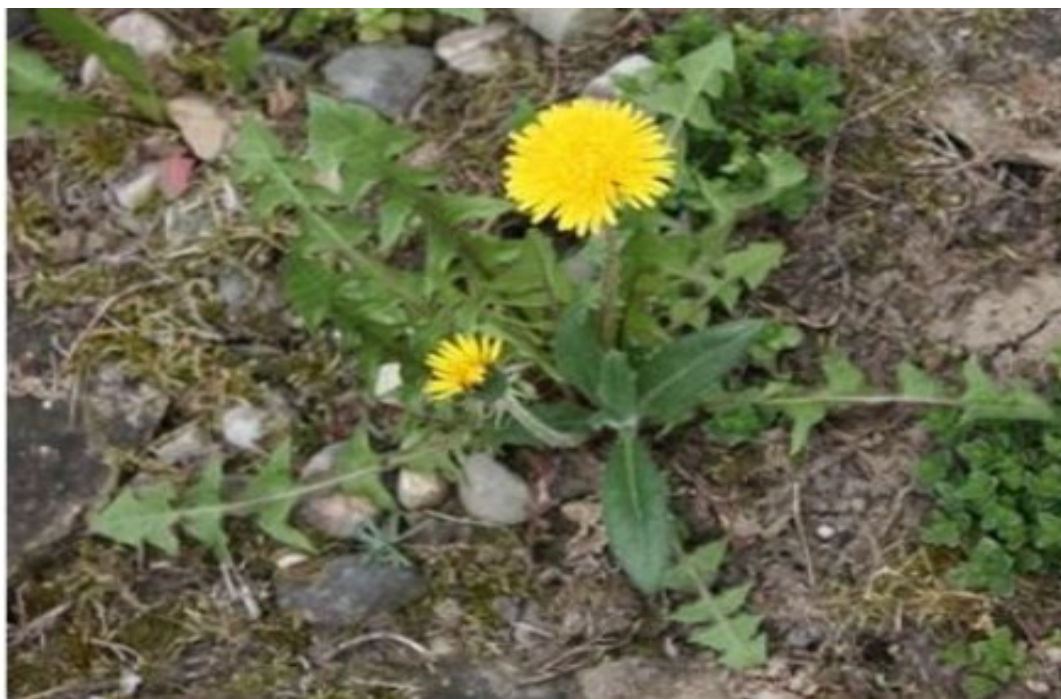
Obr. č. 22

Taraxacum officinale, vulgare (Smetánka lékařská) roste na loukách, pastvinách v zahradách, rumišťích i u vodních ploch.