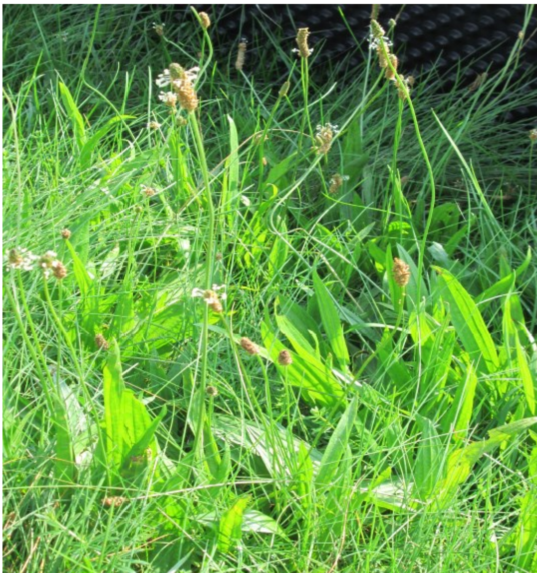
Obr. č. 24

Plantago lanceolata (Jitrocel kopinatý) roste na loukách, podél cest, v zahradách i na rumištních skládkách.