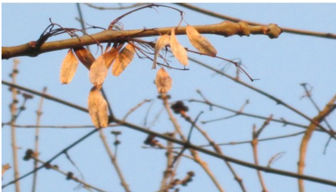
Obr. č. 9

Quercus robur (Dub letní) roste hojně v podobě celých lesů.