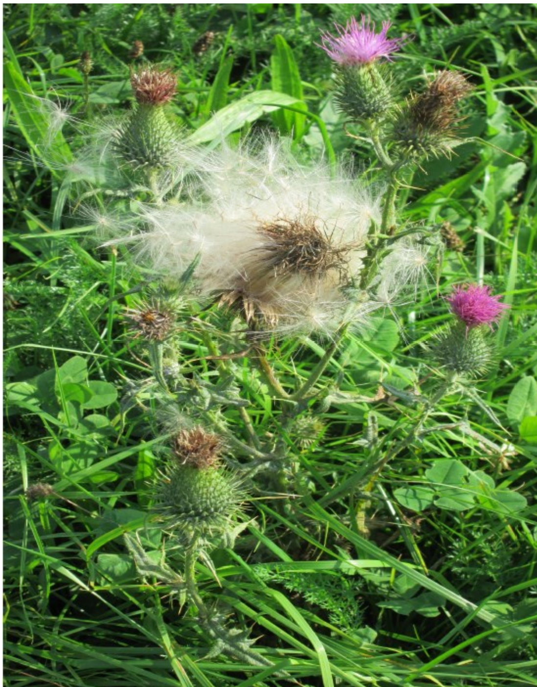
Obr. č. 16

Cirsium vulgare (Pcháč obecný) nejčastěji se vyskytuje na polích, zahradách, pastvinách i kolem komunikací.