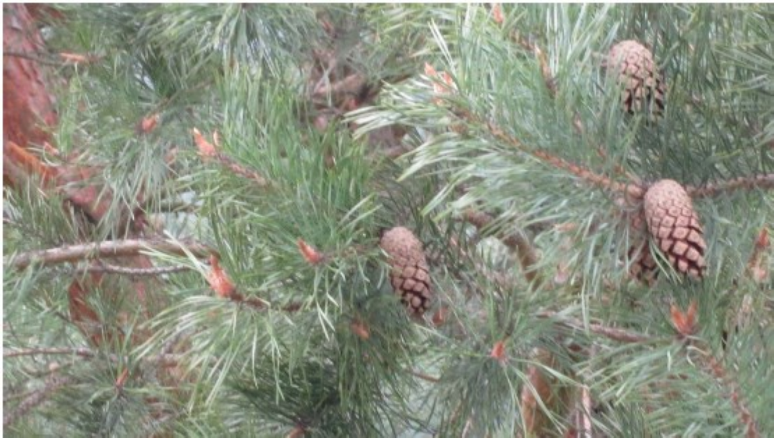
Obr. č. 12

(Pinus sylvestris) Borovice lesní roste v okolím lese.