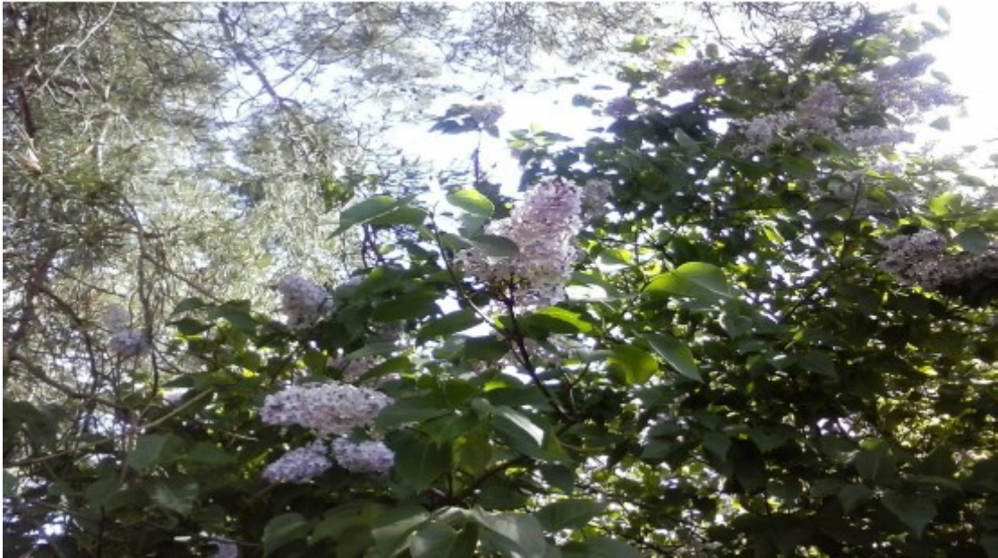
Obr. č. 10