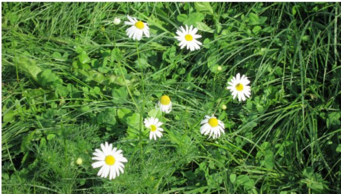
Obr. č. 19

Matricaria chamomilla (Heřmánek pravý) objevuje se hojně na loukách.