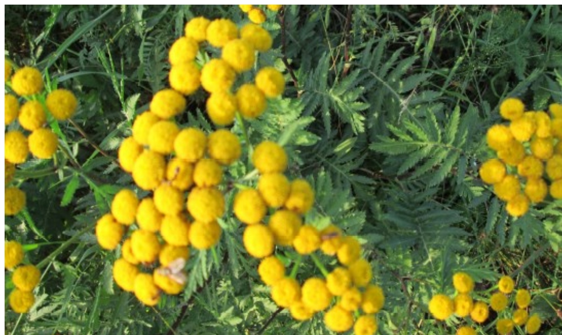
Obr. č. 21

Tanacetum vulgare (Vratič obecný) roste na pasekách a v blízkosti cest.