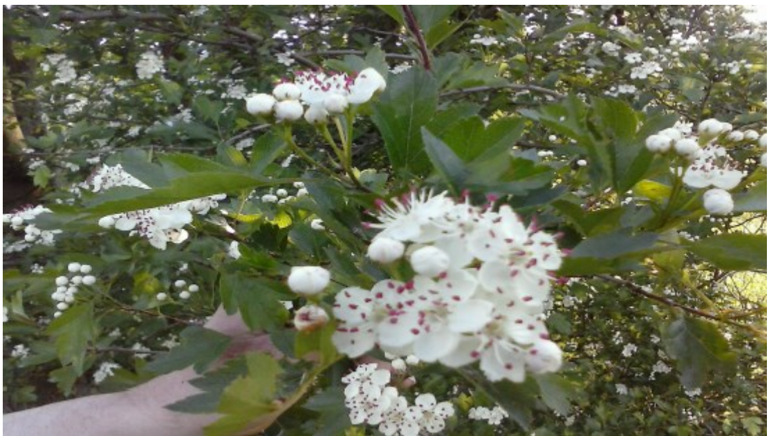
Obr. č. 13

(Pinus sylvestris) Borovice lesní roste v okolím lese.