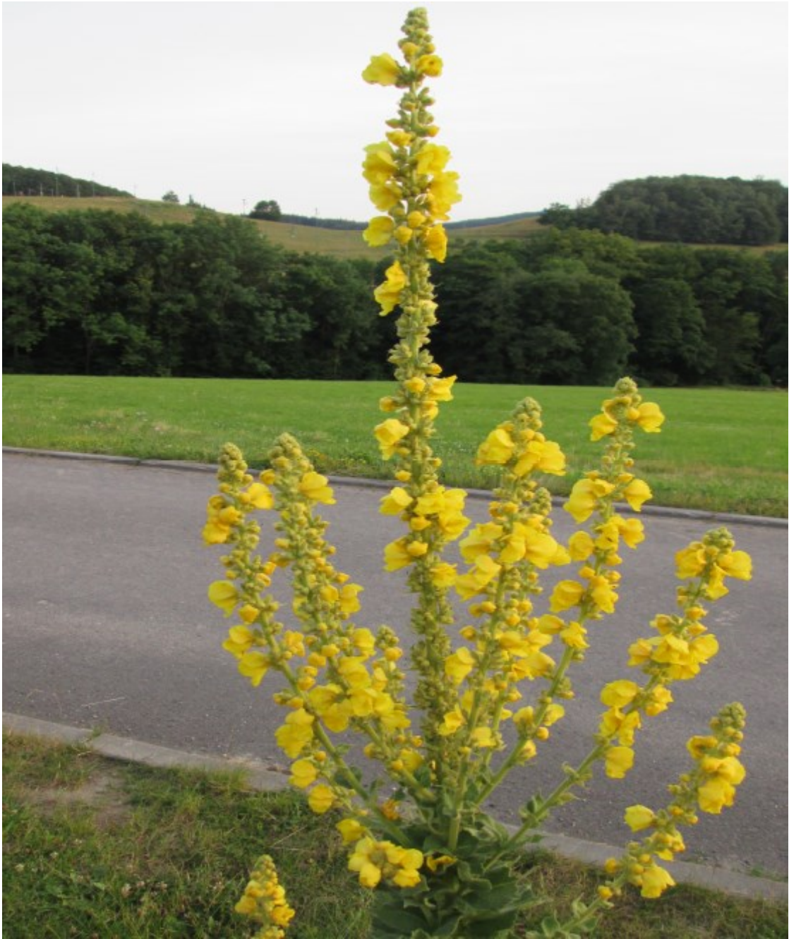
Obr. č. 26

Verbascum densiflorum (Divizna velkokvětá) pěstuje se v zahrádkách a roste u cest.