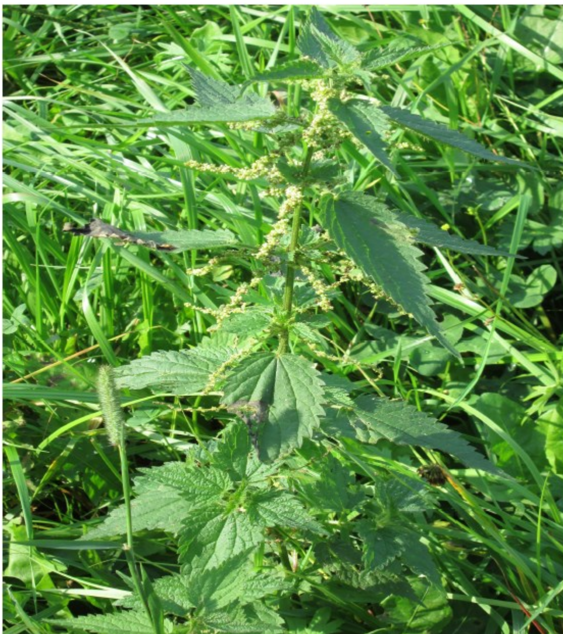
Obr. č. 27

Urtica dioica (Kopřiva dvoudomá) roste podél cest, v příkopech podél plotů, v lesích i křovinách.