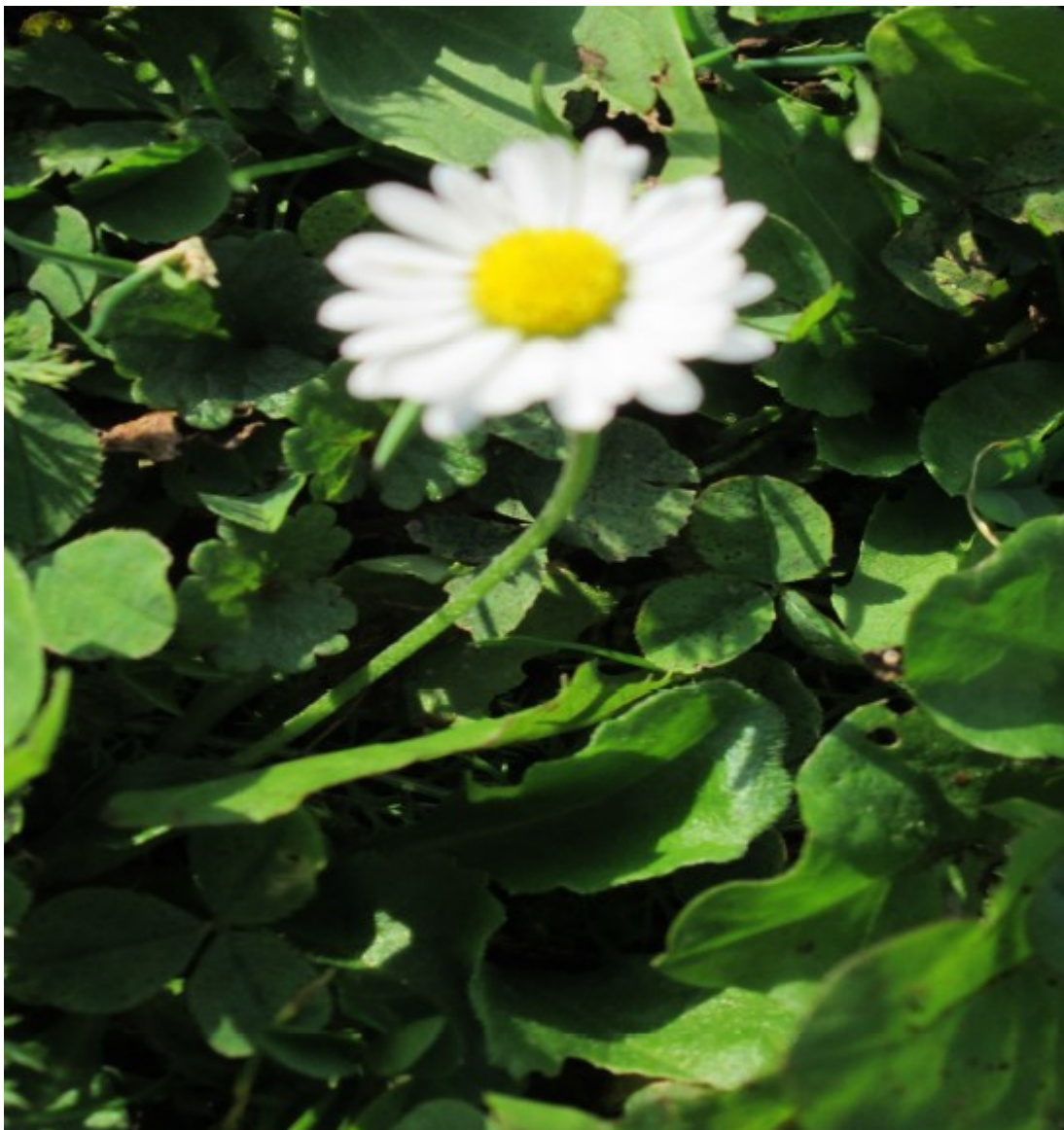
Obr. č. 14

Bellis perennis (Sedmikráska obecná) roste na loukách, zahradách i pastvinách.