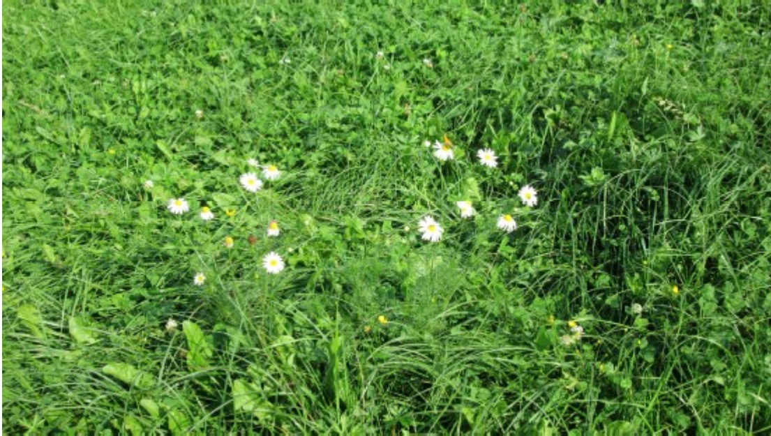
Obr. č. 18