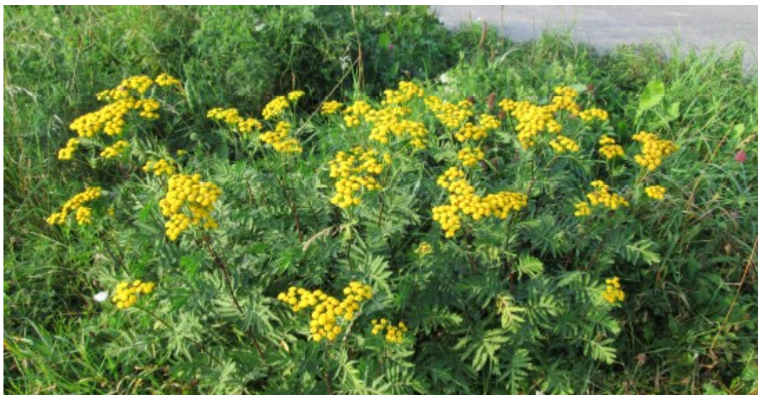
Obr. č. 20