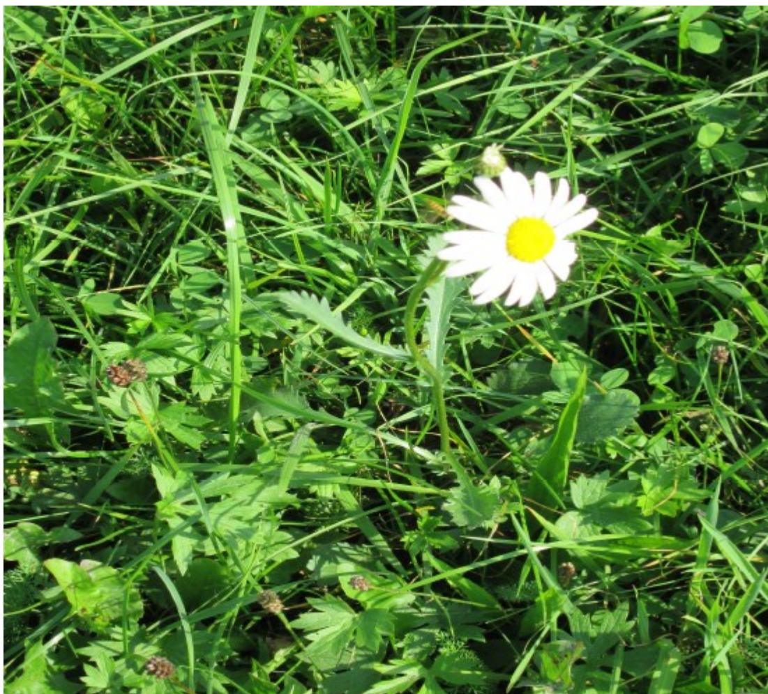
Obr. č. 17

Leucanthemum vulgare (Kopretina bílá) vyskytuje v zahradách, na loukách, pastvinách rumišťích i kolem cyklostezek a cest.