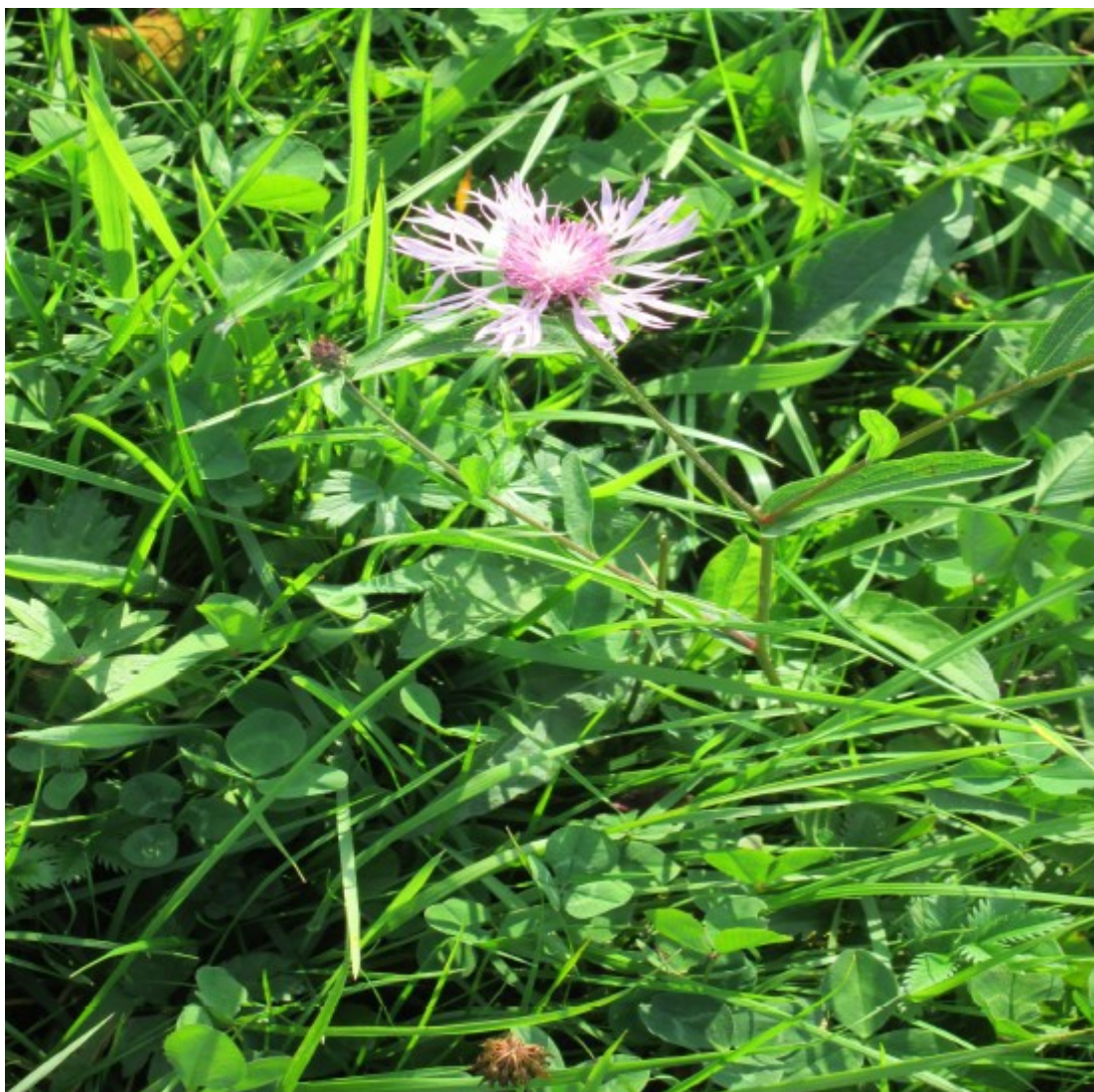
Obr. č. 15

Centaurea jacea (Chrpa luční) roste hojně na pastvinách a okrajích cest.