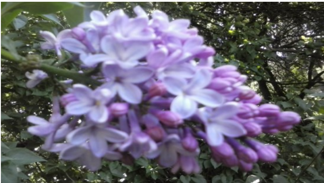
Obr. č. 11

Syringa vulgaris (Šeřík obecný) rostoucí jako okrasný keř zahrad.