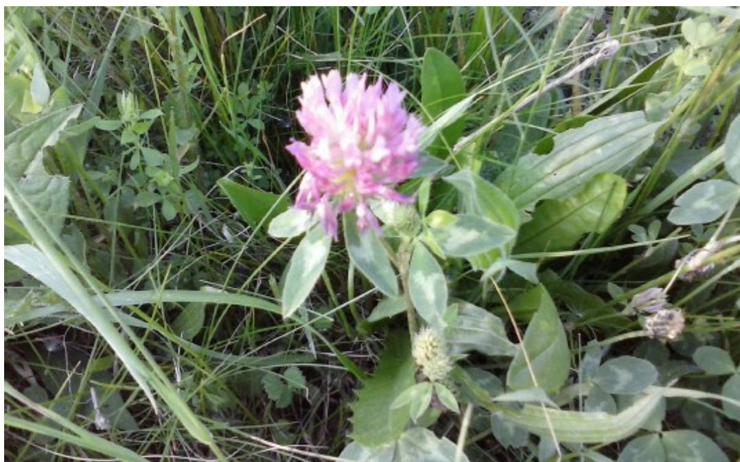
Obr. č. 23

Taraxacum officinale, vulgare (Smetánka lékařská) roste na loukách, pastvinách v zahradách, rumišťích i u vodních ploch.