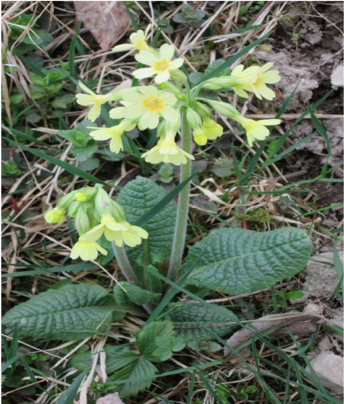
Obr. č. 25

Primula veris (Prvosienka jarní) roste na loukách, pastvinách ale i zahradách.