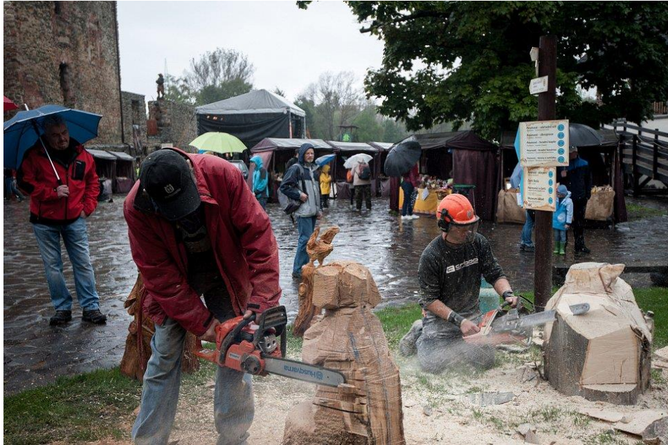
Obr. 2: Festival dřeva na Slezskostravském hradě