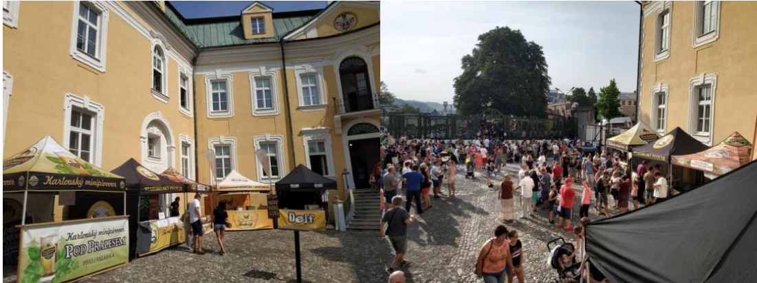
Obr. 4: Festival BEER FEST na zámku Bílovec