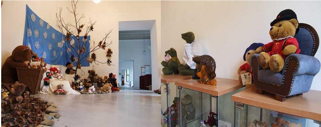
Obr. 3: Výstava plyšových medvědů na zámku Linhartovy